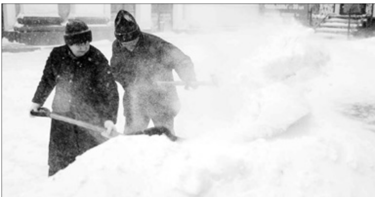
Сложнее всего в снегопады приходится дворникам и дорожникам.