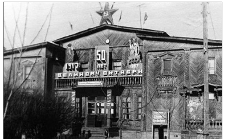
Деревянный клуб до сих пор функционирует (1967 год).