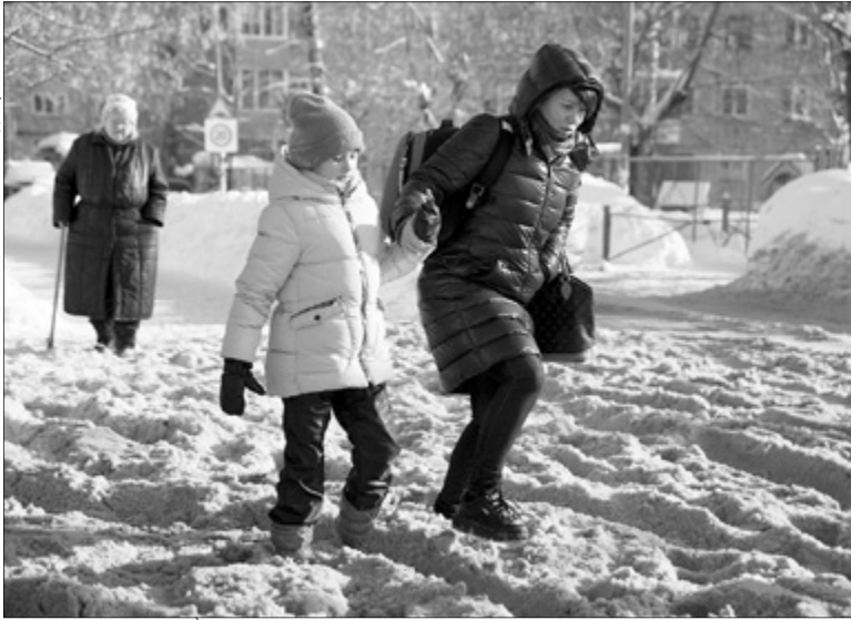
В снегопады добраться до школы или детского сада бывает непросто.

щение уюта, безопасности и удовольствия. Тем более что из-за погоды меньше вырабатывается гормона радости — серотонина".