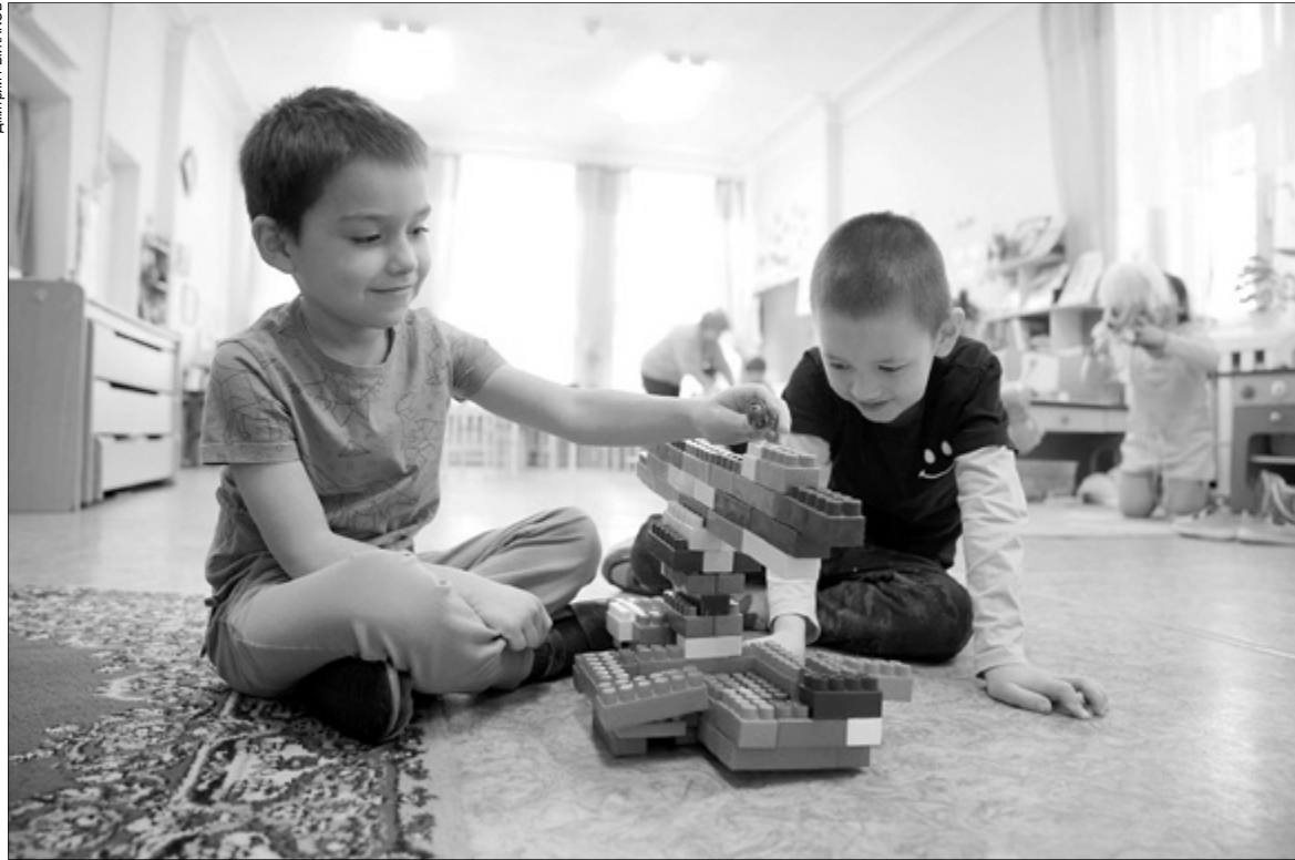
Дети и воспитатели детсада № 127 в Иванове ждут ремонта фасада и кровли в 2026 году.

Как в Ивановской области ремонтируют детские сады