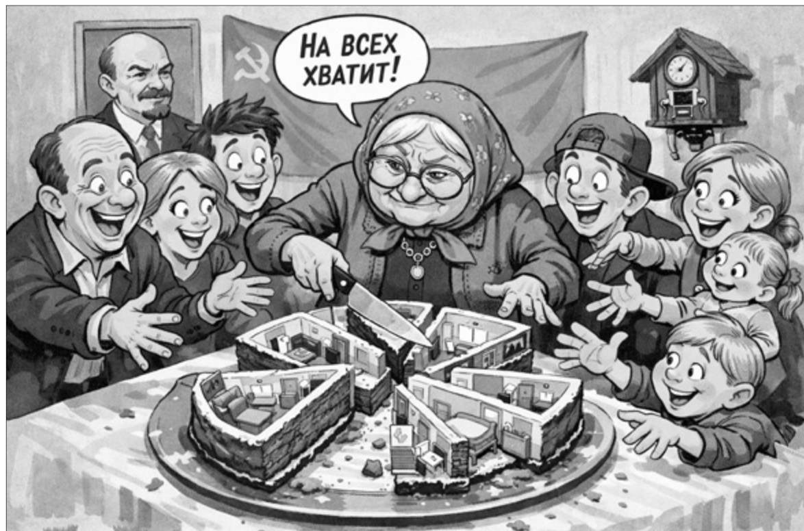
Желание угодить всем родственникам может обернуться боком.

— Единственным нормальным способом преодоления подобной проблемы может стать массовое правовое просвещение населения. В такой ситуации можно порекомендовать бабушке оставить квартиру в наследство одному из родственников с возложением на него обязанности по выплате компенсации другим членам семьи. К примеру, один ребенок становится собственником квартиры и в определенный период выплачивает другим детям определенную сумму денежных средств. Так никому не будет обидно.