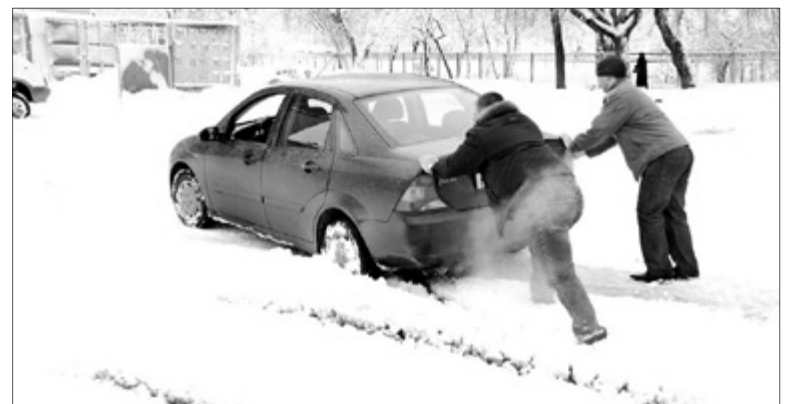
Помочь попавшим в беду всегда найдутся охотники.

За январь жители Ивановской области почти 15 000 раз вызывали скорую помощь — это практически по 500 звонков за сутки. Чаще всего обращаются к медикам заставляли признаки острых респираторных заболеваний, включая грипп и ОРВИ. На втором месте по числу январских обращений — болезни системы кровообращения: гипертонические кризы, подозрения на инфаркты. Нередки были и вызовы на травмы и несчастные случаи, связанные с гололедом и активным зимним отдыхом.