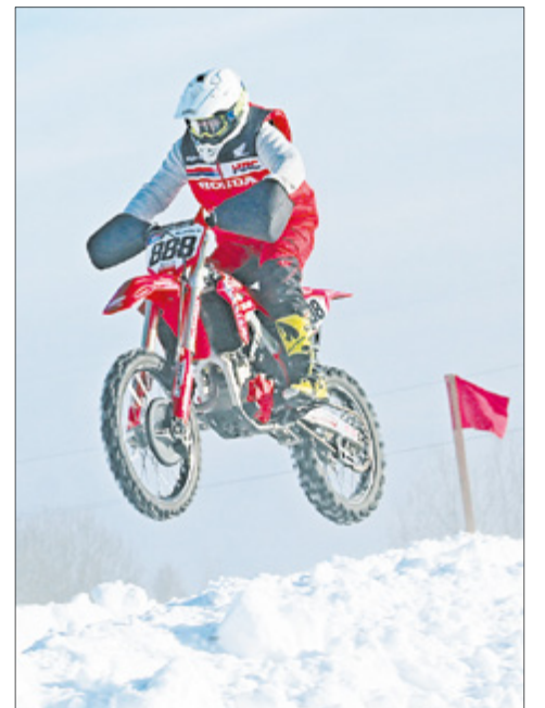
Зрителей привлекали эффектные прыжки.