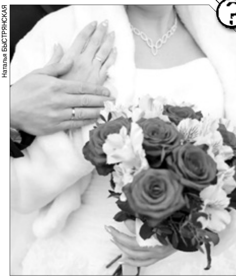
Брачный договор может быть заключен и до свадьбы, и во время семейной жизни.

"Брачный договор не может ограничивать правоспособность или дееспособность супругов; их право на обращение в суд за защитой своих прав; регулировать личные неимущественные отношения между супругами, права и обязанности супругов в отношении детей; предусматривать положения, ограничивающие право нетрудоспособного нуждающегося супруга на получение содержания; содержать другие условия, которые ставят