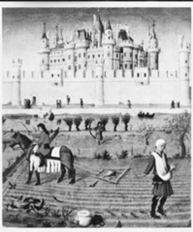
Школьные годы целого поколения связывает эта книга.