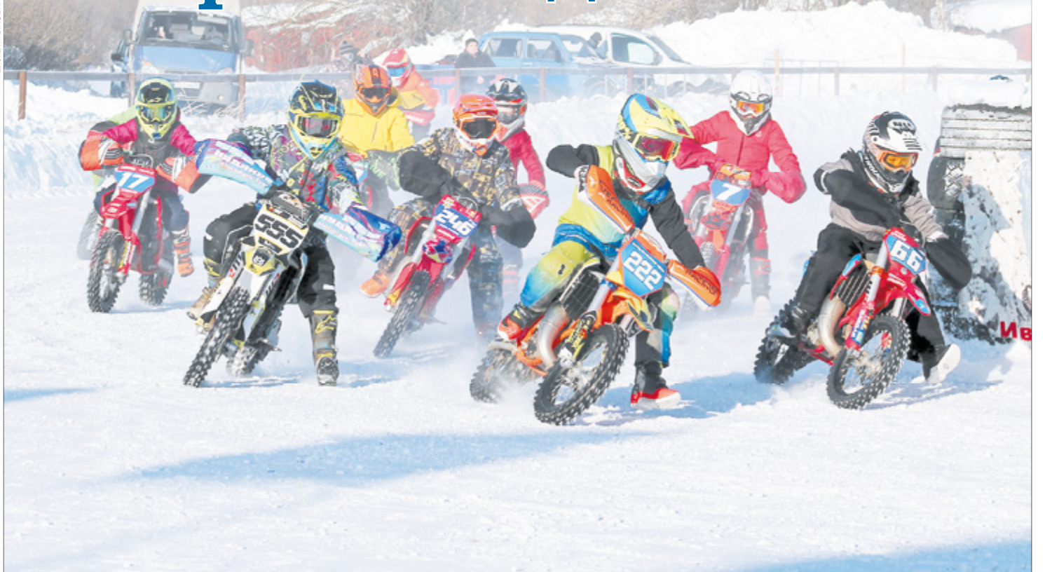
Самый массовый заезд в классе двигателей 65 кубов.