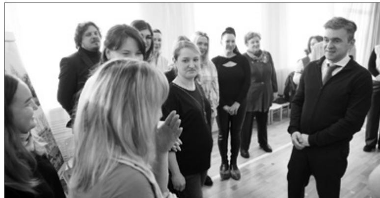
Общественный контроль и внимание главы региона повлияли на ответственность подрядчиков.

Высокого результата помогает добиться общественный контроль: от формирования списков до приемки работ. Детские сады включают в план по предложениям активистов, а представители Общественной палаты и родители следят за ходом работ и участвуют в проверках качества.