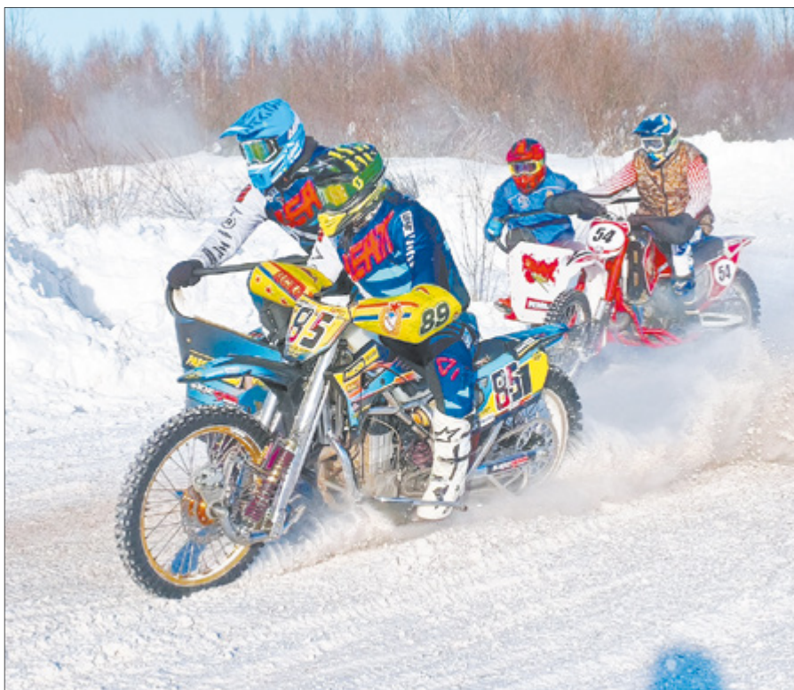
Лидеры гонки — экипажи из столицы, все — мастера спорта.