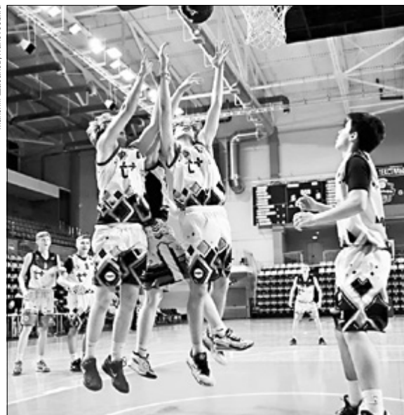
Максим Шаронов, ivgazeta.ru