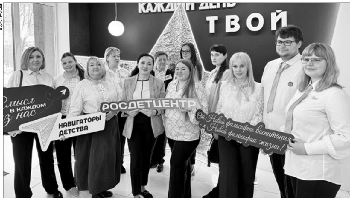
На форуме в "Солярисе" приняли участие 275 советников по воспитанию.