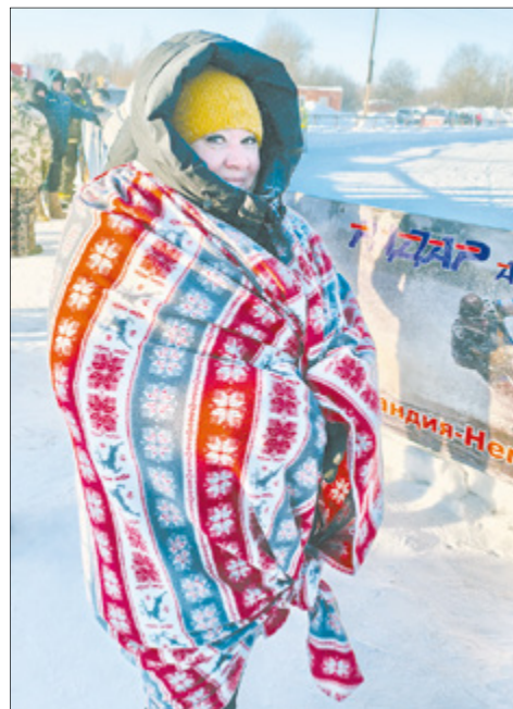
Мотоболельщицы мерзли, но не покидали соревнования.