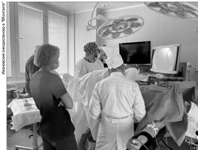
Врачи онкодиспансера планируют активно внедрять передовую технологию.

Этот метод действует так: сначала пациенту внутривенно вводится специальный препарат, который накапливается только в клетках опухоли. Затем к опухоли через эндоскоп подводят лазерное излучение определенной