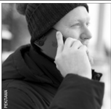
Для улучшения качества услуг "МегаФон" постоянно обновляет инфраструктуру.

Максимальное наказание по статье "Мошенничество в особо крупном размере" — десять лет колонии, напоминает пресс-служба судов общей юрисдикции Ивановской области.