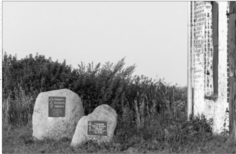
В 2014 году возле храма установлен пятитонный камень с мемориальной доской, посвященной Ивану Цветаеву.