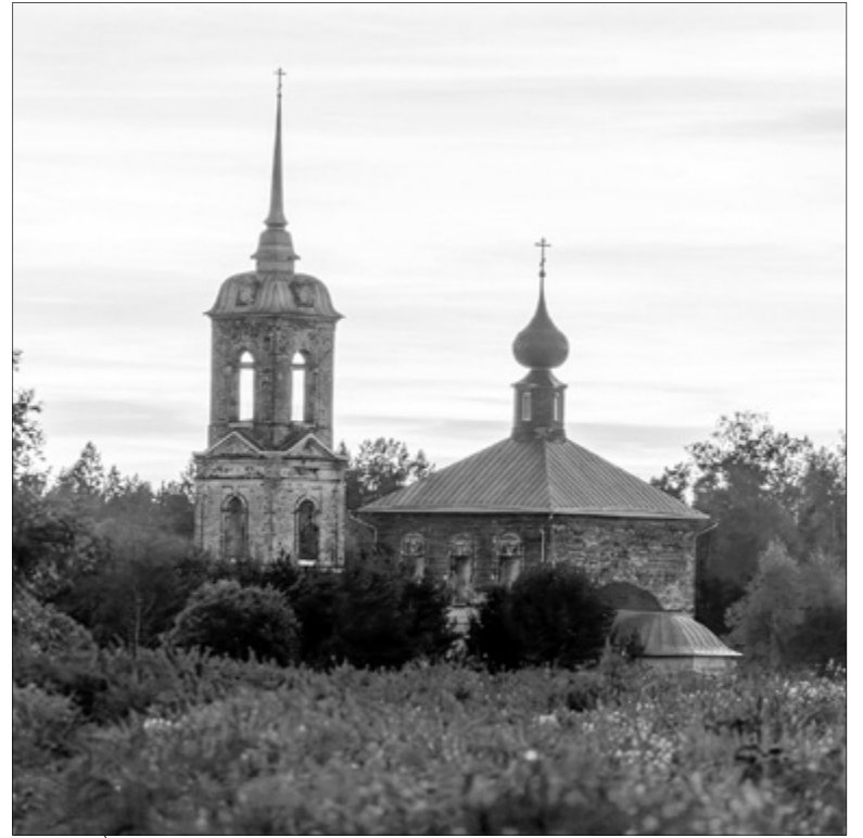
Сейчас на месте Дроздова сохранились только кладбище и Воскресенский храм.