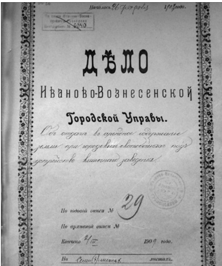
Обложка дела о сдаче земли в аренду под кишечное заведение (1909 год).