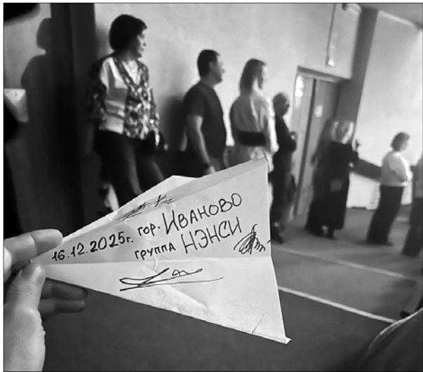
Самолетик с автографами группы "Нэнси" приземлился в Иванове.

На сцене ивановского ЦКиО выступила поп-рок группа "Нэнси", которой исполнилось 33 года. В этот день группа дала 217-й концерт.