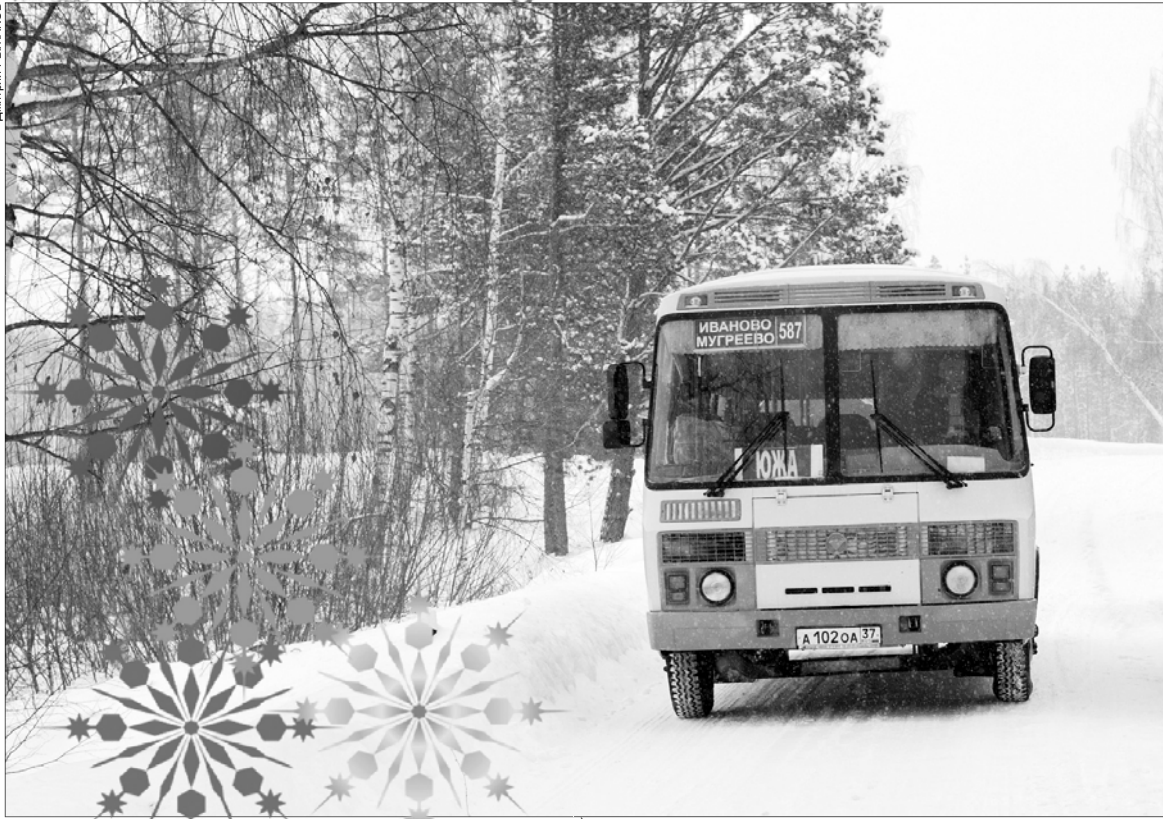
Возить пассажиров в отдаленные деревни перевозчикам невыгодно.