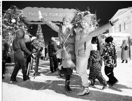
В Иванове и Шуе проходит фестиваль "Русское Рождество".

"РУССКОЕ РОЖДЕСТВО" (0+) С 22 декабря Иваново, железнодорожный вокзал (Вокзальная пл., 3) Круглосуточно: Выставка "Путешествие в Рождество" 9:30–19:30 Рождественская почта 9:30, 14:30 Театрализованная программа Шуя 10:00–18:00 Выставка "После иконы" в Музее Фрунзе ( Малахия Белова, 11/13 ) 11:00–19:00 Выставка "...В красоте Его святости" в музее Бальмонта ( Ленина, 2 ) 11:00–19:00 Выставка "Рождество в доме Павлова" в культурном центре "Павловский" ( 1-я Московская, 38 ) Выставка "История рождественского поезда" (железнодорожный вокзал Шуи) Инсталляция "Храм". Световой парк христианского искусства "Путь света", сквер пл. Ленина Ежедневно из Иванова в Шую и обратно будет курсировать ретропоезд. Билеты можно приобрести на сайте ivanovokonzert.ru .