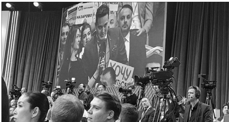
Плакат "Хочу жениться" принес желаемый результат.

Теперь задача региональных властей — перевести обращение граждан в практическую плоскость. Губернатор поручил профильным департаментам и комитетам проанализировать все поступившие от ивановцев вопросы и выработать планы по их решению.