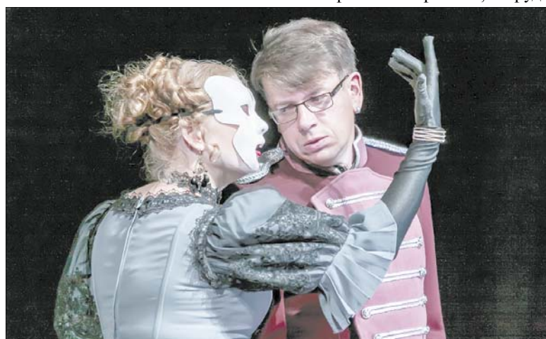
"Маскарад" – первый совместный проект Кинешемского театра с московской "Школой драматического искусства".