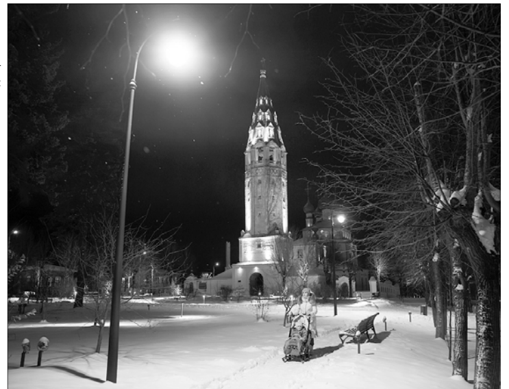
В Палехе появилось уютное пространство для отдыха, провели новое освещение.