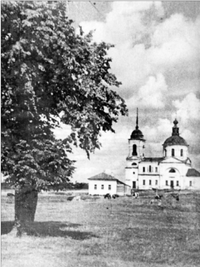
От Гончарова, где похоронены мать и сын Бестужевы, не осталось и церкви.

На территории Ивановской области покоится прах Прасковьи Бестужевой — матери декабристов, которая без мужа (он скончался, когда она была еще сравнительно молодой) сумела вырастить восьмерых детей. Пятеро сыновей вошли в историю России.