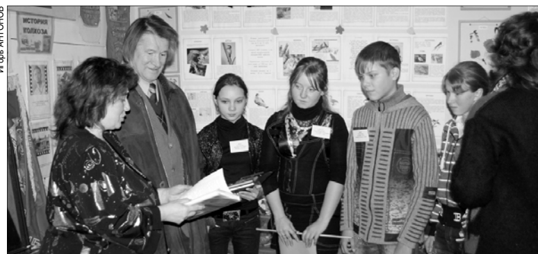
Юрий Орлов встречается с учениками одной из школ Палехского района.

сти автора, целеустремленности, переживаемости за судьбу своего края и страны в целом. Его поэзия многогранна: в ней найдутся и пронзительные строки о войне, и лирические — о любви и природе, и масштабные размышления об истории родины.