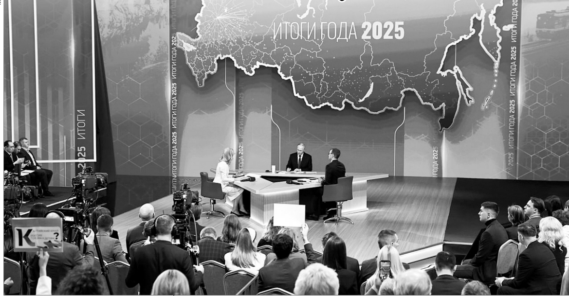
За время прямой линии и большой пресс-конференции прозвучало более 80 вопросов и просьб.

размер плакатов, которые можно было использовать, организаторы ограничились форматом А4 (с альбомный лист), чтобы никто не перекрывал друг друга. Поэтому представители СМИ старались привлечь внимание и другими способами: национальными костюмами, яркими нарядами, кокошниками.