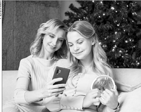
В новогодние праздники потребление мобильного интернета растет.

Специалисты посчитали, что активнее всего в новогодние каникулы клиенты смотрят онлайн-ТВ: его доля среди потребления всех онлайн-сервисов составляет 41%, на втором месте — соцсети (22%), замыкают топ-3 мессенджеры (18%). Наибольший рост в предыдущую новогоднюю ночь показали сервисы "VK Видео", соцсеть "VK" и онлайн-кинотеатр "Кинопоиск".