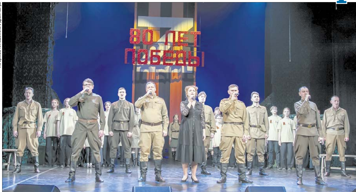
Концерт "А нам нужна одна Победа" собирал аншлаги.

мощью троса, а нажатием кнопки на пульте. Это значительно сокращает трудозатраты. В этом году автоматика будет установлена еще на семь штанкетов, где монтируют самые тяжелые декорации.