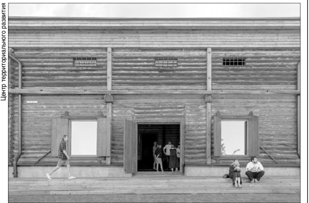
Лабаз собирает креативных людей из разных регионов России.

Уже второй год премия "Наследие дорожке" поддерживает инициативы по сохранению исторического архитектурного наследия России и поощряет тех, кто бережет его по стремлению, а не по обязанностям.