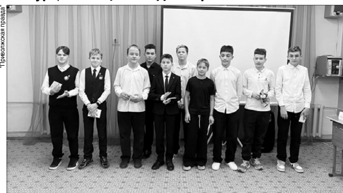
Конкурс "Мировой парень — 2025" собрал учеников из десяти кинешемских школ.

В Центре внешкольной работы состоялся традиционный городской военно-патриотический конкурс, посвященный Дню героев Отечества.