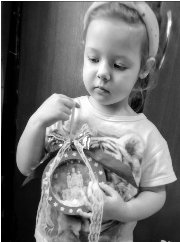
Делать праздничное окошечко на конкурс малышке помогли родители и воспитатели.