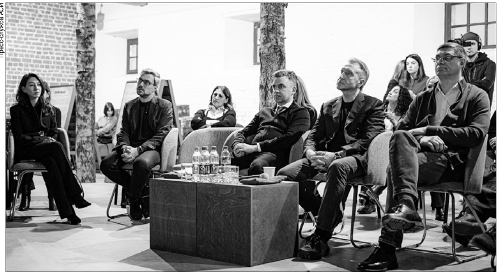
В Гавриловом Посаде обсудили новый подход к развитию малых городов.

Глава ВЭБ.РФ Игорь Шувалов подчеркнул особую ценность малых городов для страны: "Малые города России играют важную роль в сохранении национального культурного кода. Здесь сохраняется особый дух и уникальная атмосфера, что делает их настоящими точками притяжения для познавательного туризма. Важно поддержать предпринимателей, которые