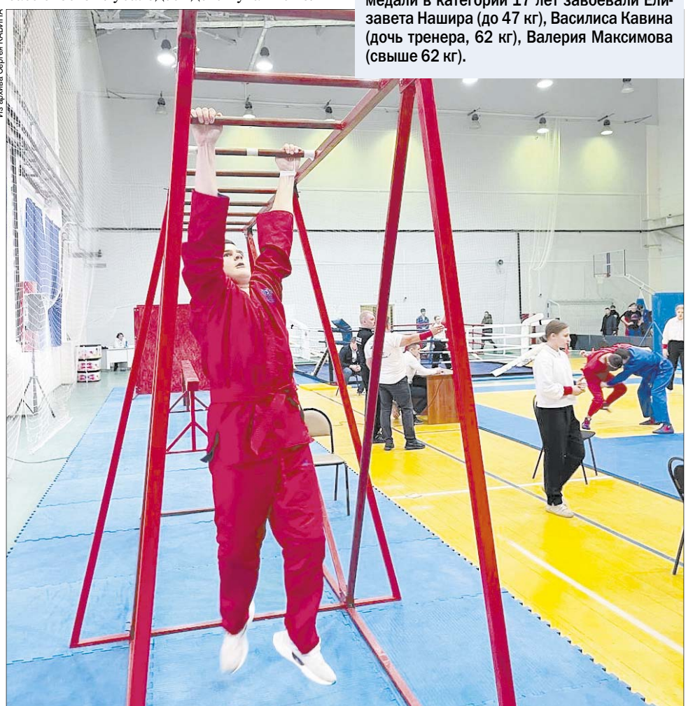
К полосе препятствий в универсальном бое спортсмен был готов.