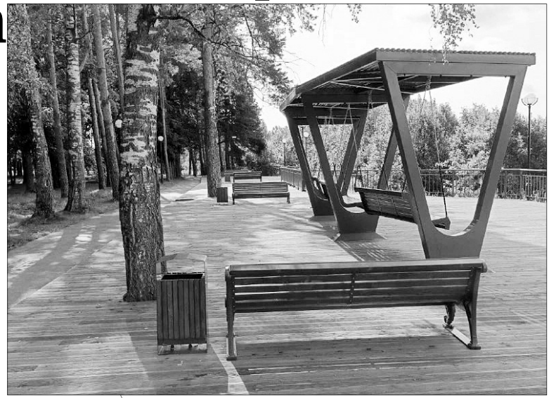
Василёвский парк превратился в современное красивое пространство для отдыха всех поколений.

Для тепла и уюта наших малышей в детском саду № 2 Приволжска отремонтирована система отопления. В Толпыгинской