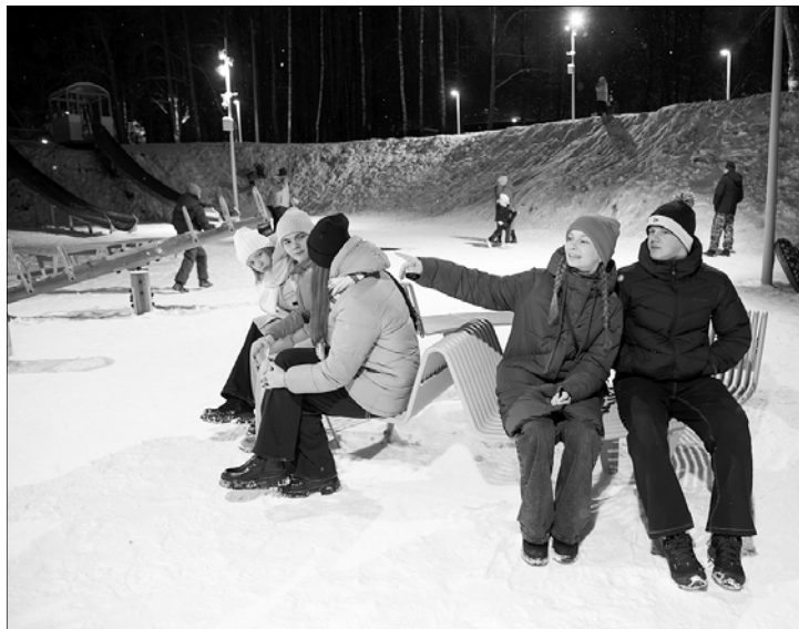
Шуя — крупный промышленный центр, где развивается и туризм.

...Будущее малых территорий строится не по шаблону, а через синергию государственной поддержки, инвестиций и, самое главное, энергии местных жителей, которые верят в свою малую родину и вкладывают в нее силы и душу.