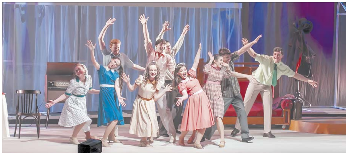
Одной из премьер сезона стал спектакль "Выбор".

В Международный день инвалидов в Кинешемском драматическом театре прошел бал "Мир без границ" с участием детей с ограниченными возможностями здоровья и их родителей. Торжество организовали члены организации "М.О.С.Т." – мамы детей.