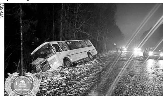
Водитель ПАЗа не справился с управлением и оказался в кювете.

На втором километре подъезда к поселку Подвязновский 58-летний водитель автобуса "ПАЗ" с 20 пассажирами в салоне не справился с управлением и съехал в правый кювет по ходу движения. Как пишет "Наше слово", в результате ДТП 69-летняя пассажирка с переломом пальца доставлена в больницу, 39-летняя женщина с ушибами самостоятельно обратилась в травмпункт.