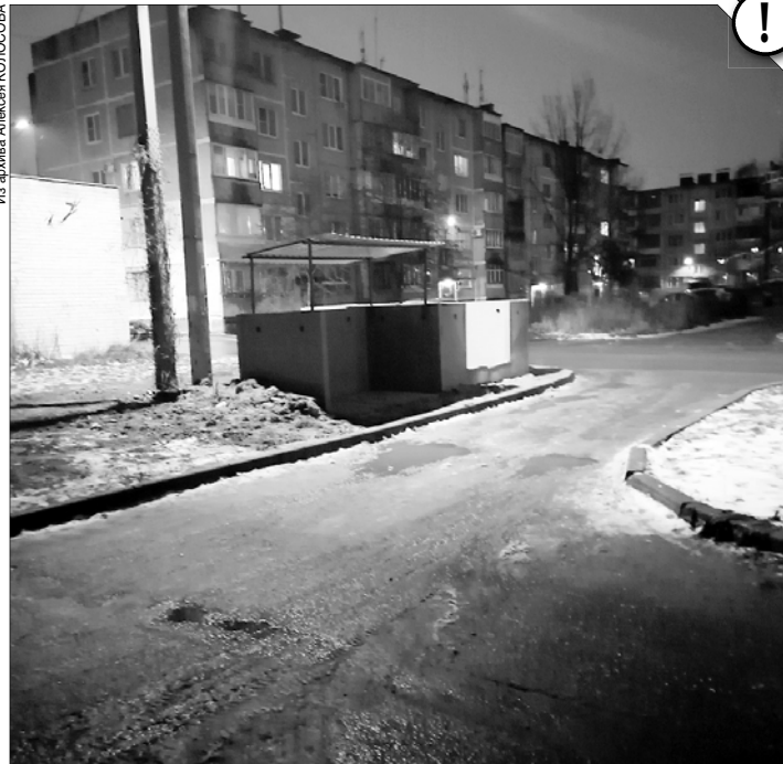
По мнению местных жителей, установка контейнерной площадки нарушает сразу несколько норм.