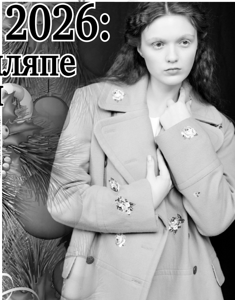
Яркое пальто с аппликациями — лучший выбор для встречи Нового года на улице.