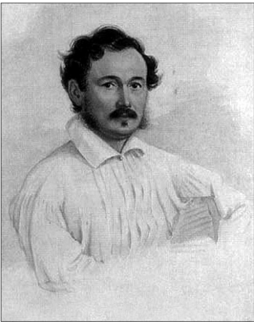
Декабрист Дмитрий Щепин-Ростовский родился и умер в Шуе.

Щепина-Ростовского. Всего ему инкриминировались ранения пятерых человек.