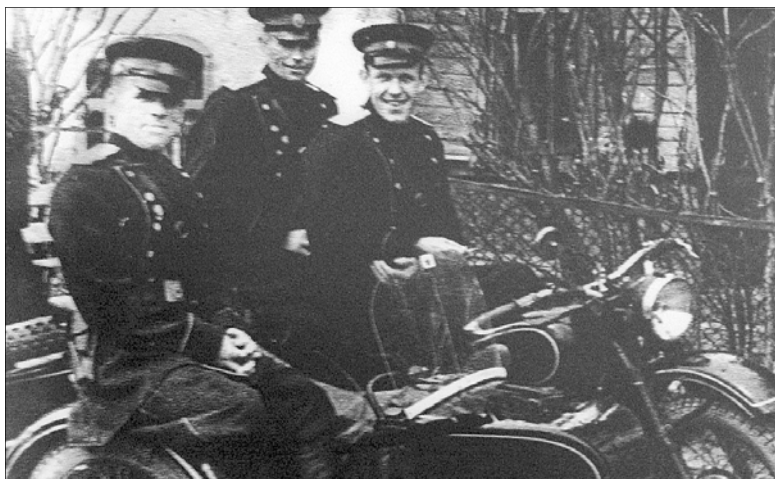
Группа работников Лежневского МВД готовится к выезду.