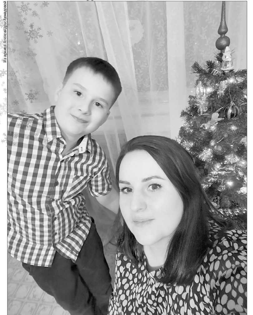
Мама и сын – не разлей вода, всегда вместе.