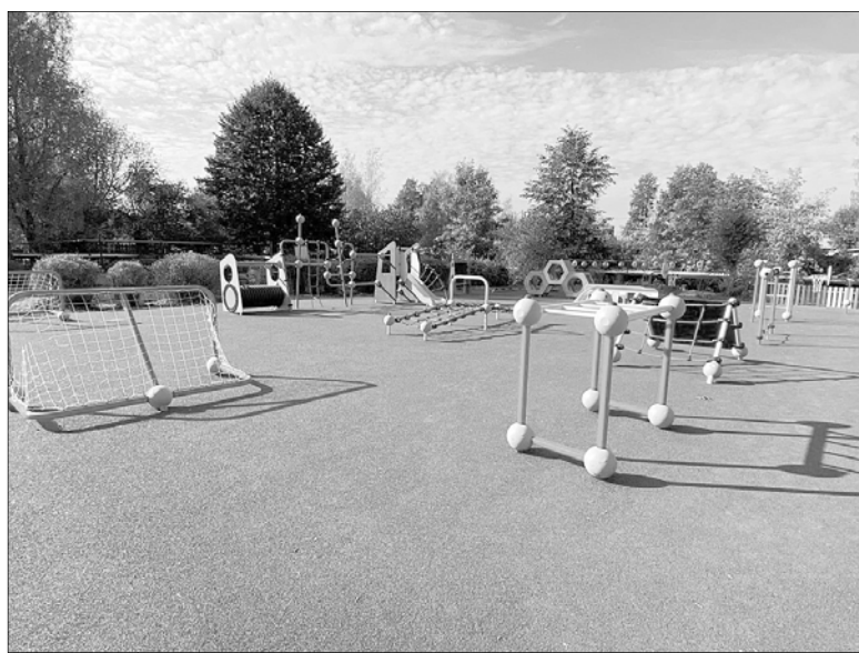
В Приволжском районе появляются новые детские и спортивные площадки.

Накануне Нового года и Рождества хочется всем пожелать крепкого здоровья, духовных сил и добрых устремлений, единения и мира!