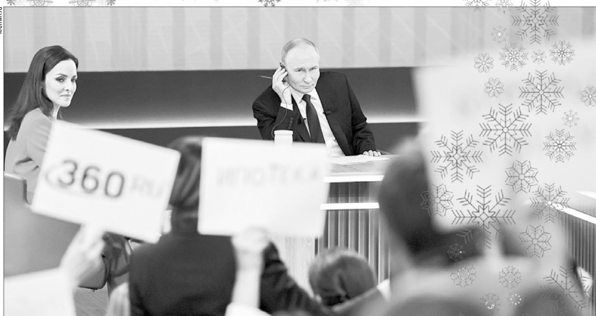
За четыре с половиной часа президент ответил на 76 вопросов.

Большой пласт вопросов, поступивших от граждан, касался выплат бойцам СВО и поддержке их семей. Так, президенту рассказали о том, что военнослужащие, которые сейчас выполняют свой долг в Курской области, получают выплаты как участники контртеррористической операции – суммы, несо-