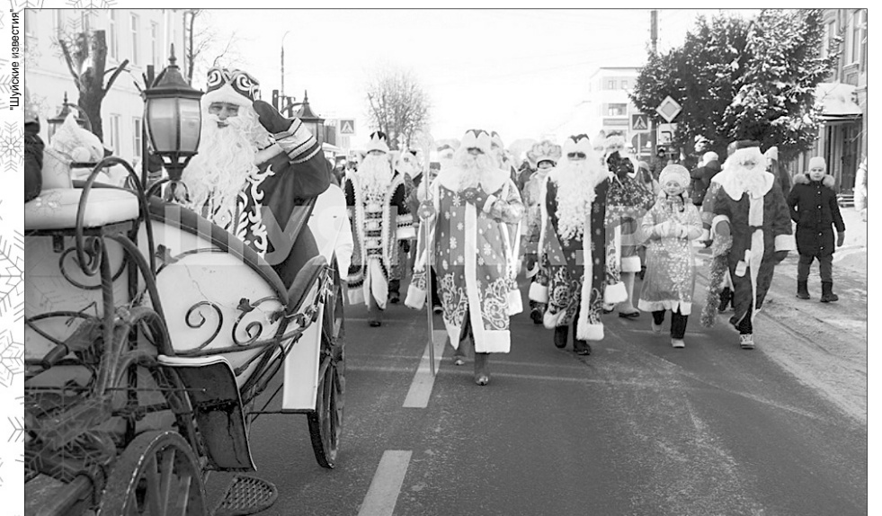
По улицам Шуи прошло шествие Дедов Морозов.