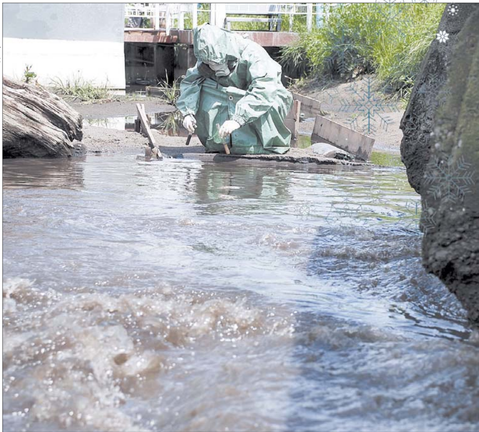
Ежедневно тысячи волонтеров со всей страны выходят на побережье Черного моря, чтобы очистить его от мазута.