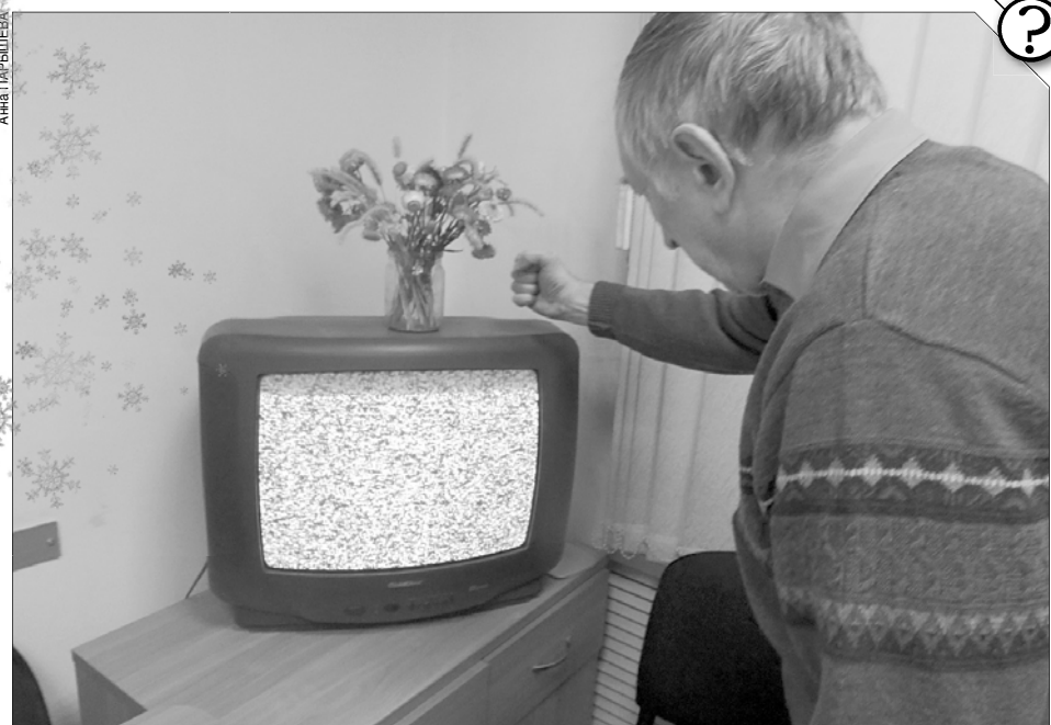
Срок устранения недостатков товара не может превышать 45 дней.

Как пояснили специалисты Ивановского управления экономического развития и торговли, срок устранения недостатков товара не может превышать 45 дней. Отсутствие необходимых запасных частей (деталей, материалов), оборудования не освобождают от ответ-