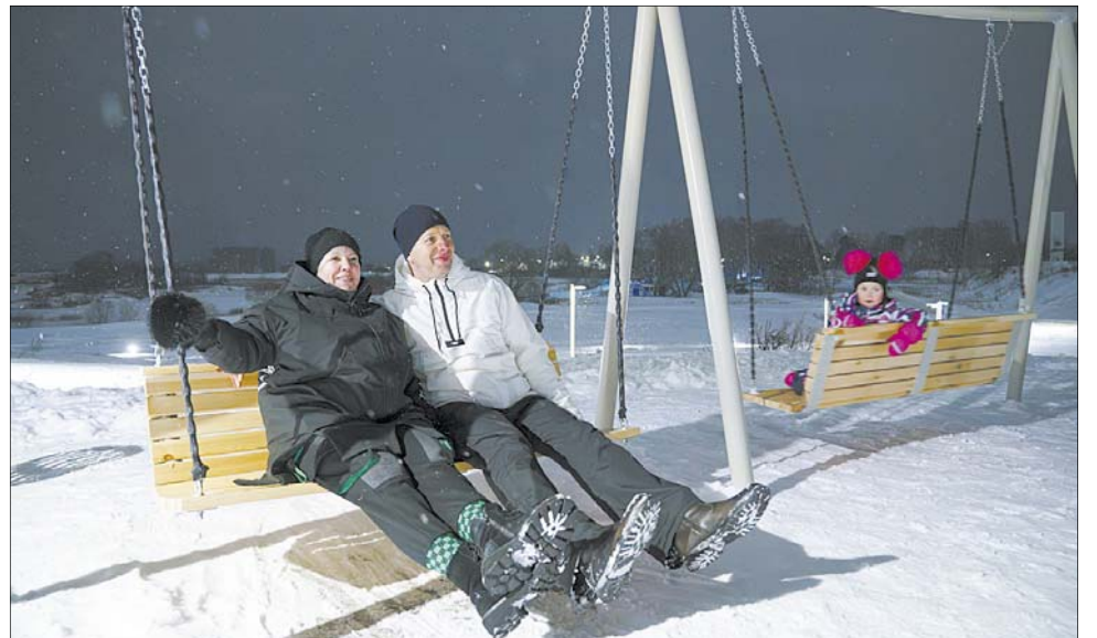
...прогулочный маршрут "Тропа здоровья", на возвышенности – качели с видом на Тезу.