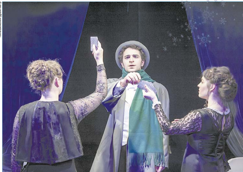
"Пиковую даму" оценили авторитетные театральные критики.