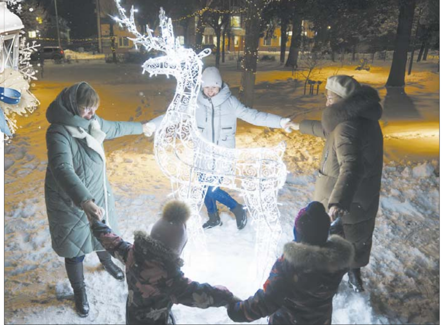
Вокруг сказочного оленя водят хороводы.