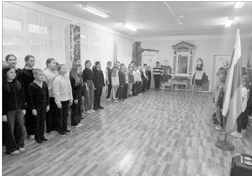
Церемония подъема государственного флага России.

...Это только несколько примеров того, как чтут память героев в ивановских школах. Имена командиров и бойцов, отдавших жизнь за Родину, увековечены на мемориальных досках, партах героев. Их пример служит воспитанию у молодежи патриотизма, духовно-нравственных качеств.