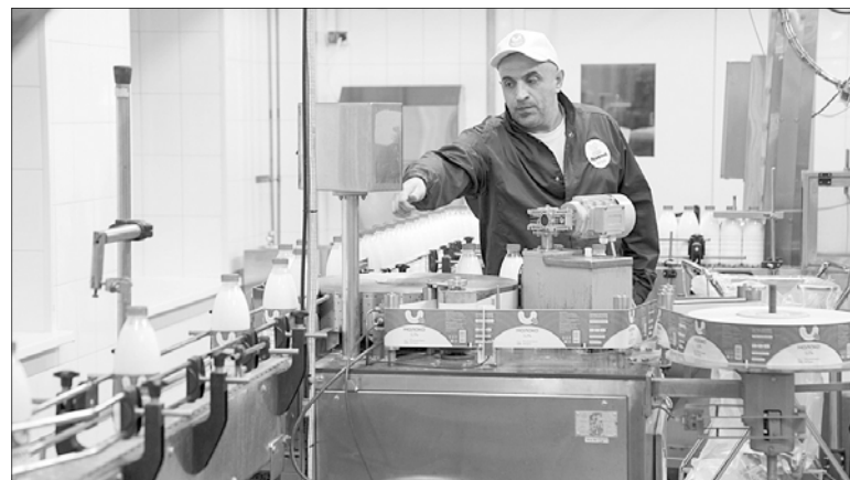
Завод будет принимать молоко прежде всего с местных ферм.

"Сейчас молодняк размещен в нескольких животноводческих помещениях, что неудобно в плане кормления, контроля и соблюдения всех технологических процессов. Поэтому принято решение о строительстве двух новых телятников. В этом году возводим