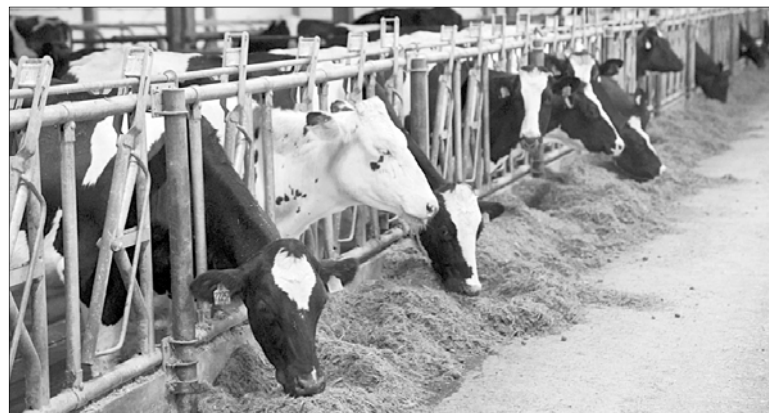
"ГорМол" из Савинского района планирует увеличить поголовье до 1100 коров.

"В регионе сейчас одновременно строится восемь ферм, после ввода которых суммарно почти 30 000 тонн молока дополнительно будет производиться в Ивановской области. Молочное скотоводство — одно из самых перспективных направлений в наших широтах, мы так и планировали, на молоко ставили. Плюс