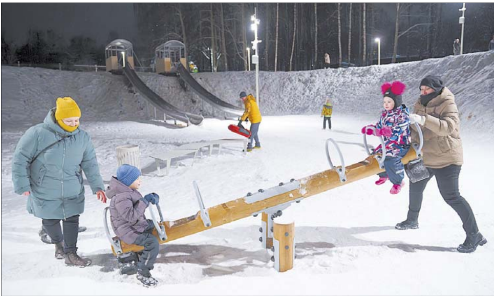
В декабре закончилось благоустройство Шуйского городского парка. В нем появились детская игровая и спортивные площадки...