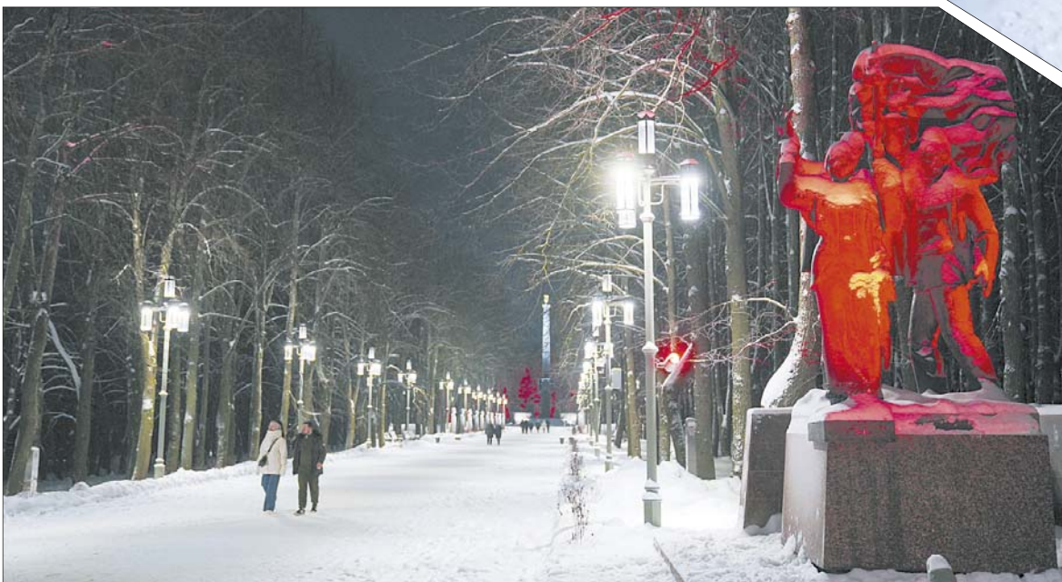
Фонари на аллее – точные копии старинных светильников.