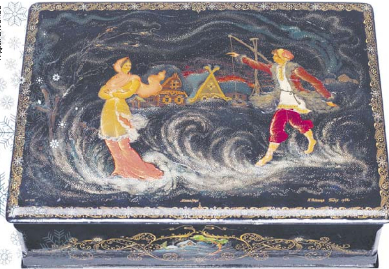
В "Метелице" Ивана Чельшева снежные завихрения гармонируют с изящными изгибами человеческих фигур.