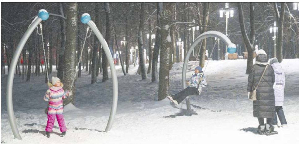
Мемориальный ансамбль "Красная Талка" в Иванове благоустроили по федеральному проекту "Формирование комфортной городской среды".