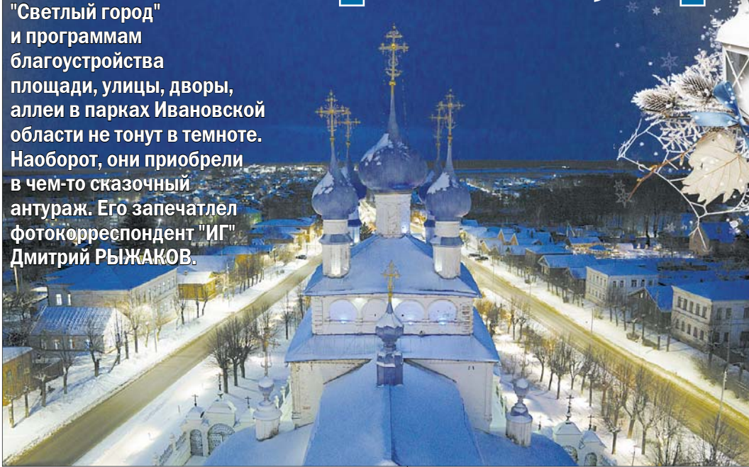
По проекту "Светлый город" в Палехе осветили 95% улиц.