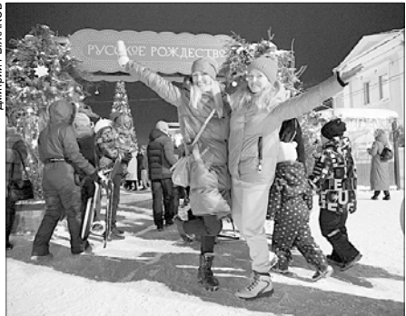
В Иванове и Шуе стартовало "Русское Рождество".

С 27 декабря, 11:00–21:00 Рождественская ярмарка с угощениями и сувенирами (Центральная площадь перед кинотеатром "Родина")