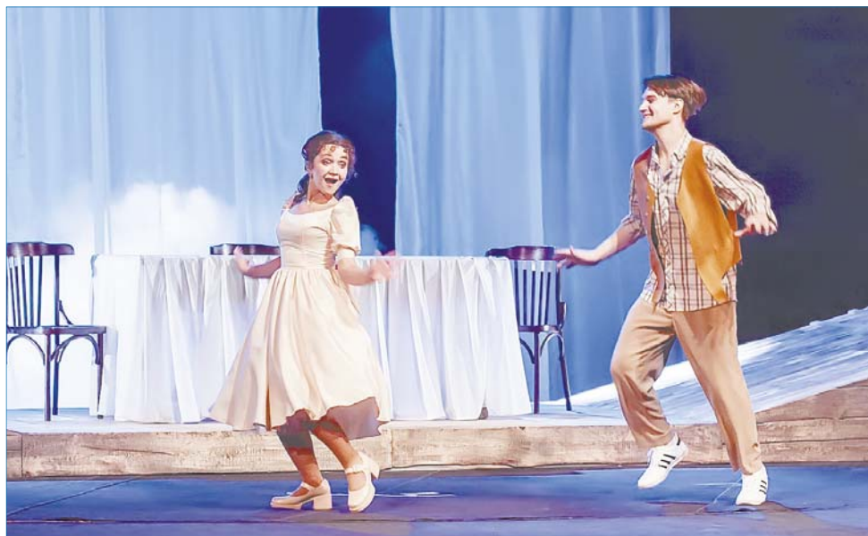
Декабрьская премьера кинешемцев — "Отцы и дети".