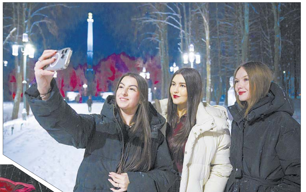
В городе появилось еще одно место для красивых селфи.