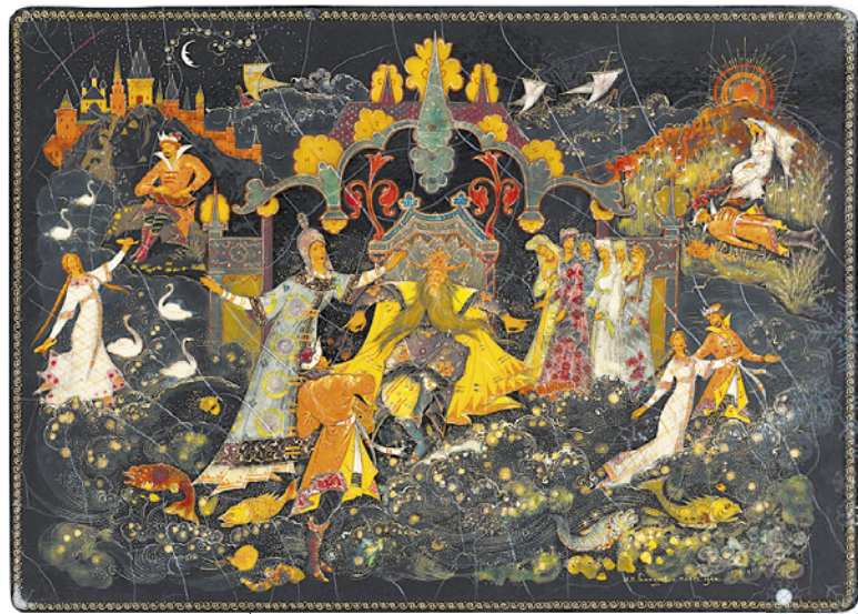
Шкатулка народного художника РСФСР Ивана Вакурова "Садко".