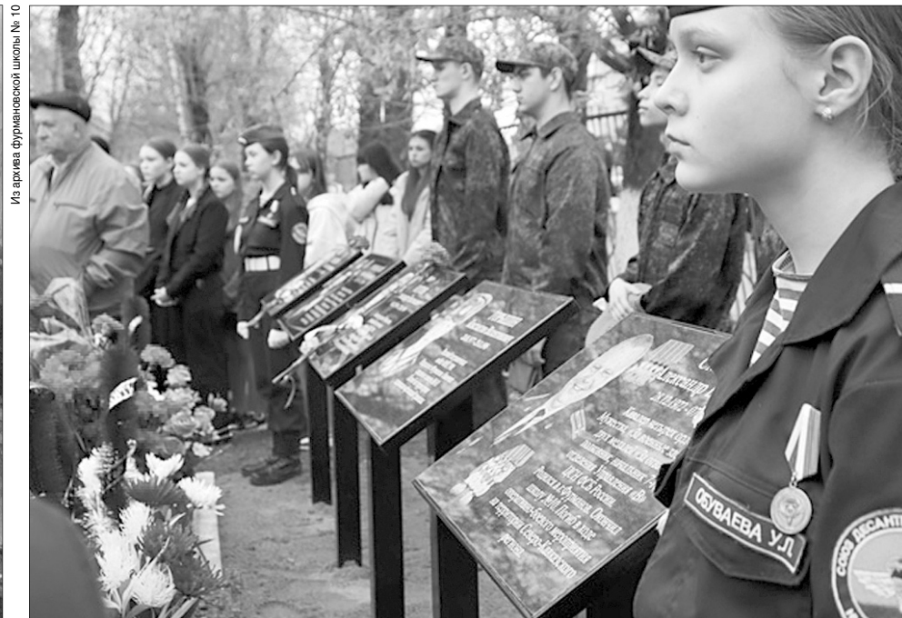
Пять мемориальных плит у фурмановской школы № 10.