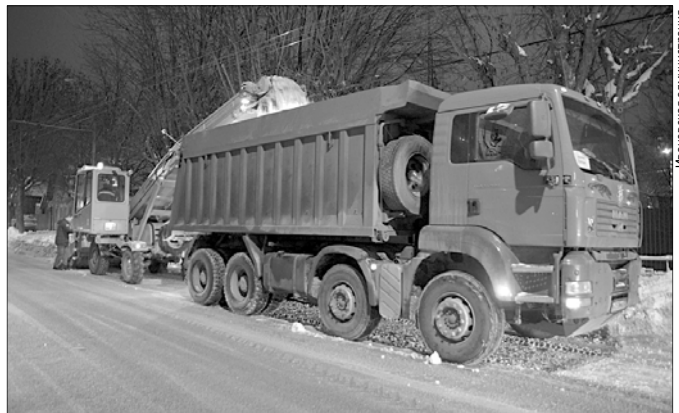
Уборку улиц от снега ивановские власти проверили ночью.