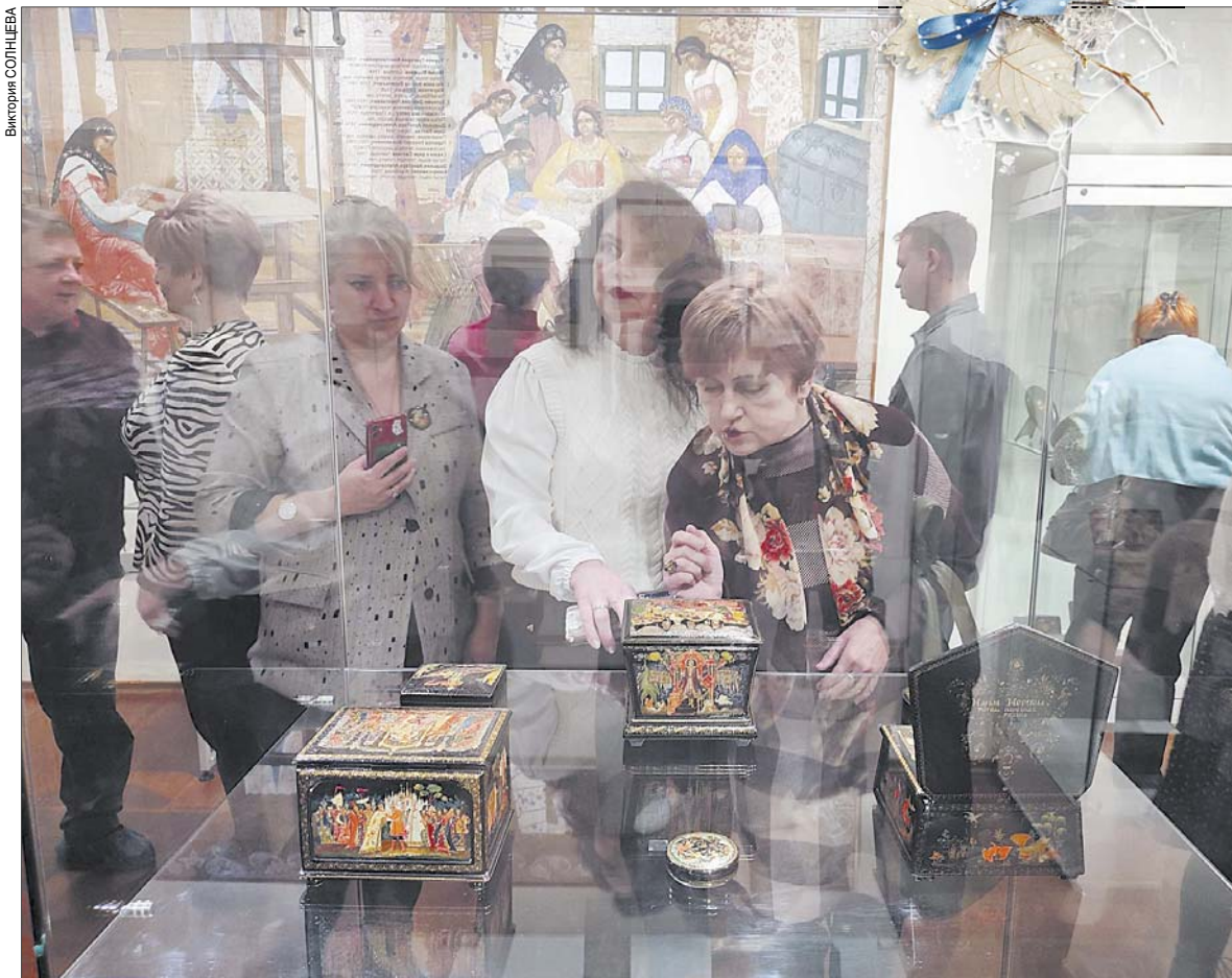
В областном художественном музее хранится одна из лучших в России коллекций палехской лаковой миниатюры.

ские истоки нового Палеха) и большое полотно "Вышивальщицы", одно из первых обращений палешан к светской монументальной живописи.