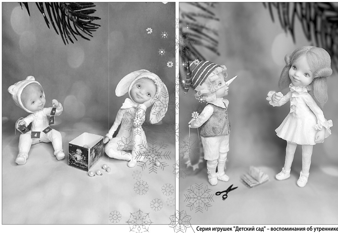
Серия игрушек "Детский сад" — воспоминания об утреннике.