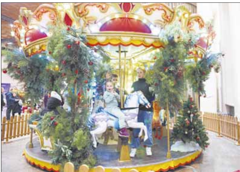
Еще один центр притяжения – нарядная праздничная карусель, на которой можно прокатиться бесплатно.