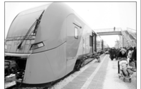
Теперь скоростное сообщение связывает Иваново не только со столицей.

В этом году Ивановская область открыла ежедневное железнодорожное сообщение с двумя регионами. С июня "Ласточки" начали ходить в Нижний Новгород. Составы доезжают за 3 часа 10 минут с остановками в Шуе и Коврове — это чуть ли не вдвое быстрее, чем традиционный поезд.