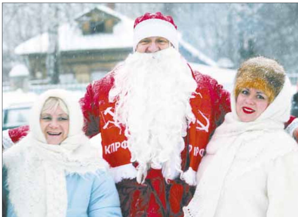
Дед Мороз на фестивале получился политически ангажированным.