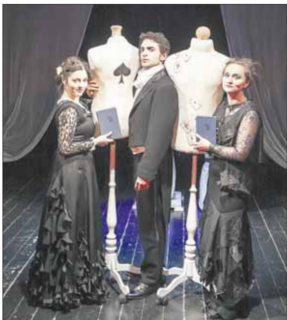
"Пиковую даму" поставили на малой сцене.