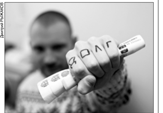
Жесткое общение коллектора с должником кануло в Лету.

И при телефонных звонках, и в текстовых сообщениях коллектор обязан представиться и назвать агентство. Ему нельзя скрывать свой номер телефона и адрес электронной почты; оказывать психологическое давление; давать неверную информацию.