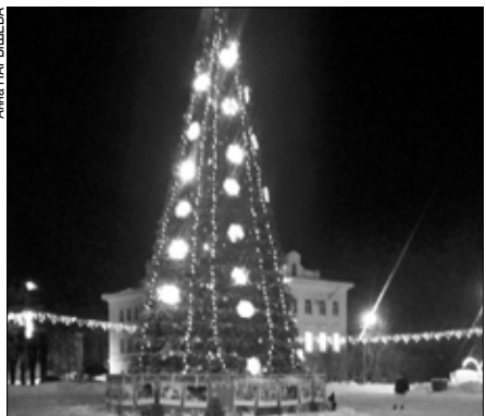
Елку в Родниках в этом году украсили новыми гирляндами и шарами.

Издание напоминает, что в этом году елку на главной площади города украсили новыми гирляндами и большим количеством шаров. По периметру площади обновили светящуюся бахрому. А в Аллее героев установили светящиеся консоли.