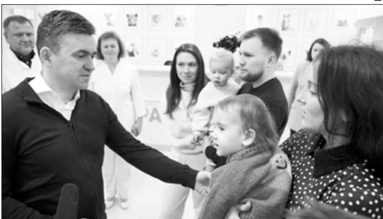
В консультативно-диагностическом центре теперь могут оказать практически любую медпомощь.

пациентов, которое обновили по проекту "Решаем вместе". В здании поликлиники, которое построено в 1928 году — ему почти сто лет, старые деревянные перекрытия заменили на бетонные, переложили коммуникации, установили лифт.