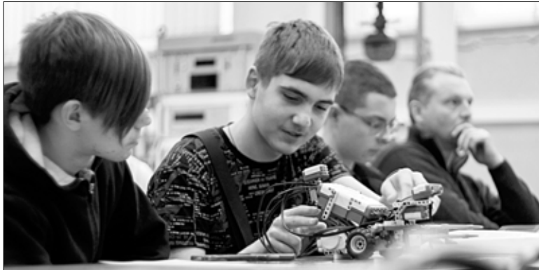
Слушатели программы "Школа инженерного лидерства".

В следующем году ИГЭУ продолжит движение по намеченному пути, расширяя свои возможности. Создание современных технологических лабораторий, центров, приобретение предпринимательских навыков позволят выпускникам эффективно отвечать на вызовы времени, оперативно включаться в работу отрасли.