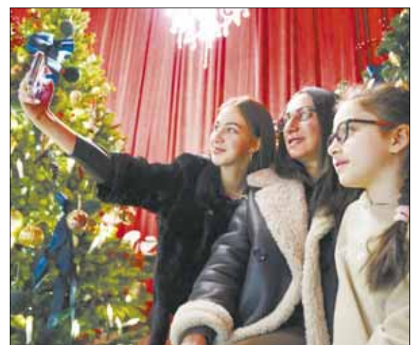
На фоне елки посетители делают красивое семейное фото.