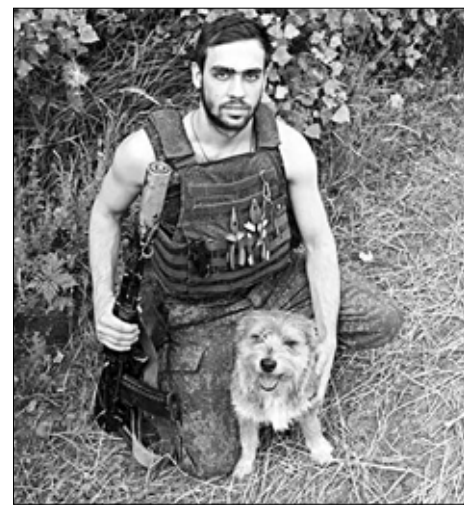
Пулю житель Васильевского привез из зоны СВО.

Под таким заголовком "Шуйские известия" публикуют трогательную историю о дружбе собаки и жителя Васильевского на СВО.