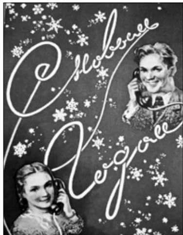
Атмосферу праздника прошлых лет передают старые открытки.