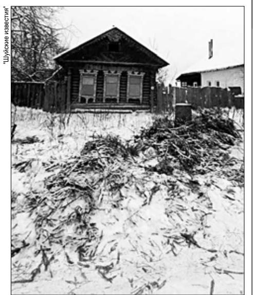
Дерево у частного дома спилили в отсутствие хозяев.