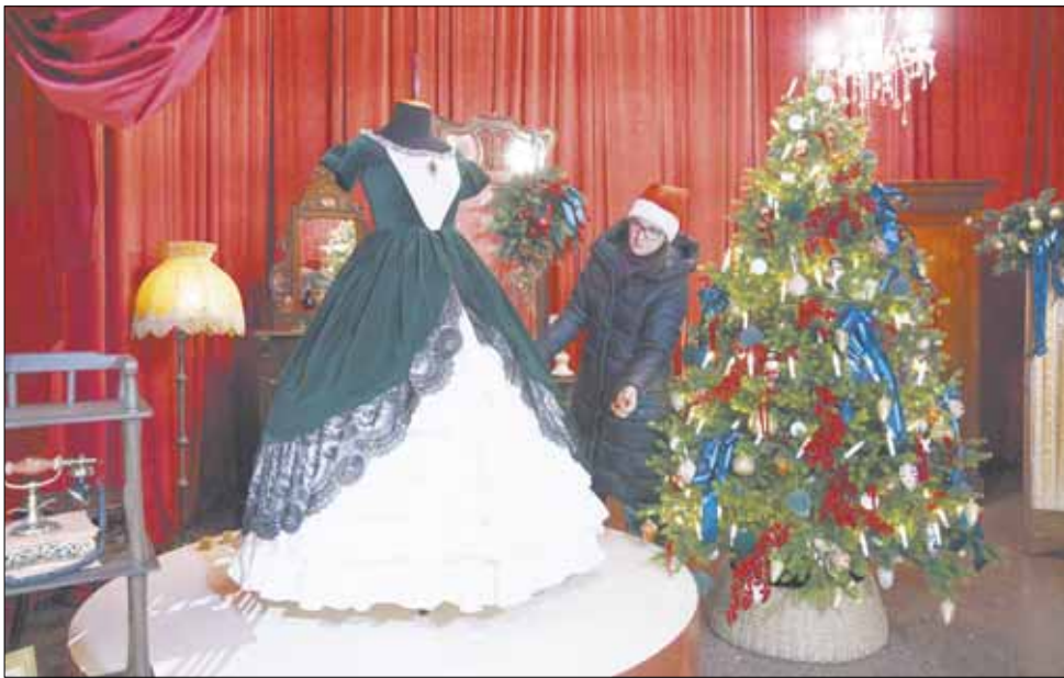
В экспозиции "Будуар" представлена модель бального платья 1857 года. Оно сшито с соблюдением кроя и технологии того времени.