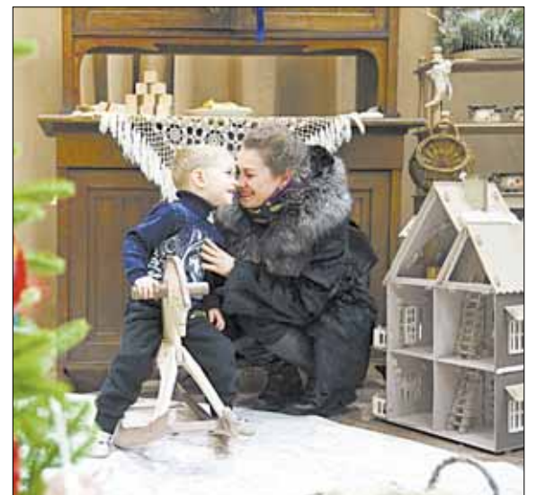
На выставке интересно как взрослым, так и детям.