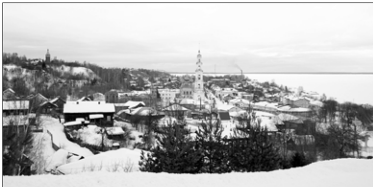
Юбилей Юрьевца отпразднуют на федеральном уровне.

Владимир Путин подписал указ о праздновании 800-летия Юрьевца в 2025 году на федеральном уровне. Организацию мероприятий курирует комиссия, которую возглавляет вице-премьер Татьяна Голикова. В ближайшие полтора года Юрьевец будут готовить к празднику: ремонтировать инфраструктуру, составят культурную программу. Станислав Воскресенский упомянул Юрьевец в статье "Малые города: размышляя о будущем", которую опубликовал в январе в "Российской газете". Владимир Путин высоко оценил материал, а федеральные эксперты и губернаторы других областей начали публично обсуждать важность развития малых городов.