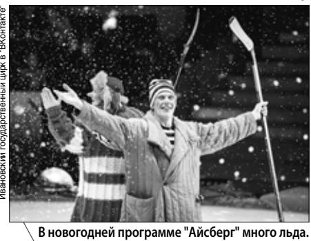
В новогодней программе "Айсберг" много льда.

ЦИРК НА ЛЬДУ "АЙСБЕРГ" (0+) В программе принимают участие мастера манежа и фигурного катания: единственный в мире аттракцион дрессированных белых медведей, дрессированные бело-снежные собаки-самоеды, велофигуристы на моноциклах, экстремальное "Колесо смелости", эквилибристы на катушках, выступления акробатов со скакалками, группы жонглеров, веселых клоунов-хоккеистов в сопровождении световых и лазерных спецэффектов. 29 декабря в 19:00 30 декабря в 12:00 и 17:00 31 декабря в 12:00 Цирк (Ленина, 42) тел. 41-60-13