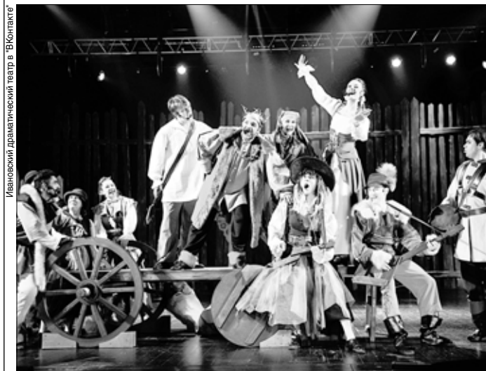
Ивановский драматический театр в "ВКонтакте"