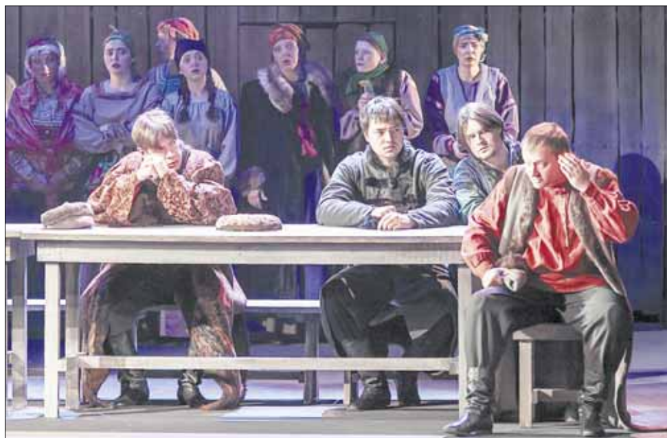
"Козьма Захарыч Минин, Сухорук" — переработанная историческая хроника Островского.