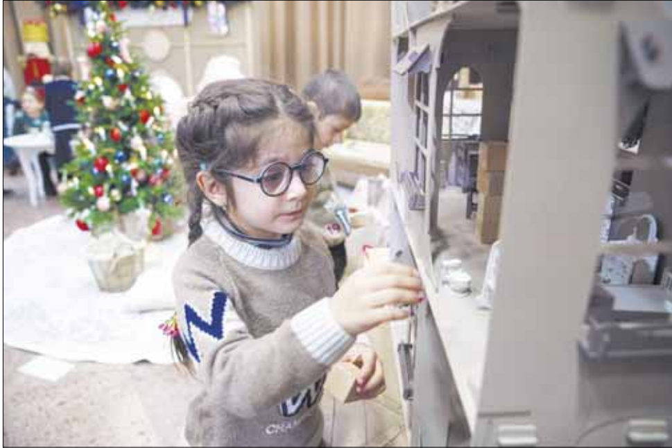
Все экспозиции интерактивные. В "Детской комнате" можно поиграть в кукольном домике...