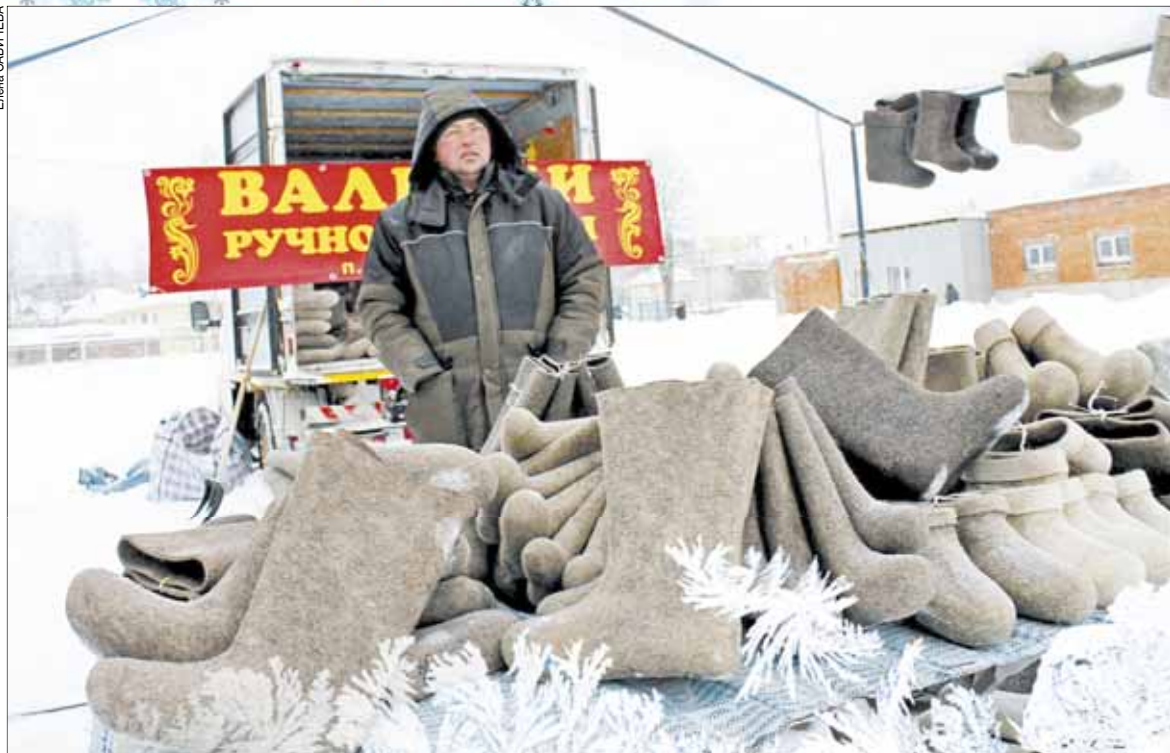
Валенки в Наволоки привезли со многих регионов.