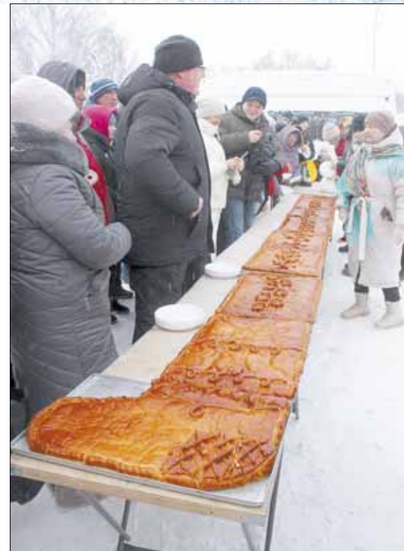
Еще минута и многометровый капустный пирог гости разберут на кусочки.