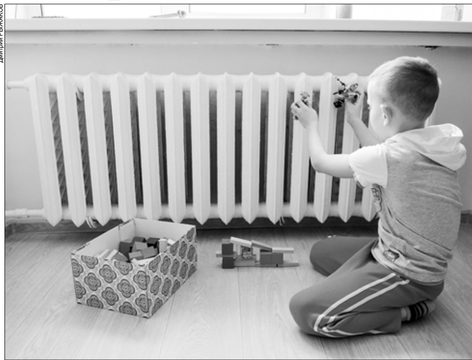
В населенных пунктах, где тарифы высокие, их по-прежнему "заморозят".

ниях в Вичугском, Тейковском, Родниковском районах.