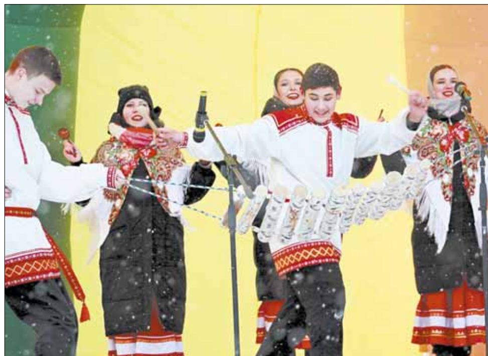
Артисты "Веснушек" играли на дровах.