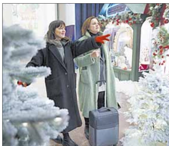
Среди экспонатов хорошо скоротать время в ожидании поезда.

При обнаружении запаха газа необходимо перекрыть краны перед газовыми приборами, открыть окна, покинуть загазованное помещение, при этом запрещено пользоваться электроприборами, включать и выключать свет, оповестить соседей стуком в дверь, и незамедлительно позвонить в аварийно-диспетчерскую службу по тел. 04 (с мобильных телефонов 104).