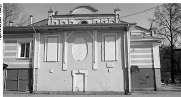
Здание старого театра в Кинешме скоро отреставрируют.

Согласно Уголовному кодексу полная невыплата зарплаты более двух месяцев может наказываться штрафом до 500 тысяч рублей, или принудительными работами до трех лет, или лишением свободы до трех лет с лишением права заниматься определенной деятельностью. Следствие по данному делу продолжается.