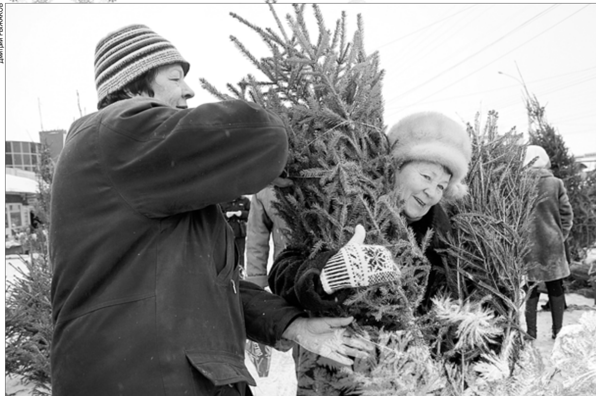
С живыми елочками почти у всех связано много теплых воспоминаний.

Но на финальном этапе, когда ребята подходили к дому, где собирались праздновать Новый год, парень, несший блюдо, поскользнулся и вместе с главным