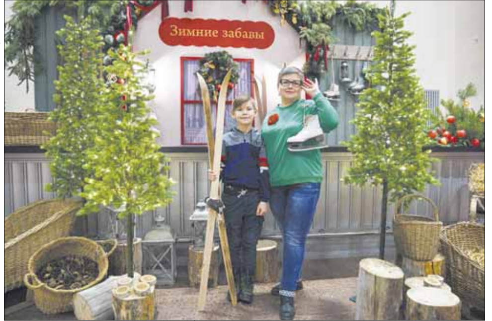
...а в "Уличных гуляньях" примерить роль лыжника или фигуристки.