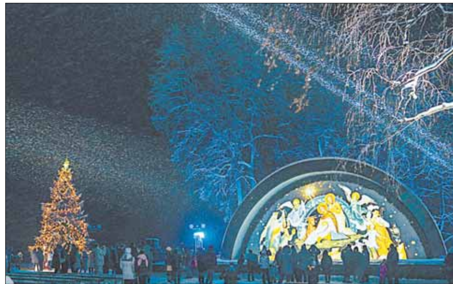
В шуйском парке появится инсталляция, которую создали палехские мультимедиа-художники.