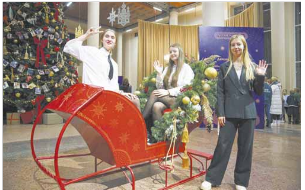
Жалко, что на таких красивых санях не прокатиться.