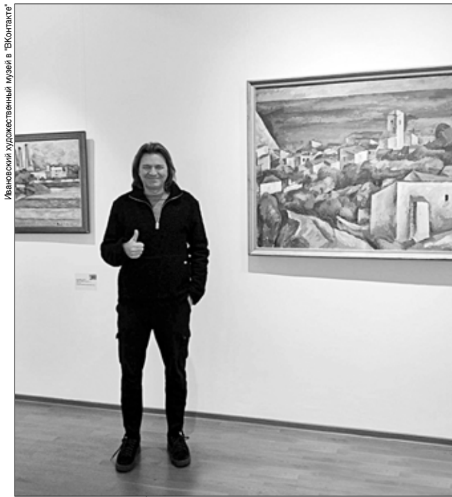
Ивановский художественный музей в "ВКонтакте"

"Большое спасибо! Суперлокация! Супермузей! Мы уже здесь четвертый раз и надеемся, не последний", – написал артист.