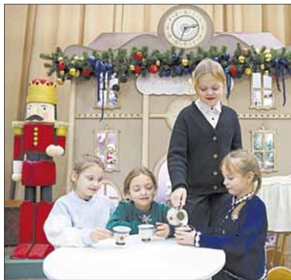
Девочки всегда найдут место, где устроить игрушечное чаепитие и немного посплетничать.