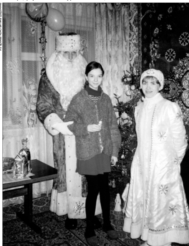
После поздравительной части новогодних гостей часто приглашают к столу.

"И как ты ни сопротивляйся, тебя заставляют есть и, самое ужасное, — пить. А у тебя... борода. Но отказаться не всегда удобно. В общем, тут и наступал волшебный миг, когда на глазах изумленного ребенка Дед Мороз оттягивал бороду вниз и превращался в обычного человека".