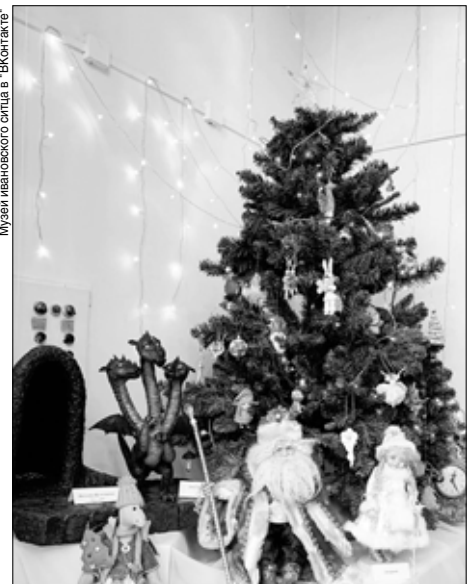
Новогодняя экспозиция "Не привыкайте к чудесам".

"Не привыкайте к чудесам" (0+) Выставка авторских кукол. Свои работы представляют 13 мастеров-кукольников – каждая кукла по-своему уникальна и в каждой присутствует тепло души мастера.