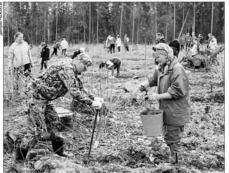
Акции по лесовосстановлению бывают очень массовыми.