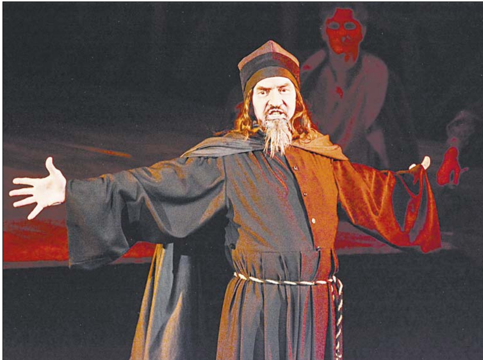
Заслуженный артист России Александр Серков в роли Филарета.