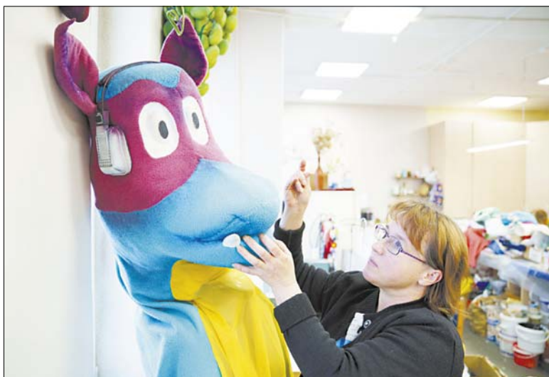
Художники-бутафоры занимаются будущим реквизитом.