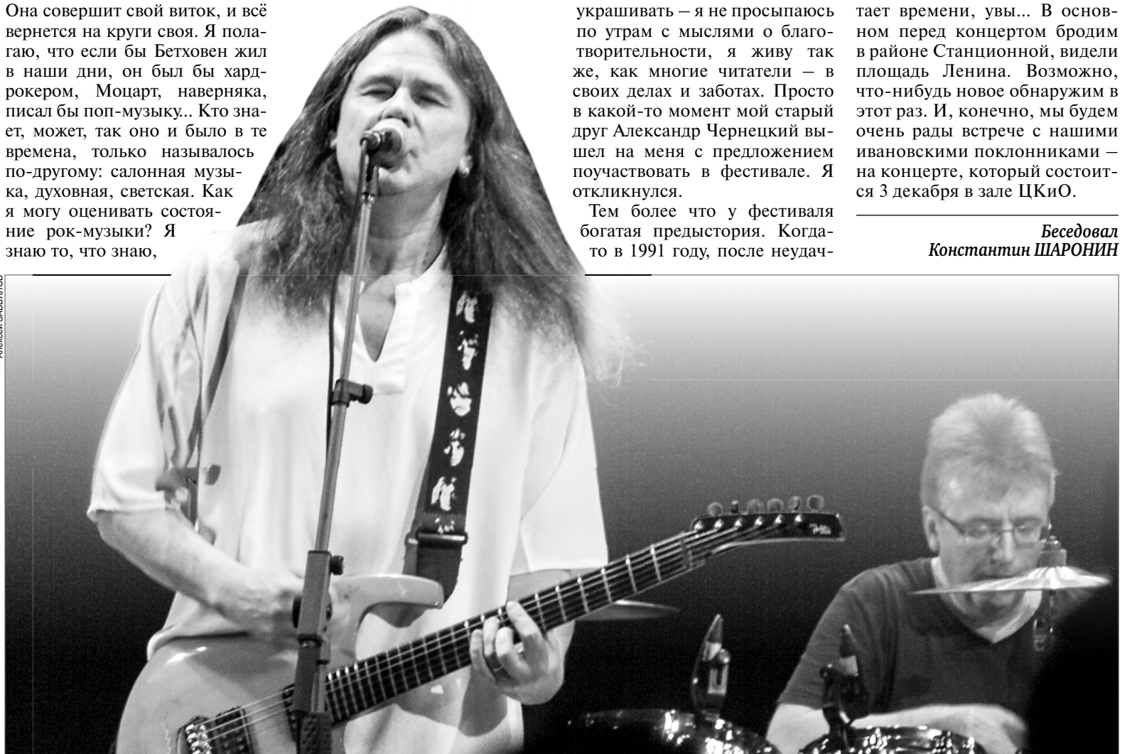
Предыдущее выступление "Чиж & Со" в Иванове.