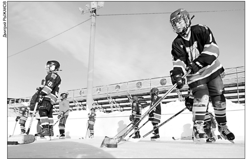
Долгое время ивановские спортсмены выступали только на открытых площадках.

Первая бесплатная площадка для юных хоккеистов в новой истории открылась в нынешнем январе – в спорткомплексе "Газпром Арена Иваново".