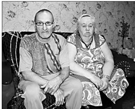
Попцовы остались без жилья.