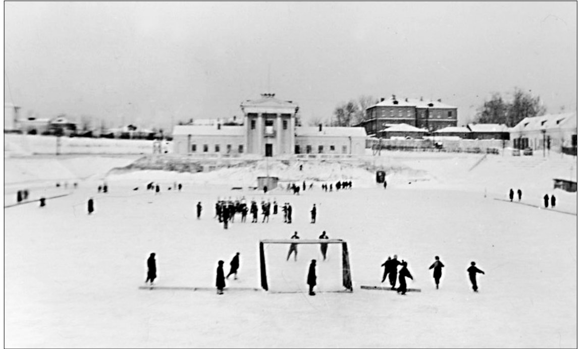
На "Текстильщике" хоккейное "Динамо" тренировалось с 1950-х годов.

В 1951 году за ивановский футбольный клуб "Красное знамя" (предшественник "Текстильщика") выступал Николай Семёнович Эпштейн (1919–2005) – советский футболист и хоккеист, мастер спорта СССР по хоккею с шайбой, заслуженный тренер СССР (1965). Старший (в советское время так называли главного тренера) тренер хоккейного клуба "Химик" (Воскресенск) в 1953–1975 годы, юниорской сборной СССР в 1969–1972 годы и сборной Израиля по хоккею в 1995–1997 годы.