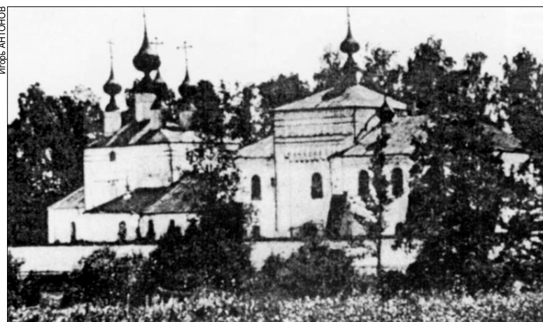
Святитель служил в Золотниковской Пустыни.