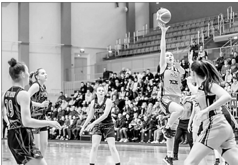
Во Дворце игровых видов спорта играют профессиональные команды региона.

Три года назад в Иванове открылся Дворец игровых видов спорта на Шереметевском проспекте. Это самый крупный спортивный объект в регионе. Сейчас там тренируются спортсмены баскетбольного клуба "Энергия", волейболисты из "Шуяночки" и "Текстильщика". Дворец стал площадкой для всероссийских соревнований по разным видам спортивных игр.