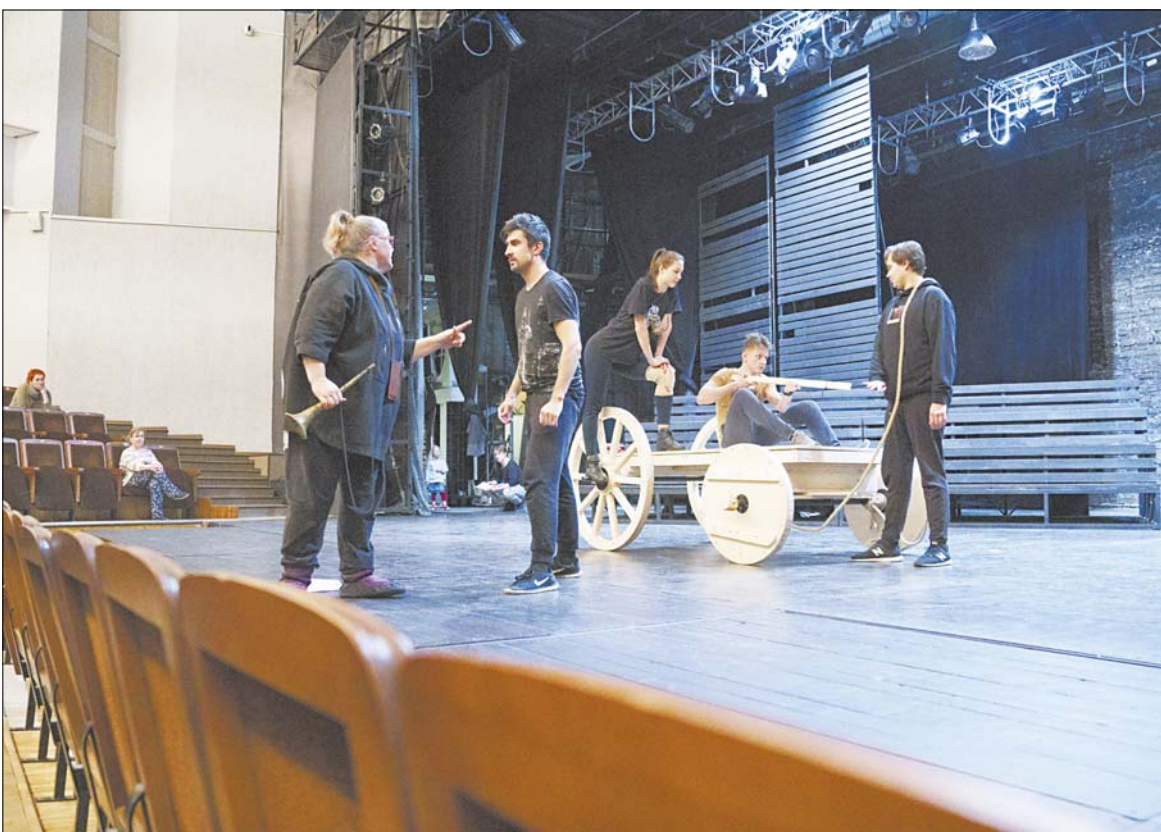
На сцене репетируют "Бременских музыкантов".