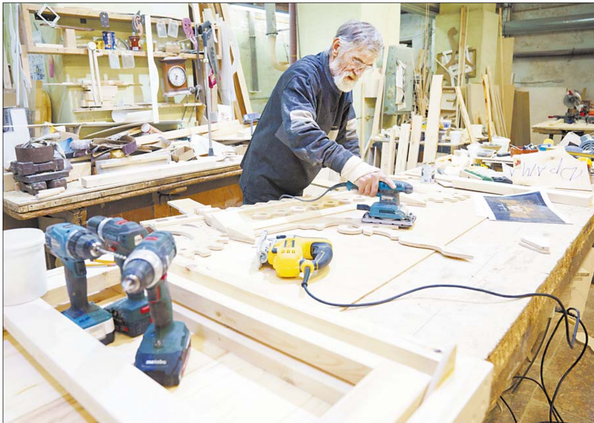
В столярной мастерской идет работа над декорациями для нового спектакля.