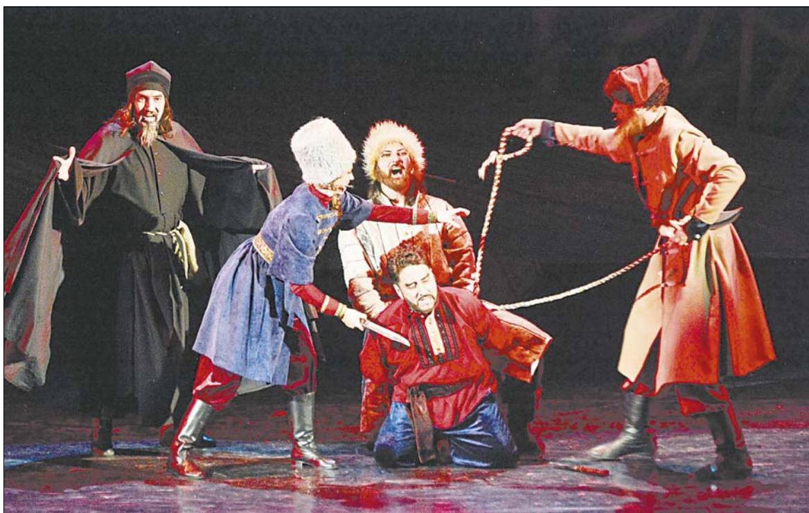
Сцена ареста Емельяна Пугачёва.

Фоторепортаж о том, как готовятся спектакли в Ивановском драмтеатре – на стр. 31.