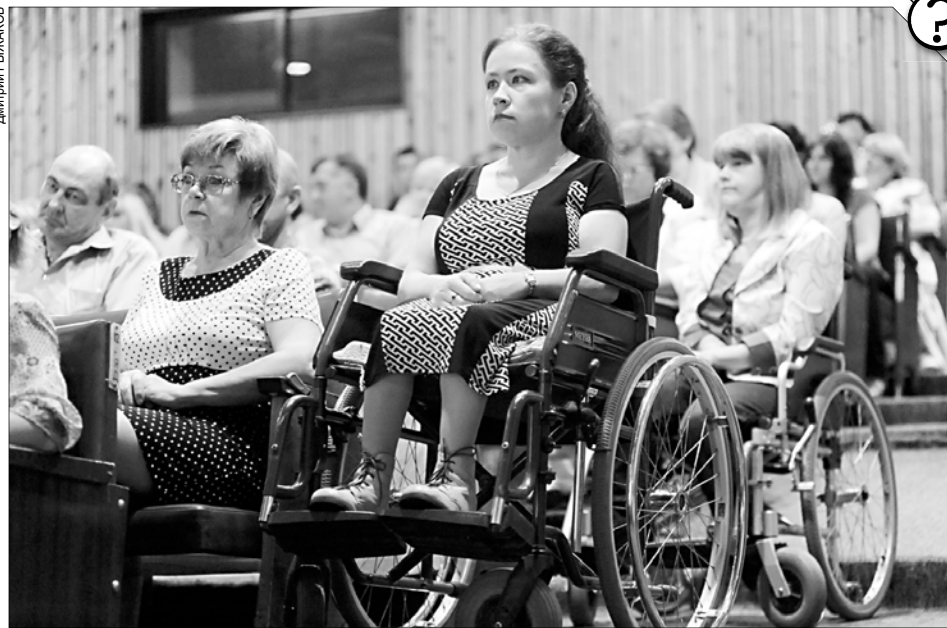
Инвалиды могут приобрести средство реабилитации самостоятельно, компенсировав потраченные деньги.

В регионе для этой цели гражданам следует обратиться в отделение Фонда пенсионного и социального страхова-