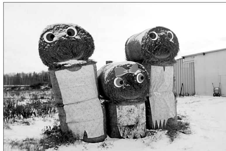
Три необычные ростовые куклы возле нового коровника.

...У нового молочного комплекса "Зари" кипы прессованного сена выложены в виде куклы с глазами и бровями. Действительно, весело, необычно. Без оптимизма селянам в их тяжелой работе никак нельзя.