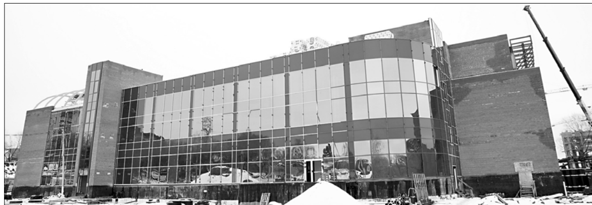
Во Дворце водных видов спорта разместится бассейн олимпийского формата – подобного крытого объекта в регионе никогда не было.

По поручению губернатора отремонтированы две дороги, ведущие к зданию спорткомплекса в Видном: со стороны улиц Куконковых и Павла Большевикова. В проекте новой схемы движения общественного транспорта Иванова появился маршрут из Шилыкова Ивановского района через Ново-Талицы в микрорайон "Видный" (маршрут № А111).