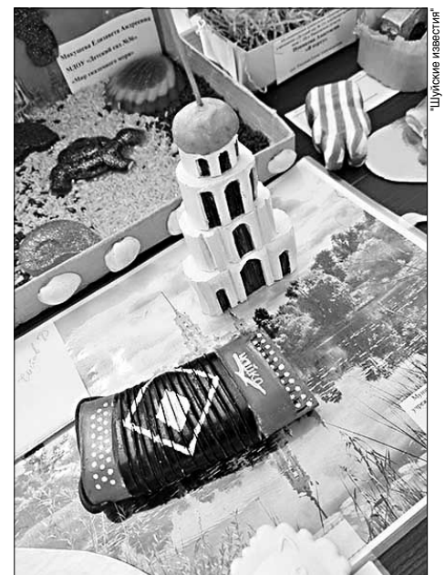
Конкурс резьбы по мылу в Шуе проводится в девятый раз.

Ежегодные состязания проводятся уже в девятый раз. Как рассказывают на страницах "Шуйских известий"