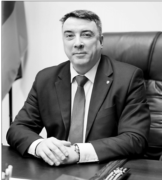
"В 2023 году выявлен 61 случай незаконных рубок лесных насаждений".

Леса Пестяковского, Лухского, Родниковского, Вичугского, Палехского, Южского, Савинского, Шуйского, Лежневского, Ильинского, Комсомольского, Кинешемского, Юрьевоцкого, Лежневского районов полностью переданы в аренду для заготовки древесины различным компаниям. Комитет совместно с лесничествами проводит работу с ними по обеспечению населения дровами. Лесопользователи рассматривают возможность выделения участков для заготовки древесины населением.