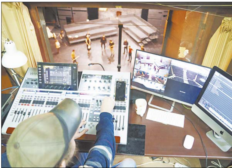
Рабочая комната звукооператора находится выше сцены. Весь зал оборудован камерами наблюдения, которые помогают специалисту видеть происходящее с разных сторон.

Для Ивановского драматического театра нынешний сезон – юбилейный, 90-й. Коллектив для зрителей готовит разнообразные постановки: драму, комедию, спектакли для детей, для малой сцены. Над ними трудятся не только актеры, но и работники декоративно-бутафорского, пошивочного, реквизиторского, столярного, звукотехнического цехов, гримеры-пастижеры, костюмеры... За процессом понаблюдал фотокорреспондент "ИГ" Дмитрий РЫЖАКОВ