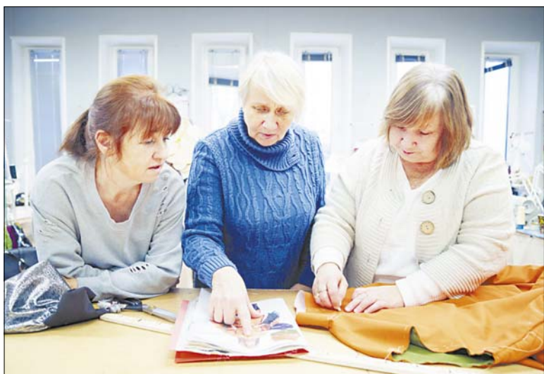
В каждый театральный сезон выпускается по шесть премьер. Все костюмы для артистов изготавливают в пошивочном цеху.