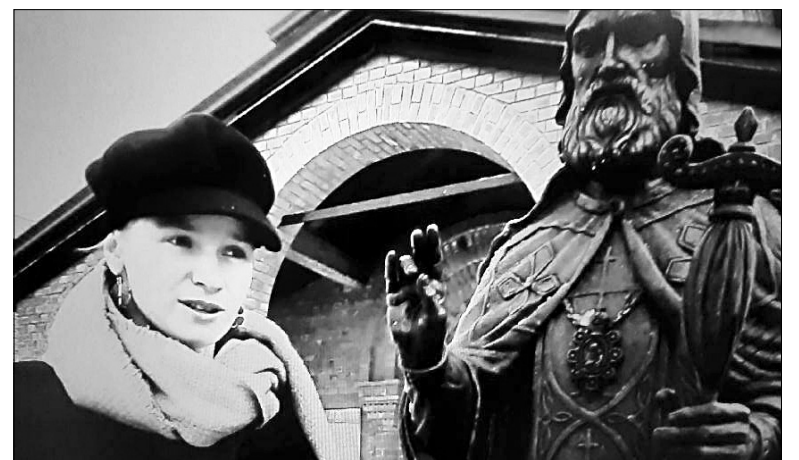
Автор памятника Митрофану Воронежскому на фоне храма его же имени в селе Никола-Мере.