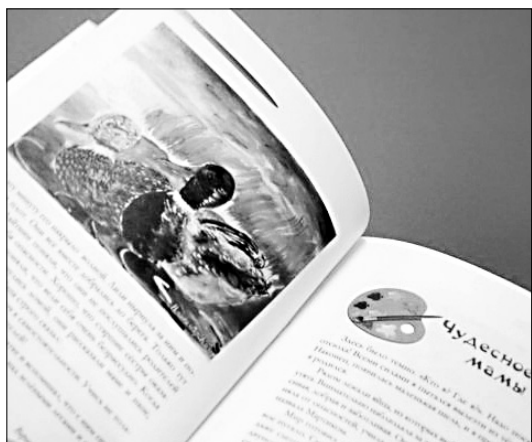
Красочные "Крылатые сказки" из Ивановской области попадут в разные библиотеки страны.

Книга "Крылатые сказки" попадет на полки читальных залов не только нашего региона. Сборник окажется и в ведущих библиотечных центрах страны.