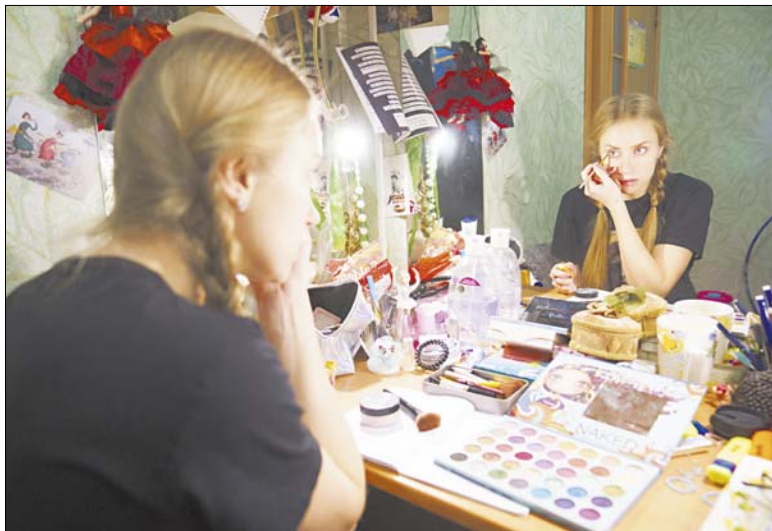
В зависимости от сложности на грим уходит от десяти минут до часа.