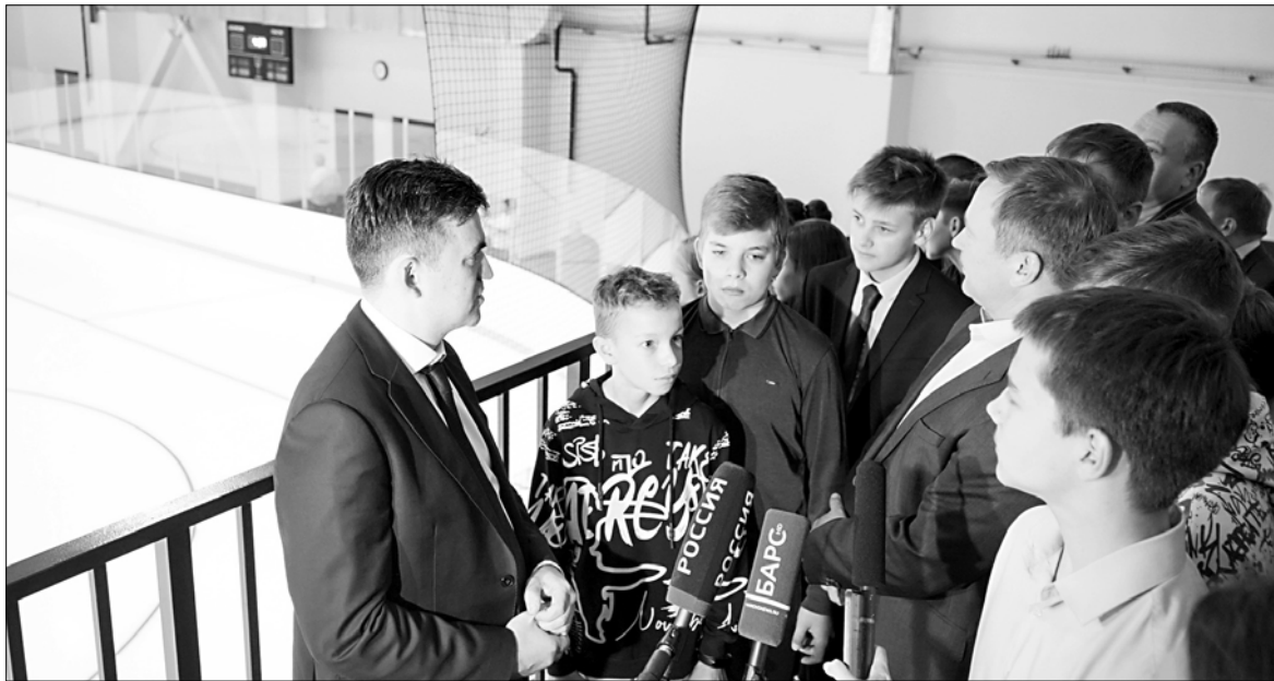
О строительстве спорткомплекса в Видном губернатор договаривался с руководством "Газпрома".