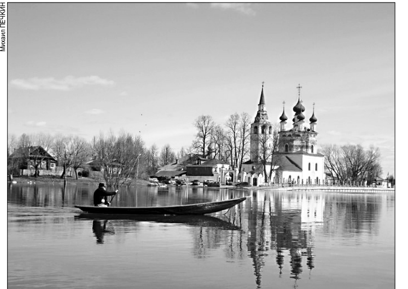
Самые выигрышные фотографии в Холуе — весной.