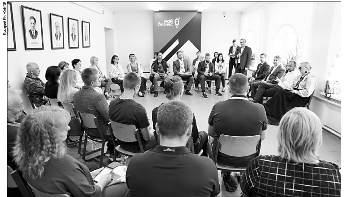
Центр "Мой бизнес" помогает предпринимателям и ученым наладить взаимодействие со "Сколково".