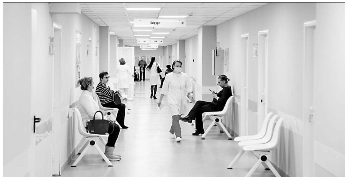
Кохомская поликлиника изменилась до неузнаваемости.

11-я ивановская поликлиника обслуживает 25 000 человек. Прием ведут 22 врача и 20 медсестер.