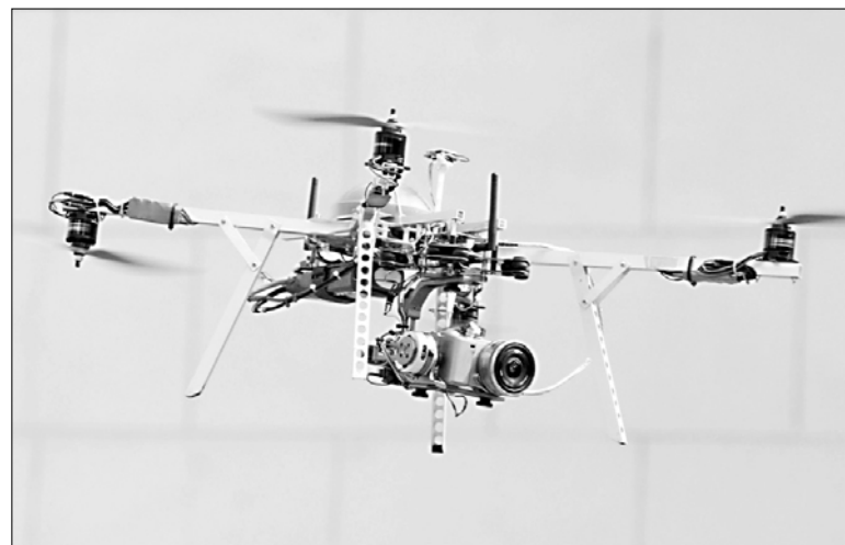
Инновационный центр поддержал проект по разработке беспилотных летательных аппаратов.