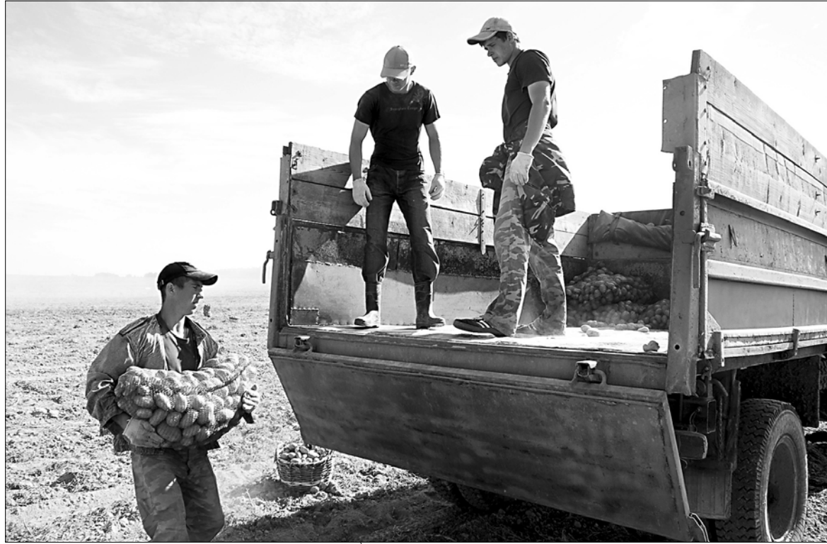
Тон в выращивании картофеля в регионе уже не первый год задают фермеры.

Всего на сельхозпредприятиях и в фермерских хозяйствах Ивановской области собрано 23,4 тыс. тонн картофеля, что на 19,4% больше, чем в прошлом году. Больше всего накопано в хозяйствах Тейковского — 11,2 тыс. тонн, Шуйского — 2,9 тыс. и Родниковского районов — 2,2 тыс.