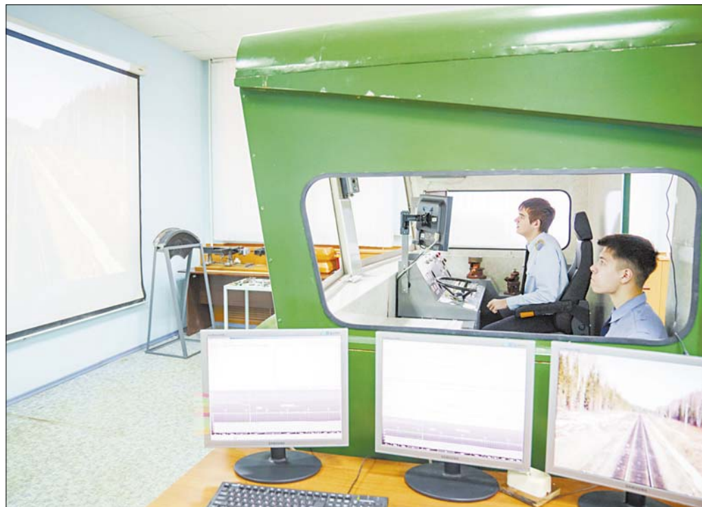
Тренажер тепловоза позволяет будущим машинистам испытать силы на реальном направлении – Иваново – Ярославль.

В этом году в колледже открыли новую специальность – сервис на транспорте. Теперь в Иванове готовят проводников, кассиров, работников вокзального хозяйства. Партнер учебного заведения – Северная железная дорога – пообещал передать для студентов купейный вагон, чтобы они лучше осваивали навыки профессии.