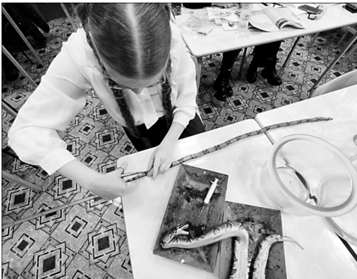
Студенты готовят змей к сохранению в фиксирующей жидкости.

В целом коллекция кафедры постоянно пополняется и обновляется и насчитывает несколько сотен видов животных.