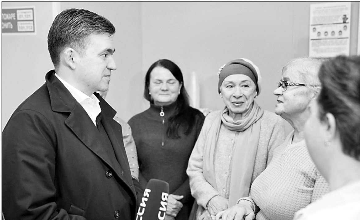
Глава региона пообщался с пациентами и врачами.

8 ноября губернатор Станислав Воскресенский побывал в одной из поликлиник, которая обрела