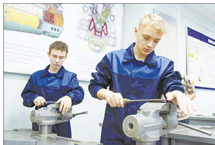
Первокурсники много времени проводят в слесарной мастерской.