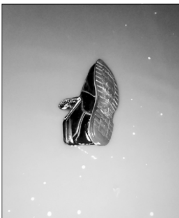
Ботинок затонул в центре лужи.

Через несколько дней, когда дожди прекратились, один ботинок пропал, а второй раскатили проезжающие машины. Возможно, один ботинок кому-то приглянулся или хозяин спас его на память об этом вечере.