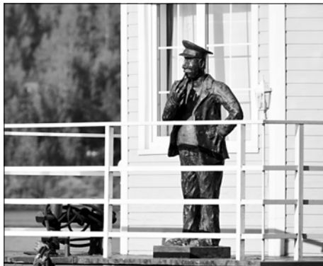
Любимая плѣсанами скульптура боцмана теперь стоит под водой.

Манков. По словам погружавшегося водолаза, сейчас боцман находится на своем месте, но под водой.