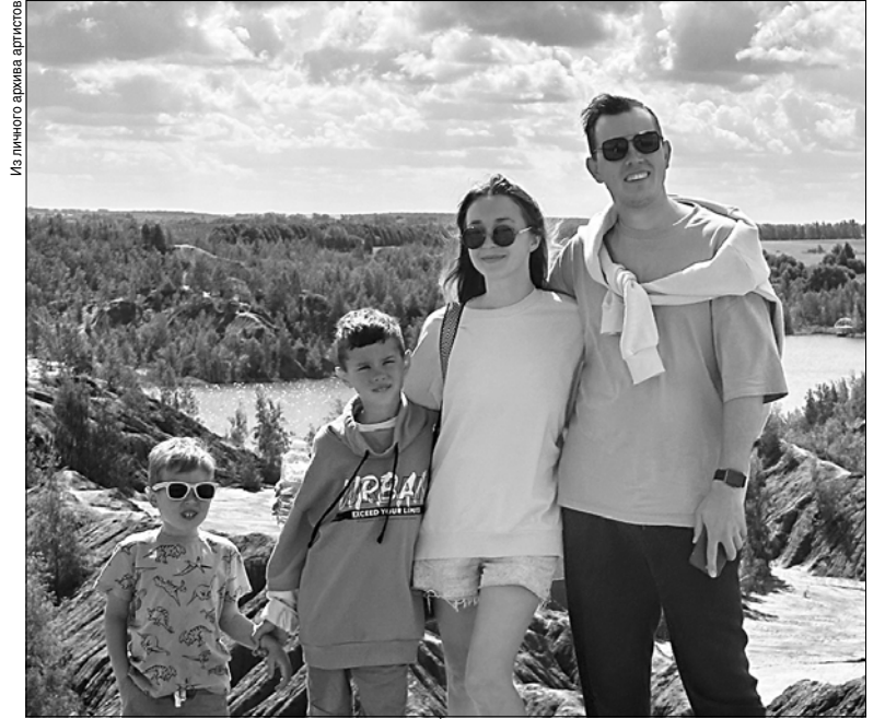
Артисты любят путешествовать всей семьей.