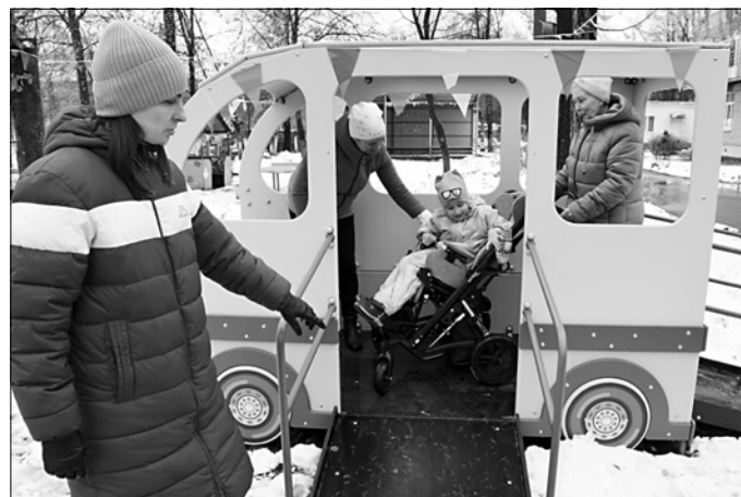
Автобус на площадке у детсада — с пандусами.

детьми в детсаду обустроена сенсорная и дидактическая комнаты, физкультурный зал. Все занятия в помещениях лекотеки проводятся в присутствии родителей.