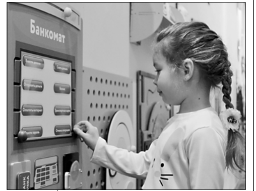
Ребят научили пользоваться банкоматами.