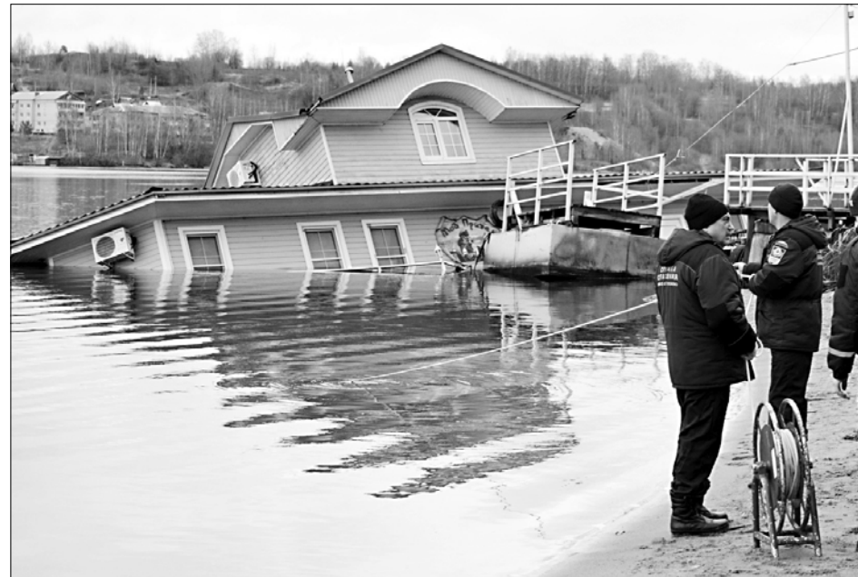
На плѣсской набережной затонул дебаркадер с дачным домиком "Мой причал".