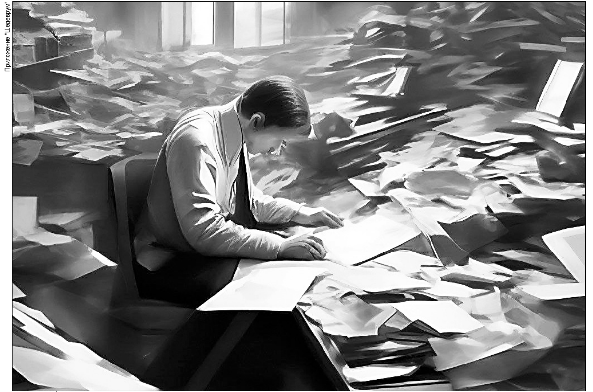
Чтобы "отбиться" от чужих штрафов и долгов, приходится неоднократно обращаться в госорганы, собирать множество справок.

Полные тезки должников могут решить проблему с помощью сервиса "Интернет-приемная" официального сайта ФССП, выбрав тему "Я двойник!". Другой эффективный способ решения вопроса — обращение в официальный чат-бот в "ВКонтакте" (vk.com/fssp_gov). На портале госуслуг есть раздел "Подача заявлений и ходатайств в Федеральную службу судебных приставов". В пункте "Кем вы являетесь в исполнительном производстве?" нужно выбрать вариант "На мне числится чужой долг. Я хочу его оспорить". В качестве доказательства придется загрузить документы, которые позволяют идентифицировать гражданина.