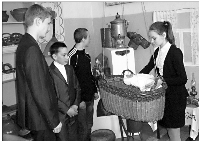
В Рождестве есть музей при школе, будет и музей Суворова в Сараеве.

...Разница по собственным доходам между депрессивными Кромами и теми же высокобюджетными Ново-Талицами огромна. Но люди не виноваты, что живут в небогатых деревнях и селах. И потому не должны оставаться без поддержки.