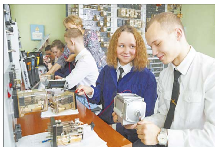
Специалисты по автоматике и телемеханике отвечают за безопасность движения: правильный перевод стрелок, работу светофоров.