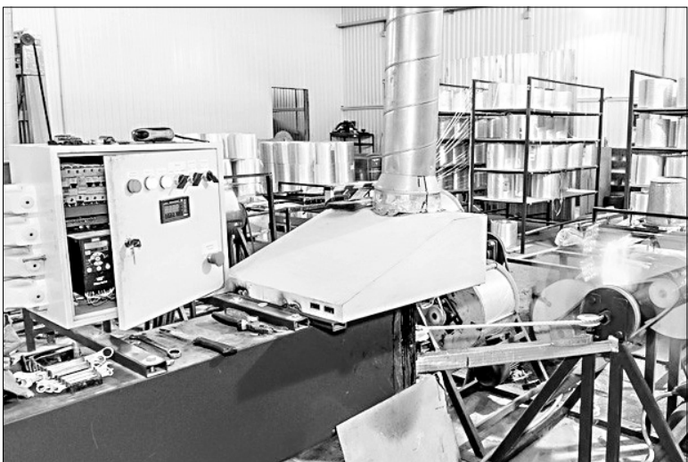
Среди резидентов - Ивановский механический завод.