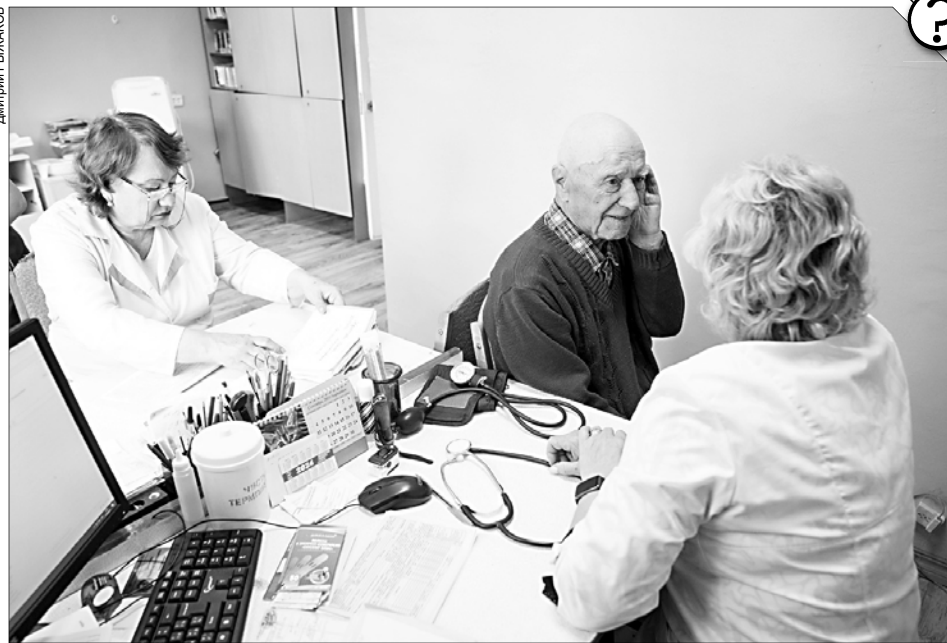
С 1 января некоторые категории медработников получают соцвыплаты – до 18 500 рублей.

Средства перечисляются ежемесячно на основании направленных медучреждениями электронных реестров, в которых содержатся сведения о работнике и