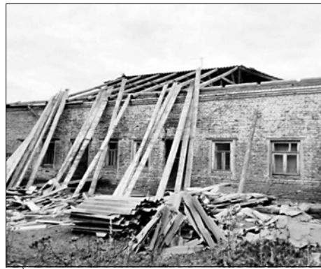
Дом культуры – центр активной жизни в деревне.

Как отмечает издание, Дом культуры играет важную роль в жизни деревни, это главное место отдыха жителей. В