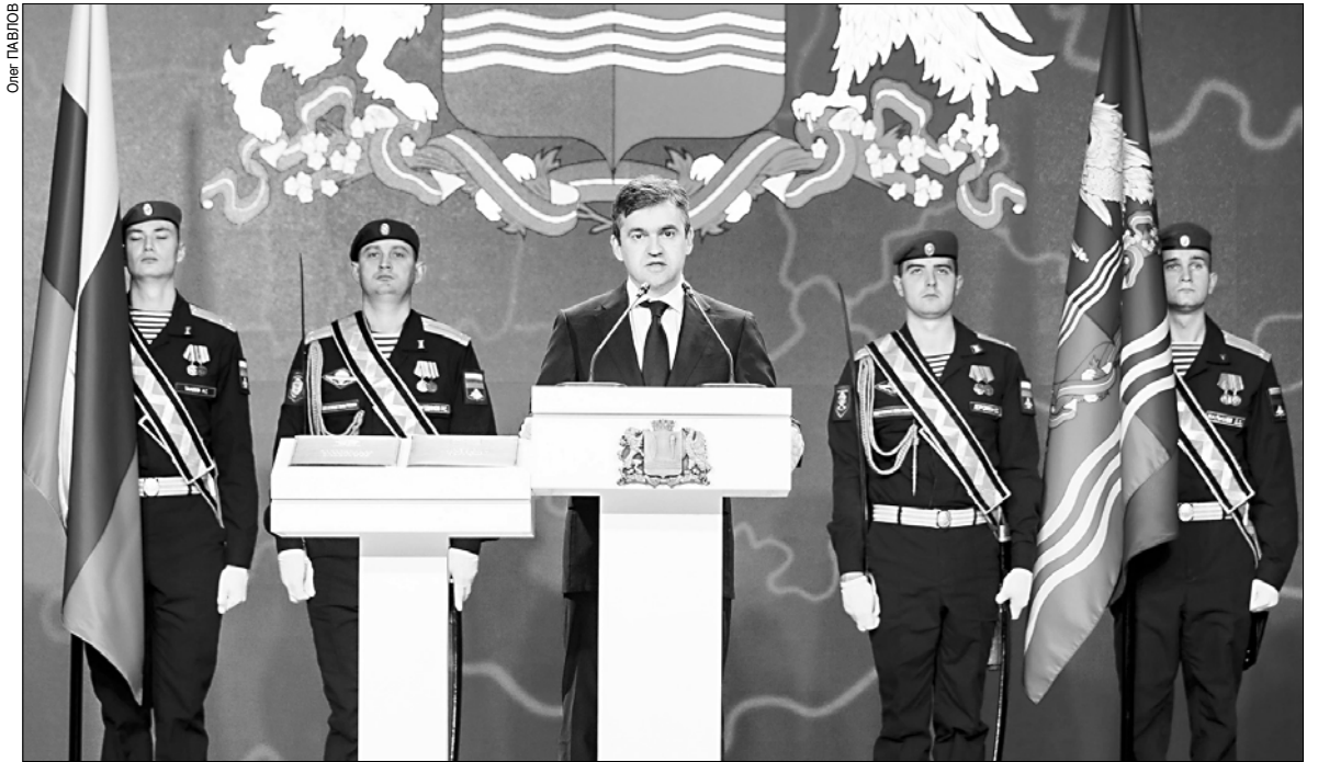
Губернатор поблагодарил жителей Ивановской области за оказанное на выборах доверие.

— Благодаря губернатору удалось сохранить старейшее в городе предприятие и трудовой коллектив. Какой подъем на душе у наших сотрудников был от этой новости! Все очень переживали, когда узнали, что предприятие планируют закрыть. Мы сейчас проходим обучение и с нетерпением ждем начала работы. Жизнь нашей фабрики — это жизнь нашего города.