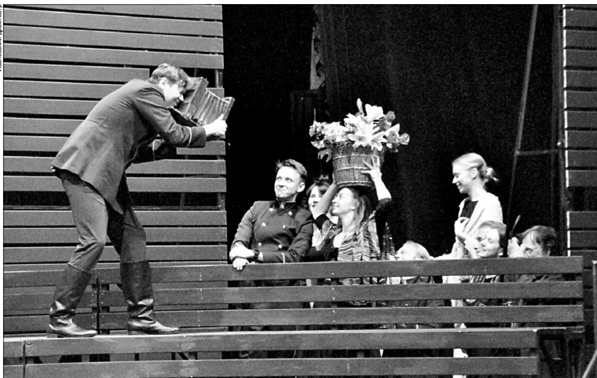
Репетиция премьеры юбилейного сезона — "Трех сестер".