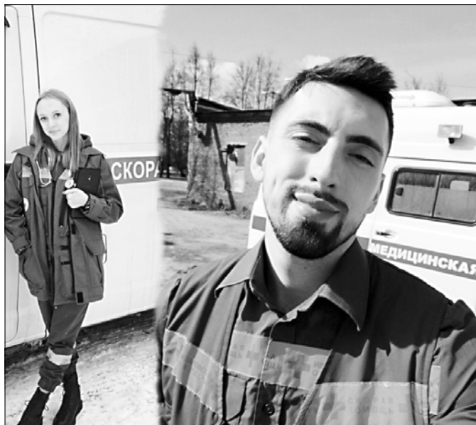
Молодые медики скорой помощи спасли жизнь ребенку.

По словам родительницы, позднее сынишку успешно прооперировали, и теперь он здоров. Женщина благодарит за правильный