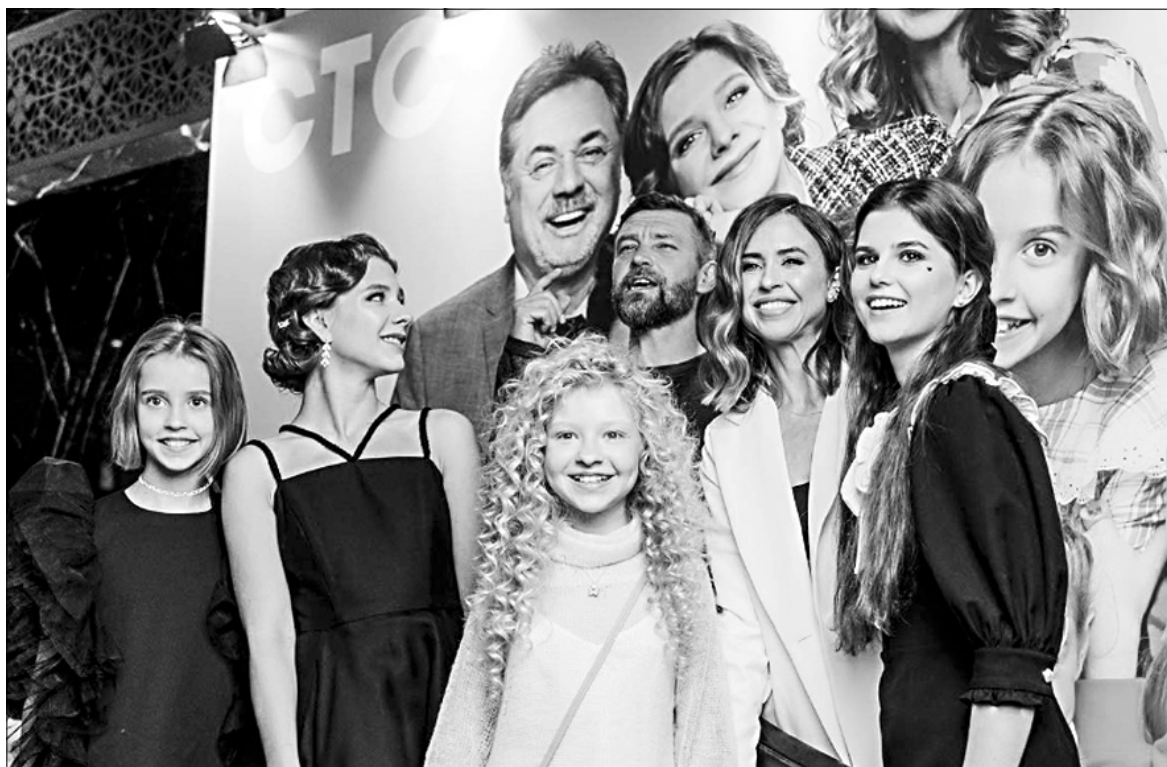
На предпоказе в Москве собрались звезды шоу-бизнеса и актерский состав сериала – прошлый и нынешний.

Премьера сериала "Папины дочки. Новые" на СТС состоялась 18 сентября.