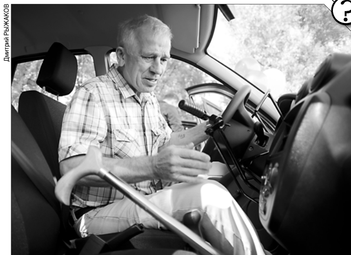
До 1 октября инвалидам надо определиться с набором соцуслуг.

В региональном отделении Соцфонда напоминают, что к категории федеральных льготников относятся: участники и инвалиды Великой Отечественной войны и их вдовы; ветераны боевых действий, их вдовы и дети (несовершеннолетние); бывшие несовершеннолетние узники фашизма; лица, награжденные знаком "Жителю блокадного Ленинграда"; инвалиды; лица, подвергшиеся воздействию радиации вследствие аварий и ядерных испытаний.