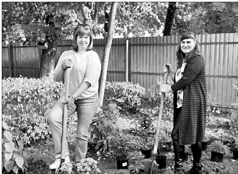
В детсаду будет красиво, а воспитанники еще и получают знания по экологии.

Воспитатели ивановского детского сада № 12 участвуют в проекте «Цветущий город» благотворительного фонда «Ива», который реализуется при поддержке Фонда президентских грантов. Проект направлен на создание зеленой зоны при входе в детский сад.