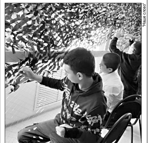
Ребята из Кохмы плетут маскировочные сети для СВО.