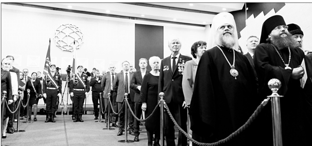
Церемония вступления в должность прошла в "Солярисе".