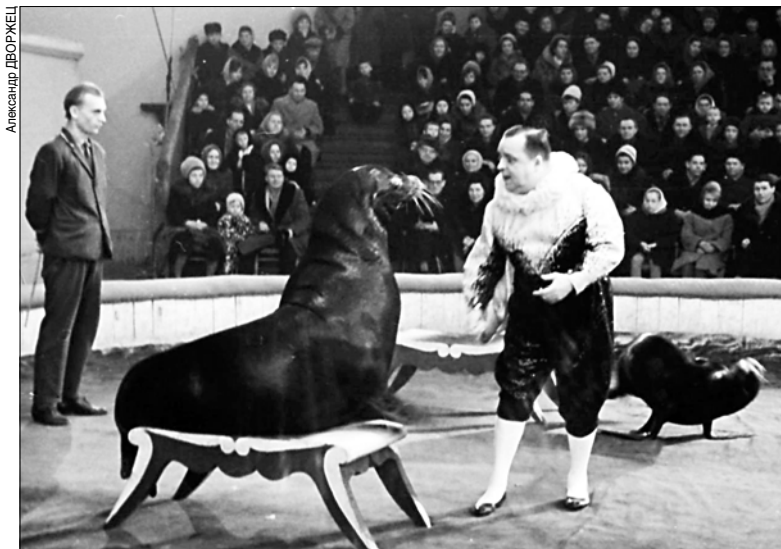
Выступление в Иванове дрессировщика Владимира Дурова в 1964 году.