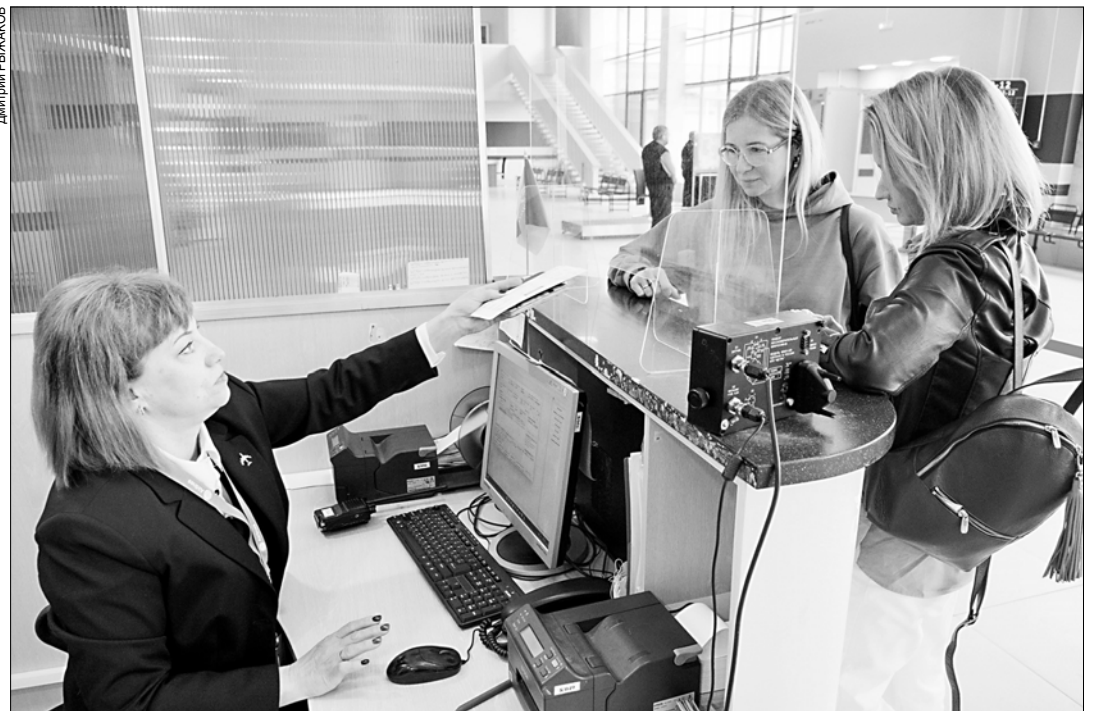
Расписание самолетов до Минеральных Вод также поменялось.

Летний сезон закончился, и аэропорт вновь вернулся к привычному круглогодичному расписанию, сократив дополнительный пятничный рейс. "С 25 сентября самолеты Embraer, вмещающие 110 пассажиров, летают в Сочи два раза в неделю — по средам и воскресеньям", — сообщил аэропорт своим пассажирам.