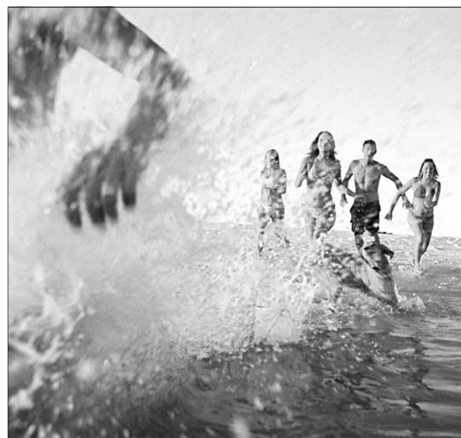
Центр ГИМС ГУ МЧС РФ по Ивановской области

В таких ситуациях очень многое зависит от взрослых. В народе не зря говорят: "Чужих детей не бывает" . Не оставляйте без внимания любой факт пребывания несовершеннолетних у воды, даже если это не ваши дети. Убедить ребенка покинуть опасную территорию либо уточнить, где в данный момент находятся его родители, — дело нескольких минут. Не пожалейте времени, ведь своей добротой вы спасаете человеческую жизнь.