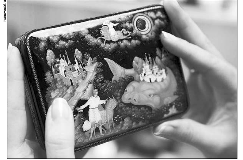
Международная выставка-форум "Россия" пройдет в Москве на территории Выставки достижений народного хозяйства, ее открытие намечено на 4 ноября. Указ об этом подписал президент России Владимир Путин. Оргкомитет возглавил первый заместитель руководителя администрации президента РФ Сергей Кириенко.

ленность, энергетику, АПК, транспорт, строительство, науку и культуру, положительного опыта развития регионов страны, содействия дальнейшему международному сотрудничеству. Участниками международной выставки-форума "Россия" станут субъекты РФ, общественность, предприятия реального сектора и крупные корпорации, представители зарубежных стран. В программе — экспозиция достижений страны, дни регионов, деловые недели, культурно-развлекательная программа, фестивали кулинарных традиций, ярмарка.