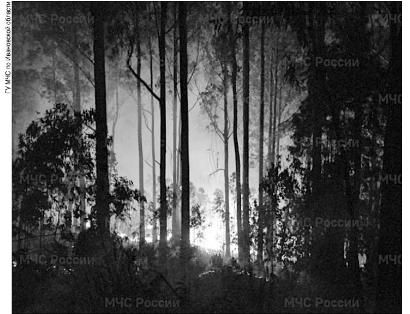
ГУ МЧС по Ивановской области

Пламя небольших низовых пожаров можно сбивать, захлестывая его ветками лиственных пород, заливая водой, забрасывая влажным грунтом, затаптывая ногами. Торфяные пожары тушат перекапыванием горящего торфа с поливкой водой. При тушении пожара действуйте осознанно, не уходите далеко от дорог и просек, не теряйте из виду других участников, поддерживайте с ними зрительную и звуковую связь. При тушении торфяного пожара учитывайте, что в зоне горения могут образовываться глубокие воронки, поэтому передвигаться следует осторожно, предварительно проверив глубину выгоревшего слоя.