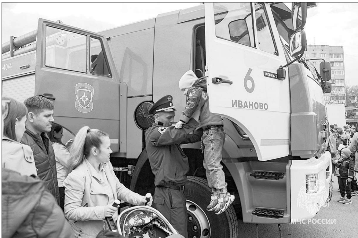
ГУ МЧС России по Ивановской области

матические площадки. В ходе мероприятия дети смогли примерить на себя боевую одежду пожарного и подключиться к дыхательному аппарату, попробовать потушить условное возгорание при помощи огнетушителя, узнать всё про оборудование, которое применяется для спасения человека из воды,