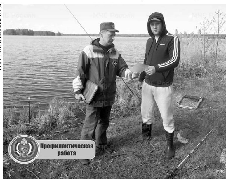
ГУ МЧС России по Ивановской области

Будьте осторожны при ловле рыбы с камней: мокрые да еще и покрытые тиной, они очень скользкие, и при падении можно получить тяжелые травмы.