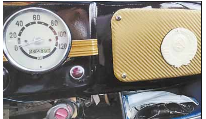
Герб Советского Союза – на видном месте.