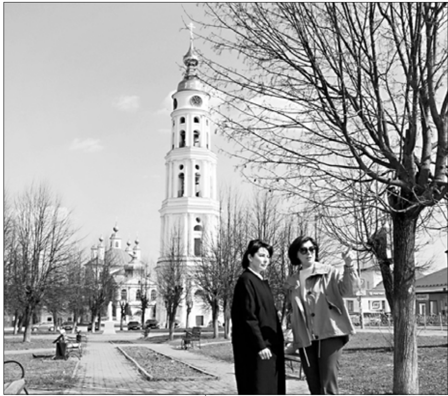
Колокольня в Лежневе начала принимать экскурсантов.

В Лежневе начались экскурсии на колокольню Троицко-Знаменской церкви