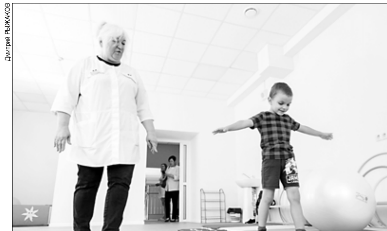
Теперь маленькие пациенты с удовольствием посещают врачей.