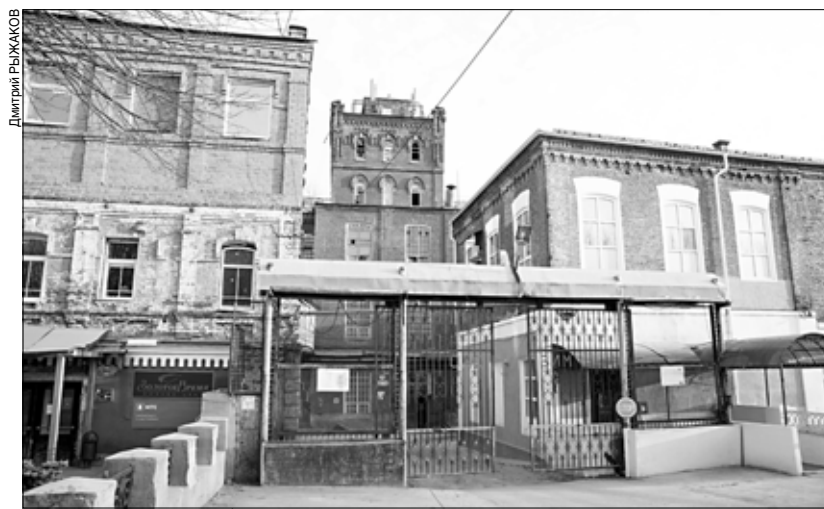
В старые корпуса Большой Ивановской мануфактуры вернется жизнь.

С 2022 года по поручению Станислава Воскресенского в Ивановской области идет капитальный ремонт детских садов. Подрядчики отремонтировали 65 зданий в прошлом году и отремонтируют 83 в этом. Главная цель – устранить базовые проблемы: рабочие меняют кровли, коммуникации и электрику, вставляют новые окна и отделывают фасады. Губернатор намерен привести в порядок все детские сады Ивановской области в 2023 и 2024 годах. Общественная палата продолжает собирать адреса проблемных зданий.