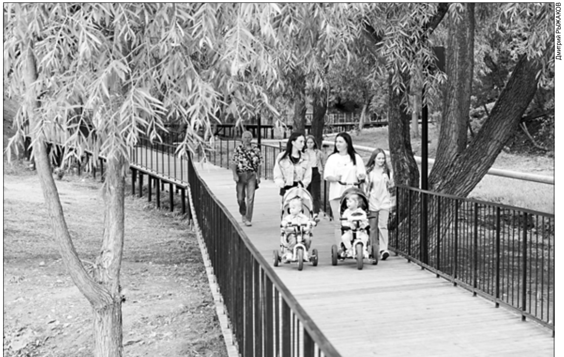
Овраг в центре Фурманова стал оживленной пешеходной зоной.

Центр по исследованию проблематики малых городов работает на базе Шуйского филиала Ивановского государственного университета. Эксперты центра занимаются вопросами создания инфраструктуры, сохранения культурного наследия и формирования комфортной городской среды.