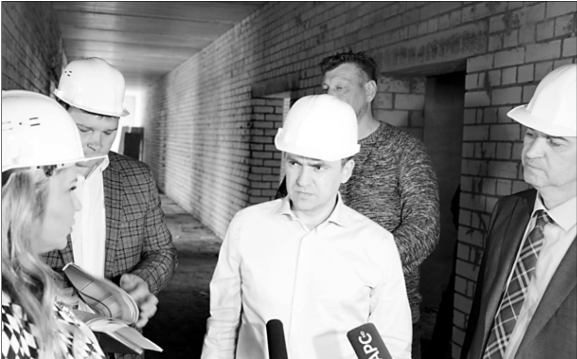
Станислав Воскресенский: "Я сейчас инспектирую все стройки, регулярно держу на контроле..."