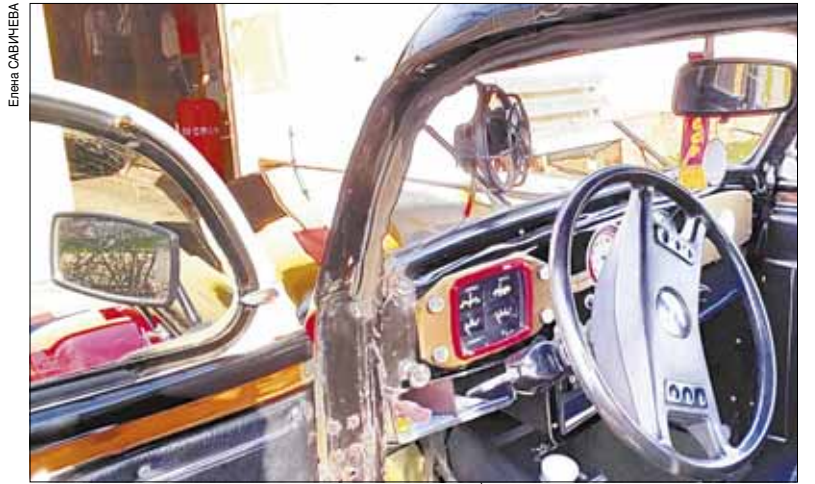
Салон кожаный, ручки деревянные.