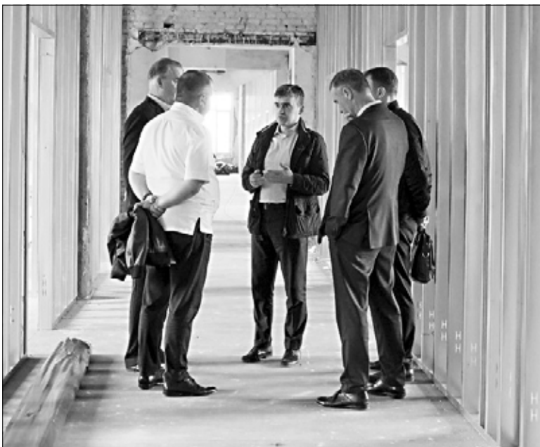
Губернатор лично контролирует ход ремонтных работ в Ивановском детском клинко-диагностическом центре.