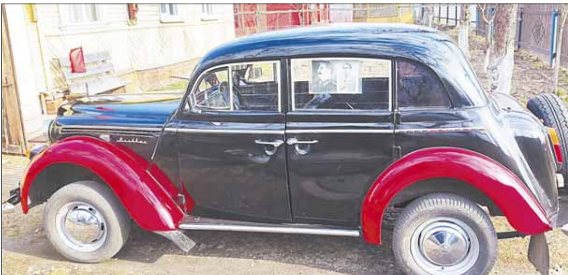
Сразу понятно – водитель родом из СССР.

"Ни копейки из семьи на машины не беру, даже всю пенсию отдаю супруге. Где-то подработаю, где-то сэкономлю... Потихоньку и восстанавливаю, – уточняет владелец ретро. – Хочу купить старенькую "Волгу", 24-ю – хозяева живут недалеко от моего дома. Но уж больно большие деньги запросили. Есть на примете и "козлик" – ГАЗ-69. Как только с документами всё решится, может, и возьму его на реставрацию".