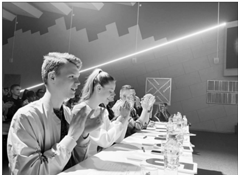
Бывший чемпион юниор-лиги теперь в жюри.

"Конечно, сначала не все могут шутить, и командам помогают кураторы-авторы, но после года занятий у детей раз-