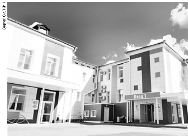
Обновленные детские поликлиники выглядят ярко и красочно.

Проект "Решаем вместе" появился в Ивановской области по инициативе губернатора Станислава Воскресенского. В 2020 году в региональный бюджет вернулись более 700 млн рублей, которые в 2011-м фонд поддержки предпринимательства выделил компании "Ивановский бройлер". Как потратить вернувшиеся деньги, решали сами жители с помощью голосования. Тогда ивановцы выбрали улучшение здравоохранения региона и приведение в порядок обветшалых и несовременных детских поликлиник, а также формирование штата врачей в медучреждениях, чтобы люди могли без проблем записаться к нужным специалистам.