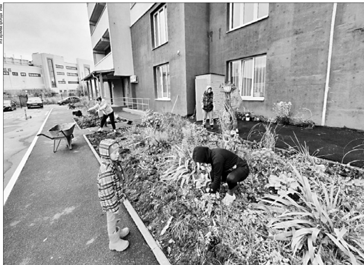
Правильному озеленению ивановцы могут обучиться бесплатно.

...Озеленение общественных пространств — важная миссия и сложная работа властей, экологов и жителей. Совместные усилия помогут сделать городские пространства экологичнее, красивее и зеленее.