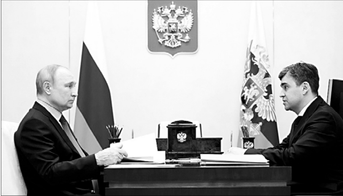
Владимир Путин поддержит Станислава Воскресенского на выборах.

10 мая ивановский губернатор встретился с президентом Владимиром Путиным. Глава региона рассказал, как изменилась область за последние пять лет и что еще предстоит сделать. Во время доклада президенту Станислав Воскресенский заявил, что планирует участвовать в выборах губернатора в сентябре. Владимир Путин сказал: он поддержит Воскресенского, если доверие ему окажут жители области