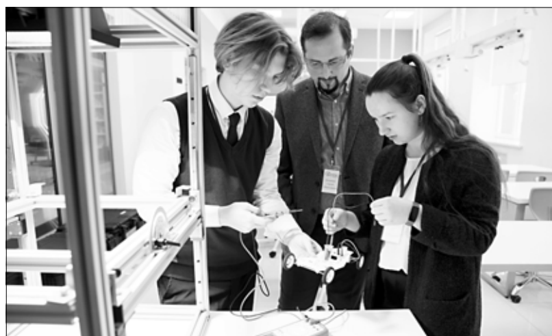
Занятия в "Солярисе" начались в конце 2022 года.