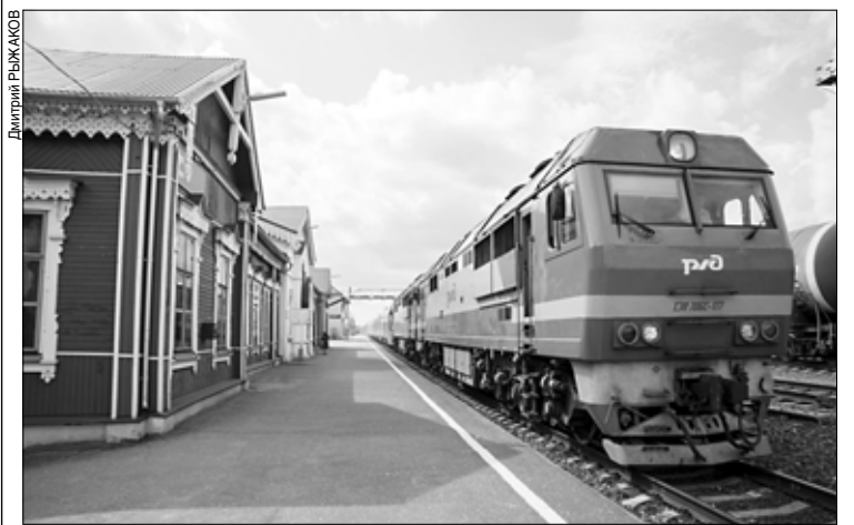
Дорога до Нижнего Новгорода на "Ласточке" займет чуть более трех часов.

Восемь городов Ивановской области связали с областным центром пригородные рельсовые автобусы "Орлан". Первые "Орланы" начали курсировать по маршруту Иваново — Кинешма — Иваново в июле 2020 года. С 2021 года "Орланы" доставляют пассажиров из Иванова в Ковров и Нерехту. С мая 2021 года в регионе курсируют еще семь пригородных рельсовых автобусов: из Иванова — в Фурманов, Шую, Нерехту, Тейково и Гаврилов Посад, из Нерехты — в Шую, из Гаврилова Посада — в Тейково.