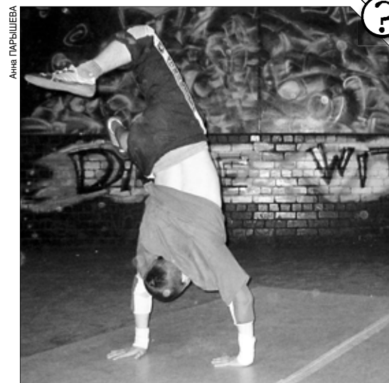
Опасные развлечения подростков иногда подпадают под статьи Уголовного кодекса.