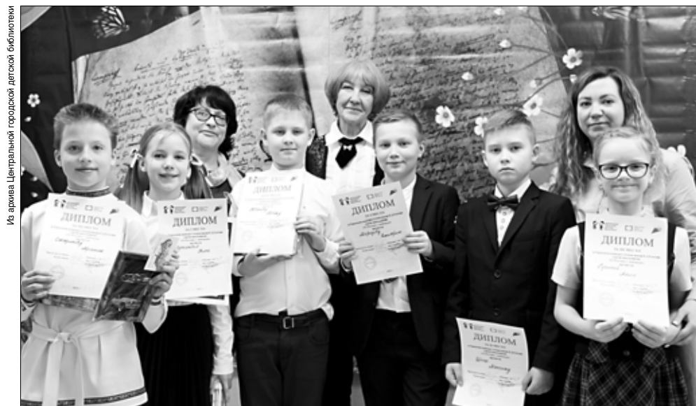
Победители конкурса чтецов среди учащихся 1–7-х классов.