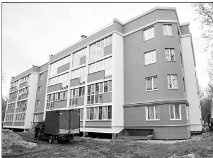
Долгострой на Володиной, 5, будет готов к лету.

441 обманутый дольщик Ивановской области получит квартиры до конца года. Еще 39 владельцам квартир в недостроенных домах выплатят денежные компенсации. После этого данная проблема будет полностью решена. "Пять лет назад у нас было 2760 дольщиков, сейчас осталось 480. Мы ориентируемся на ваше поручение, что до конца года эту проблему надо закрыть", – сказал Воскресенский на встрече с президентом. С 2019 года недостроенными объектами занимается специально созданный российским правительством Фонд поддержки граждан – обманутых дольщиков. Он вступает в права застройщика, обследует дом, дорабатывает проектно-сметные документы и ищет нового подрядчика. Один из крупных долгостроев в Иванове – на улице Володиной, 5 – строители должны сдать по контракту к 1 июня.