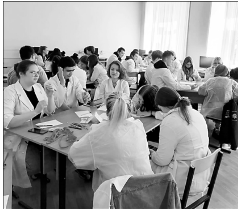
В ходе игры учащиеся стали менеджерами по продажам, экономистами, мастерами цеха по выращиванию птицы...

"Несмотря на трудности, команды сохраняли позитивный настрой, сосредоточенность и энтузиазм на протяжении всей игры, демонстрируя высокий уровень мастерства. Это был интересный и увлекательный опыт, который позволил получить ценные знания о мире птицеводства", — отмечает издание.