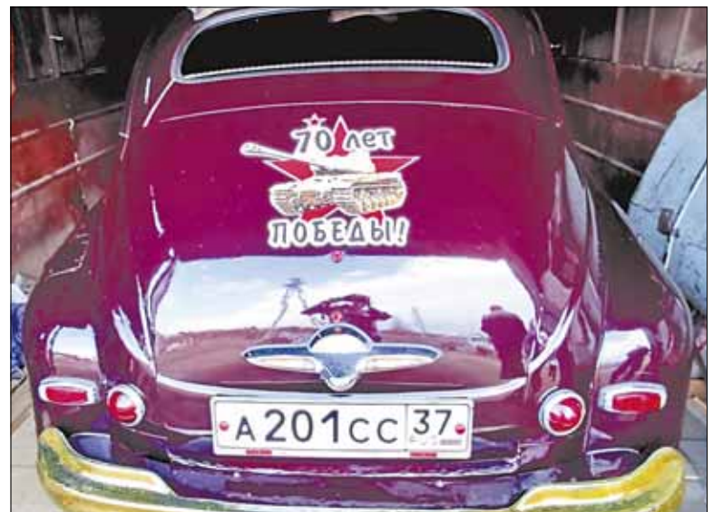
"Победа" обязательно выезжает 9 мая.