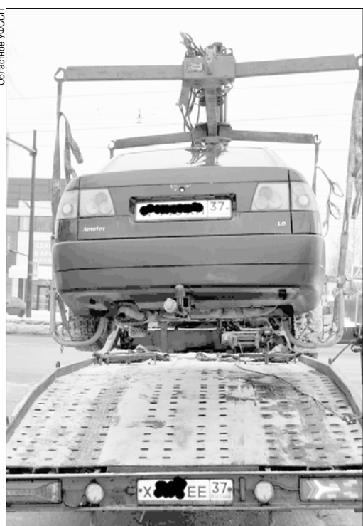
Судебные приставы могут арестовать автомобиль прямо на дороге.

Должник может заплатить задолженность на месте, в противном случае пристав вправе наложить арест на его имущество, в частности на автомобиль. Если человек не решит в десятидневный срок вопрос с задолженностью, авто будет реализовано.