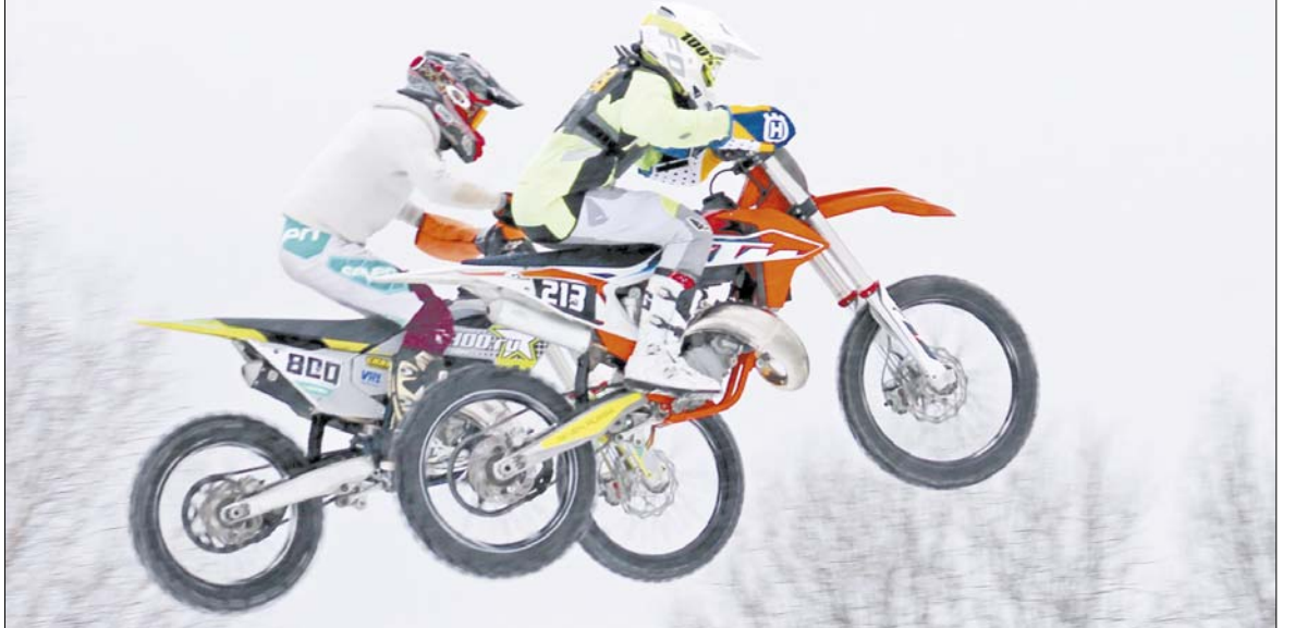
В прыжке – гонщики из Нижнего Новгорода и Коврова.