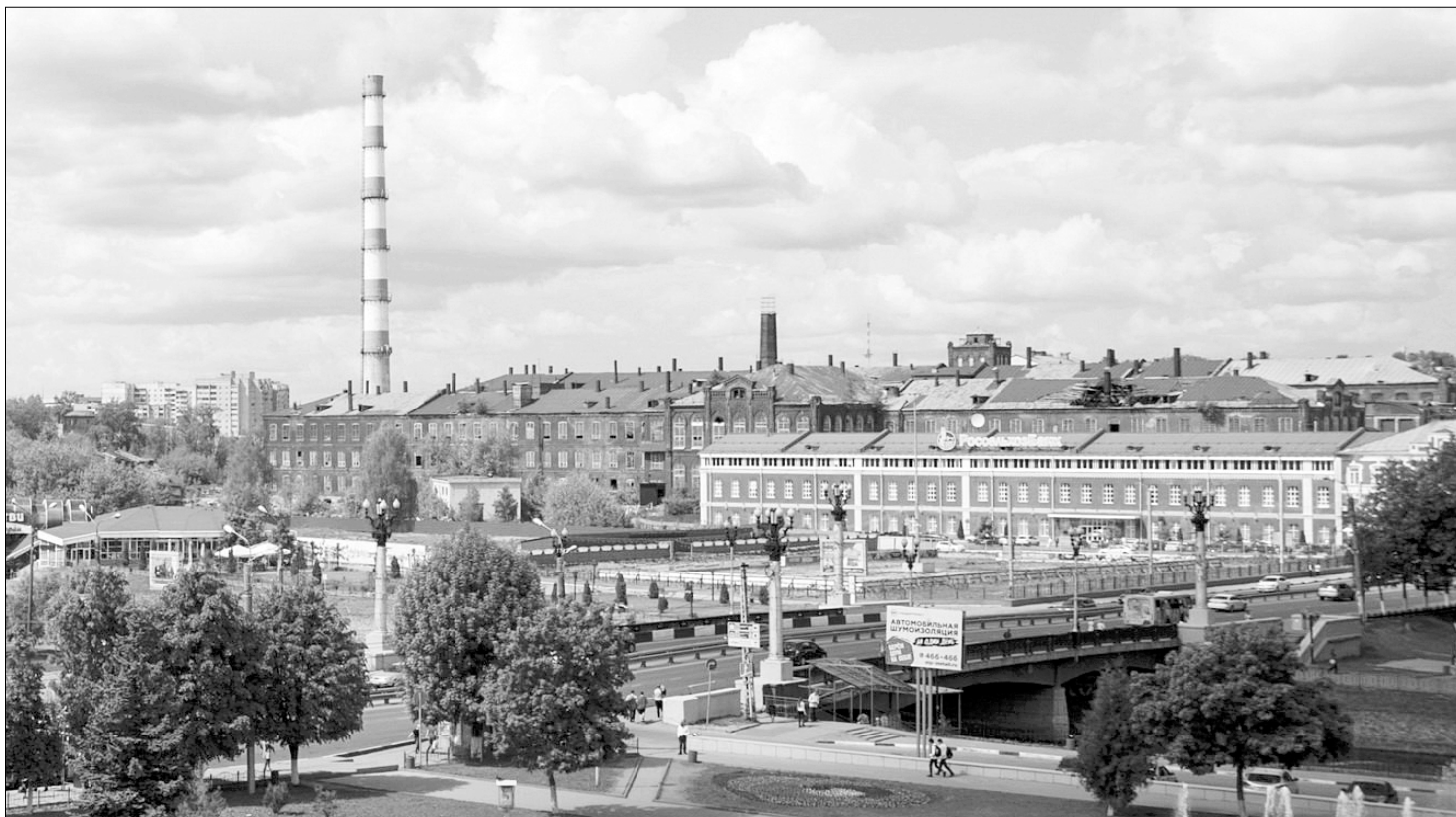
Старые корпуса превратятся в современное многофункциональное образовательное пространство.

— Количество бюджетных мест в ивановских вузах в целом не уменьшается. Особенно повезет тем выпускникам школ, которые выбирают для поступления приоритетные направления — математика, физика, химия, биология, информатика, история, педагогика, социология. В этом году в Ивановском государственном университете вместе с Шуйским филиалом будет идти прием на 974 бюджетных места, из них — 647 на бакалавриат.