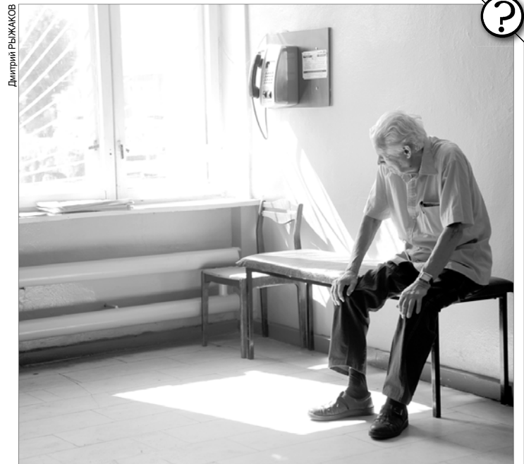
Чтобы поместить человека в дом-интернат, надо получить его согласие.

Но направление в дом-интернат для престарелых и инвалидов носит заявительный характер, поэтому требуется согласие пенсионерки.