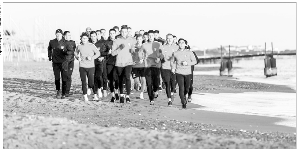
В Турции ивановцы проведут несколько контрольных матчей.