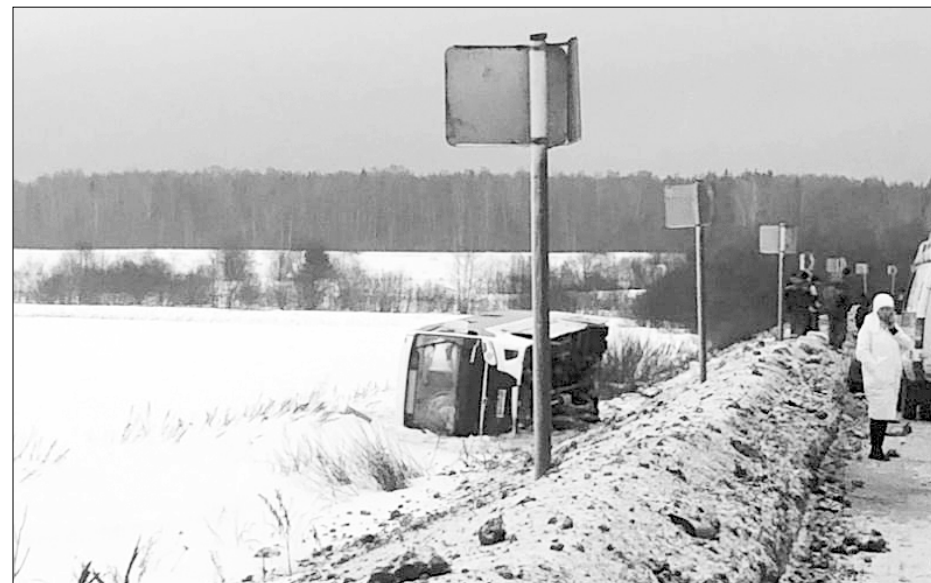
Поездка родниковцев на работу в Горино чуть не закончилась трагедией.

В результате ДТП четыре человека получили травмы — ушибы.