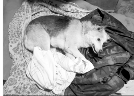
Жители защищали собаку как могли.

Утром жители микрорайона Электроконтакт обнаружили на снегу большие пятна крови. Следы привели к лежащей