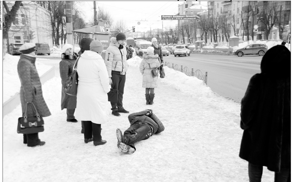
Специалисты уверяют, что согреться водкой бессмысленно.

А наследственность? Считается, что существуют конкретные генетические особенности, которые делают некоторых людей более склонными к развитию зависимости от алкоголя. Люди,