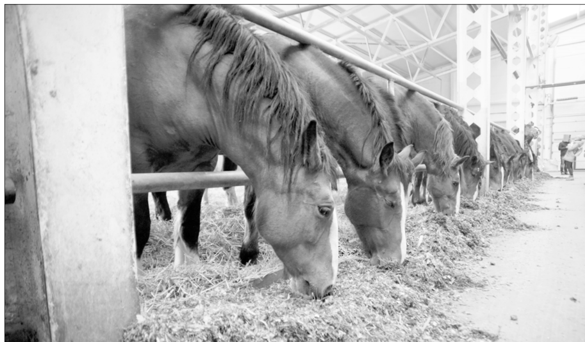
Владимирских тяжеловозов сегодня разводят в растениеводческом хозяйстве "Родина" Гаврилово-Посадского района.