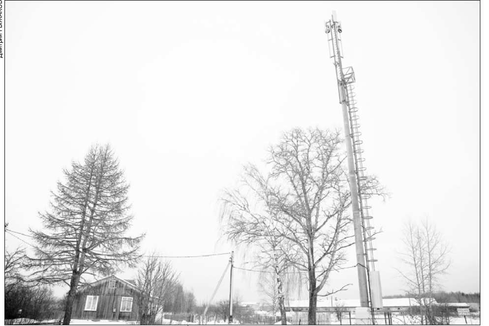
За два года высокоскоростной мобильный интернет придет в 32 села.

Устранение цифрового неравенства предусматривает проведение современной мобильной связи, включая высокоскоростной доступ в интернет по технологии LTE (4G), в населенных пунктах с числом жителей от 100 до 500 человек. Базовые станции подключат преимущественно к волоконно-оптическим линиям связи. Проект рассчитан до 2030 года.