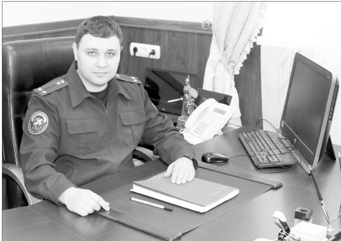
О нарушениях следователи узнают в том числе из СМИ и соцсетей.

2021 году до 180 в 2022-м, из них показатель тяжких и особо тяжких увеличился вдвое — до 107. При этом жертвами преступлений несовершеннолетние становились реже (количество таких преступлений снизилось с 234 до 154).