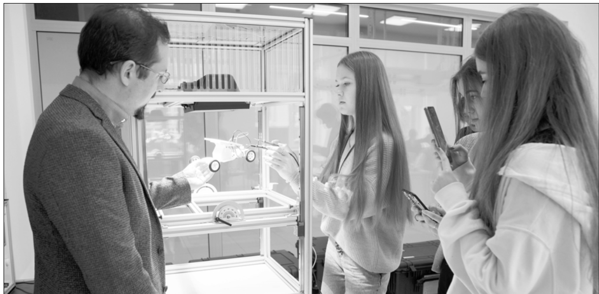
После интенсивов в "Солярисе" школьников ждет зачет.