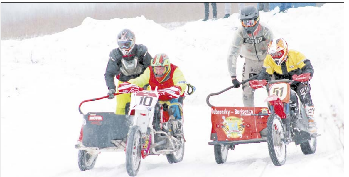
В гонках мотоциклов с колясками участвовали 11 экипажей.