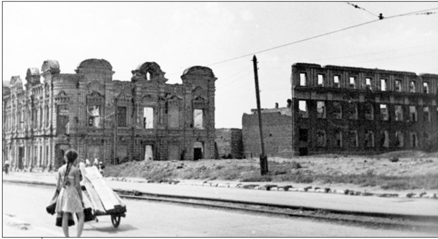
На жилые кварталы Сталинграда захватчики сбросили тонны фугасных и зажигательных бомб.

Для Сталинградского порта кинешемские речники построили новую баржу грузоподъемностью 100 тонн. В апреле 1943-го она с грузом подарков причалила в волжский порт.