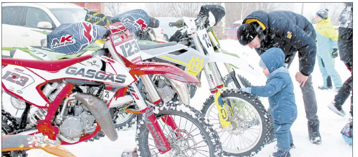
Первое знакомство с "железным конем".