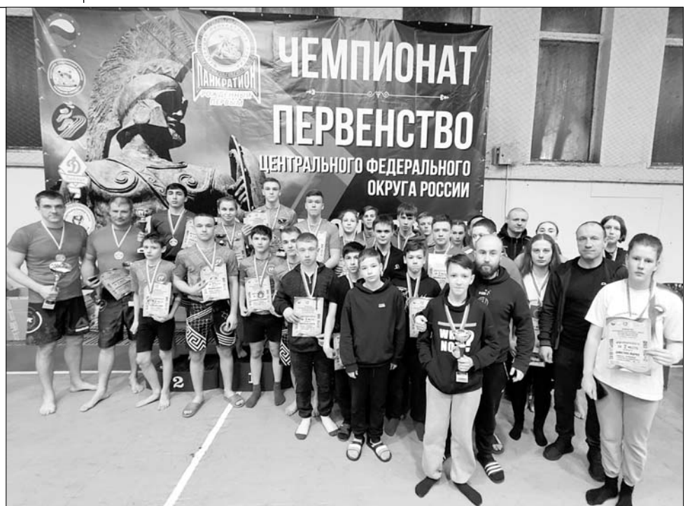
Материалы подготовила пресс-служба департамента спорта

Панкратион – это древний олимпийский вид единоборств, возрожденный в наше время. Соревнования по панкратиону проводятся в один раунд, длящийся три минуты у детей и пять – у взрослых. В защитное снаряжение входят шлем, перчатки, биндаж. Каждый вид удара приносит бойцу определенное количество очков. В бою запрещено бить в пах, по коленям, позвоночнику, затылку, выполнять тычки в глаза и горло, бить лежащего, поворачиваться к сопернику спиной во время атаки... За первое нарушение объявляется замечание, за второе – предупреждение и противнику добавляется два очка, после трех предупреждений следует дисквалификация.