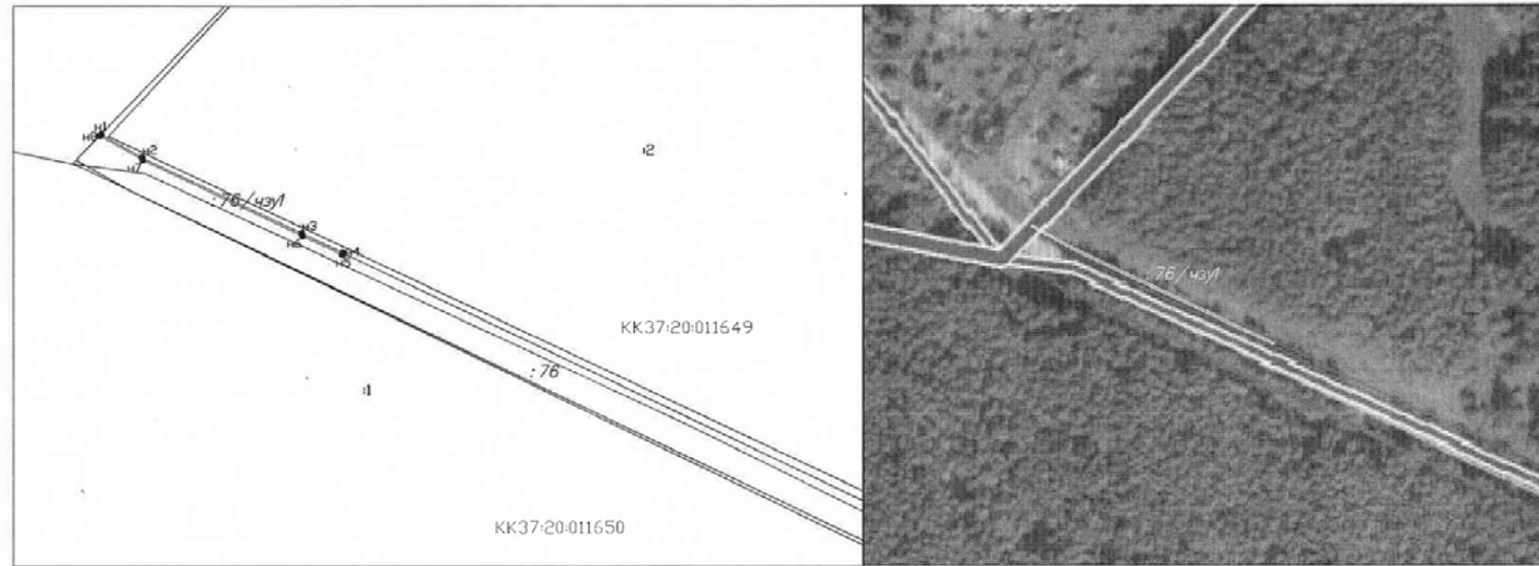
Графическое описание местоположения границ публичного сервитута, устанавливаемого в целях прокладки и эксплуатации ВЛ-10кВ от опоры №97 ВЛ-10кВ №139 Очистные сооружения

Условные обозначения: - границы ранее отведенного земельного участка; - граница устанавливаемого земельного участка; - граница зон с особыми условиями использования территорий; - граница кадастрового квартала.