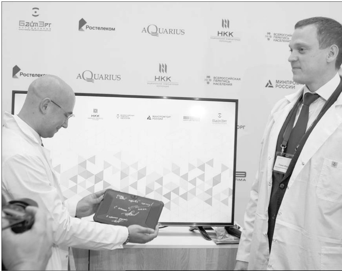
Шуйский "Аквариус" выпустит больше 200 000 планшетов для переписчиков.

пандемии, еще много предстоит практических задач.