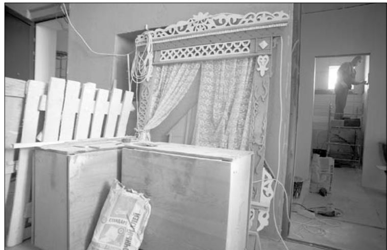
Скоро этот реквизит будет задействован.