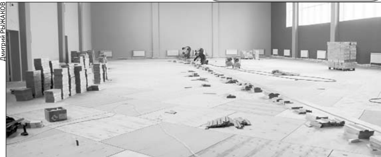
В физкультурно-оздоровительном блоке Дворца строители укладывают специальный паркет.

Ивановский Дворец игровых видов спорта состоит из спортивного и физкультурно-оздоровительного блоков. Спортивный блок включает в себя универсальный спортивный зал с трибунами на 2500 мест для проведения соревнований, учебно-тренировочных занятий и массовых спортивных мероприятий. Физкультурно-оздоровительный блок состоит из тренировочного спортзала, залов для индивидуальной силовой подготовки и единоборств, большой и малый залы для групповых занятий. Общая площадь Дворца спорта превышает 9000 кв. метров.