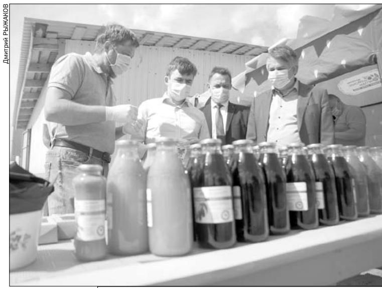
Из продукции "Шуйских ягод" производят вкусные напитки.

Крестьянско-фермерское хозяйство "Шуйские ягоды" запустило новую импортную систему полива ягод: она управляется