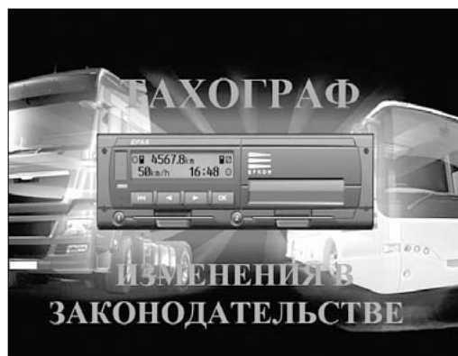
ИЗМЕНЕНИЯ В ЗАКОНОДАТЕЛЬСТВЕ

ВНИМАНИЕ! Прием может проводиться дистанционно. Телефон: 93-77-54.