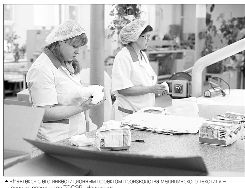
«Навтекс» с его инвестиционным проектом производства медицинского текстиля — один из резидентов ТОСЭР «Наволоки».

СПРАВКА «ИГ» Территория опережающего социально-экономического развития — это экономическая зона, в которой российским правительством установлен особый правовой режим для бизнеса с целью создания благоприятных условий для привлечения инвестиций, ускорения социально-экономического развития и организации комфортных условий для обеспечения жизнедеятельности населения. ТОСЭР создается сроком на 10 лет, но предусмотрено продление этого статуса еще на 5 лет. ТОСЭР может быть создана только в границах моногородов (их на сегодняшний день в Ивановском регионе десять). Резидентам ТОСЭР будет предоставлен широкий спектр налоговых льгот. К примеру, нулевая ставка налога на землю и имущество, льготные ставки по налогу на прибыль, снижение размера страховых взносов с 30 до 7,6%. В числе преференций для бизнеса — особый режим контроля и приоритетное подключение к объектам инфраструктуры, освобождение от уплаты НДС на товары, ввозимые для производственных нужд.