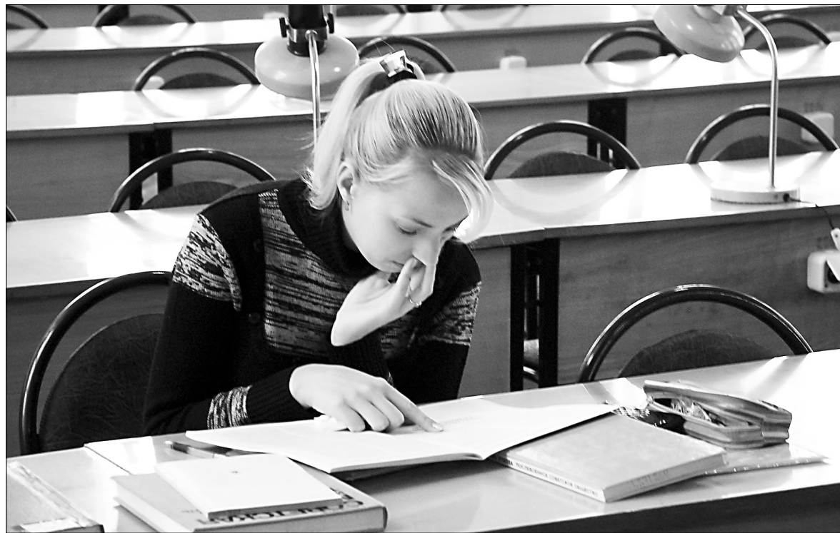
▲ Через читальный зал ивановской «наушки» прошло несколько поколений студентов.

На сайте областной научной библиотеки в разделе «Виртуальные выставки» работает выставка «Юбилей «Наушки». Становление библиотеки: 1918–1930-е гг., посвященная столетнему юбилею учреждения