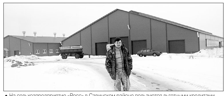
▲ На сельхозпредприятии «Росс» в Савинском районе пользуются льготными кредитами.

Как заявил первый замминистра сельского хозяйства Джамбулат Хатуов на селекторном совещании с представителями регионов, в этом году аграрии смогут получить льготные кредиты на сумму не менее 230 миллиардов рублей. Первый замминистра сообщил, что со всеми уполномоченными банками подписаны соглашения и на сайте Минсельхоза России размещен годовой план льготного кредитования. В документе указана информация о распределении лимитов на краткосрочные кредиты 2018 года и максимальные размеры льготных краткосрочных кредитов по регионам и направлениям. Уполномоченные банки (в нашем регионе это Россельхозбанк и Сбербанк) направляли в Минсельхоз реестры заемщиков, составленные совместно с региональными профильными департаментами. Минсельхоз после их утверждения рекомендовал в