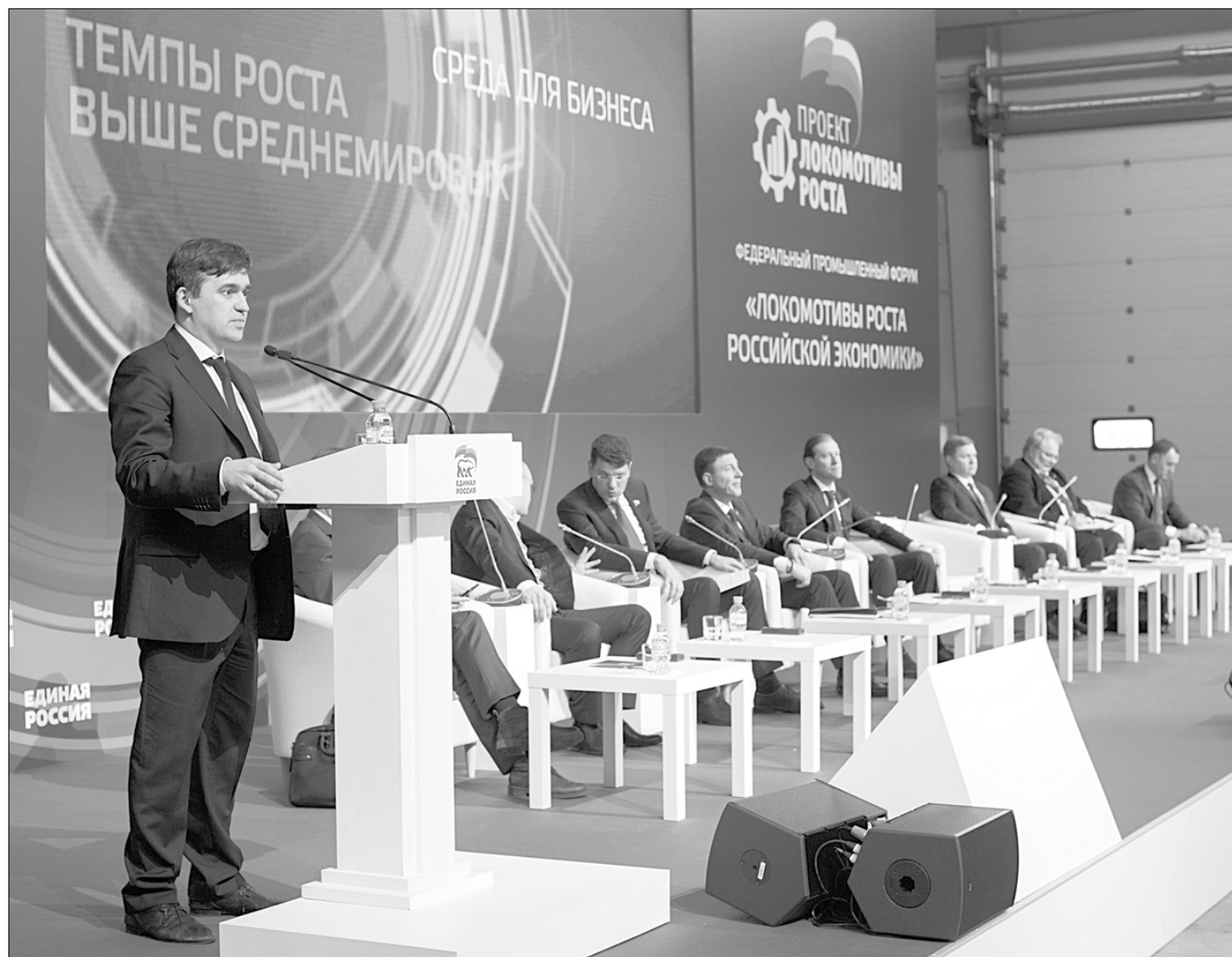
▲ Врио губернатора Станислав Воскресенский отметил на форуме потенциал роста экономики региона.

седателя Совета Федерации РФ, секретарь генсовета «Единой России» Андрей Турчак. Обращаясь к собравшимся, Станислав Воскресенский отметил, что потенциал для развития экономики региона есть во многих направлениях: машиностроении и текстильной отрас-