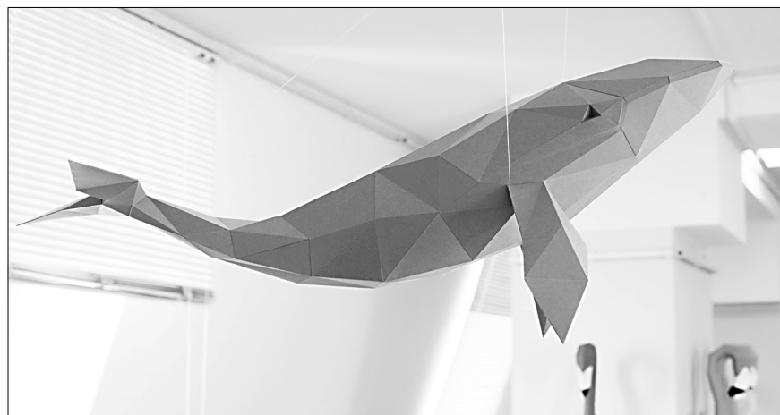
▲ Под потолком зала парит синий кит.