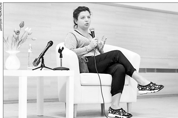
▲ Студенты задали госте вопросы, обменялись с ней мнениями по поводу послания президента России Федеральному собранию.