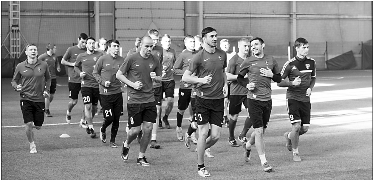
▲ «Текстильщик» готовится к сезону на «Локомотиве».