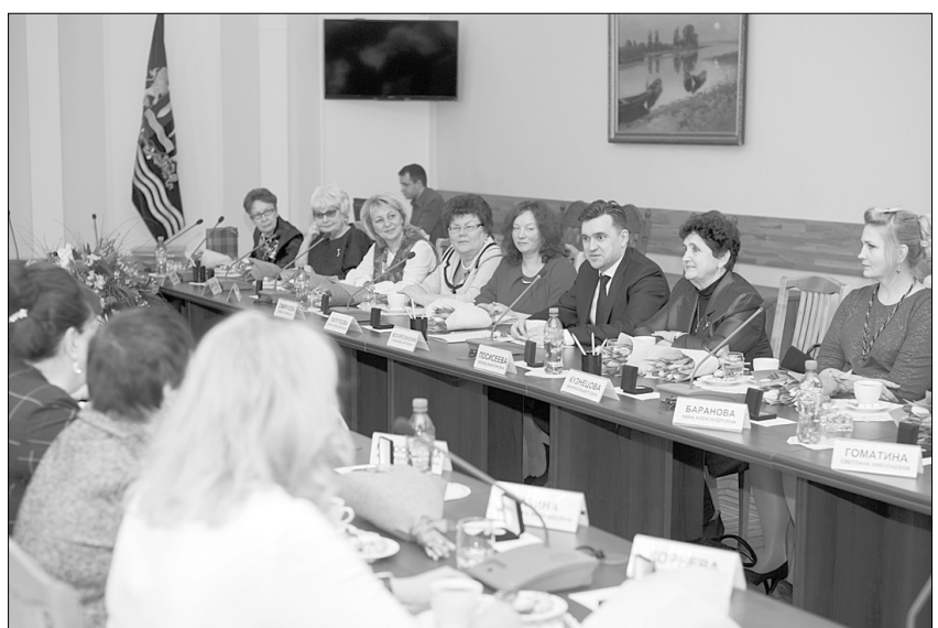
▲ За годы существования престижной премии ею были отмечены 42 наших землячки.

В этом году вручение премии «Женщина года» состоится сегодня, 7 марта, на торжественном мероприятии, посвященном Международному женскому дню.