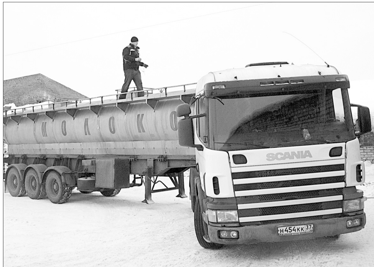
► Перерабатывающие предприятия снизили закупочные цены на молоко.

ства мечта — выкупиться из арендной зависимости. Собственник земли и не возражает: только заплатите 12 миллионов рублей. Но пока не будет господдержки в виде животноводческих субсидий и повышения закупочных цен на молоко, говорит председатель, это нереально.