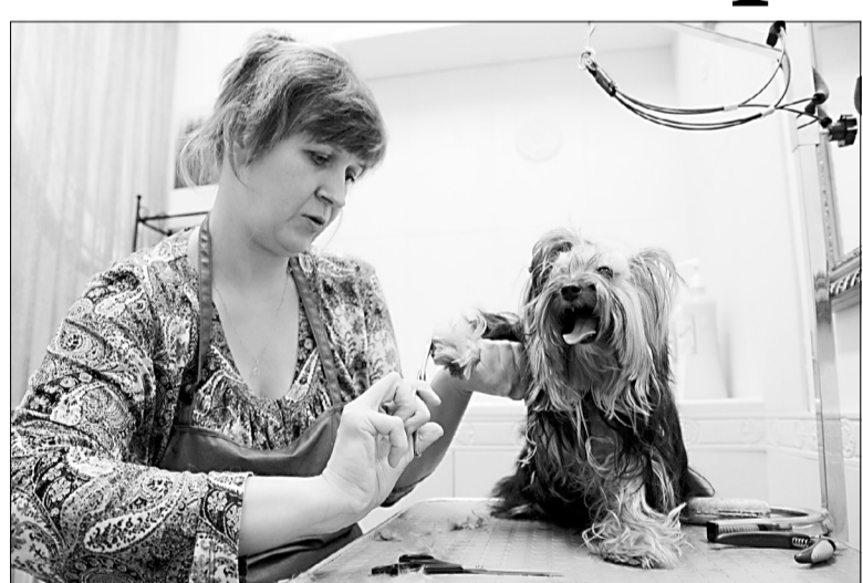
▲ Подстричь элитному псышку шерсть и коготки — удовольствие не из дешевых.