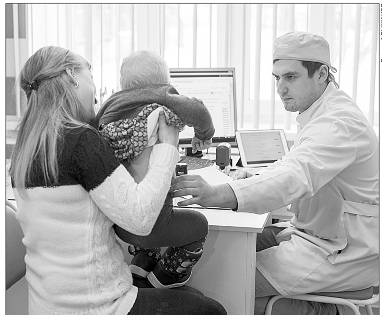
► В недавно отремонтированной поликлинике Старой Вичуги полный штат специалистов и новое оборудование.

В ходе рабочей поездки в Вичугский район глава региона посетил также фабрику имени Красина, где выпускают хлопчатобумажные ткани и шьют из них постельные белье и полотенца, а также поликлинику в Старой Вичуге и Новополицескую школу.