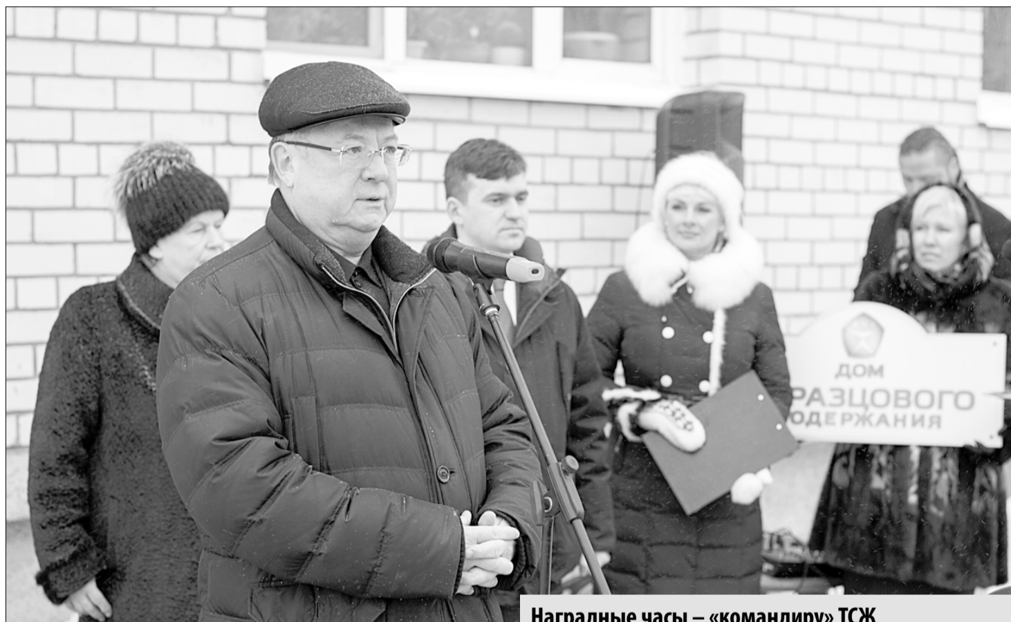
▲ В Шуве Сергей Степашин передал жильцам образцового дома памятную табличку.

Нужно разобраться, где в Ивановской области были сбои и что нужно сделать, чтобы не допустить смещения сроков выполнения федеральных программ внедрения. Сейчас регион – чемпион в кавычках: во многих рейтингах мы занимаем первые позиции с конца, но по реализации госпрограмм мы должны стать настоящими чемпионами.