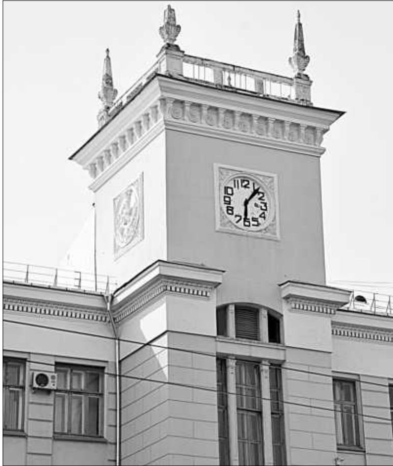
Когда-то часы на почтамте показывали два времени.

Старейшие уличные часы в Иванове – это, конечно, хроно-