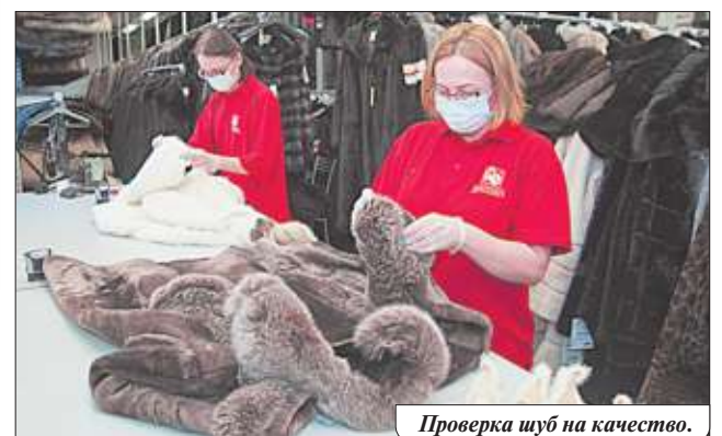
Проверка шуб на качество.

Все меховые изделия Новоторжской ярмарки соответствуют российским ГОСТам и требованиям технического регламента Таможенного союза «О безопасности продукции легкой промышленности», чипированы. При покупке выдается товарно-гарантийный чек. К услугам покупателей – расчетно-кассовый центр, где вы можете оплатить покупку наличными деньгами или банковской картой, купить любую шубу в кредит.*