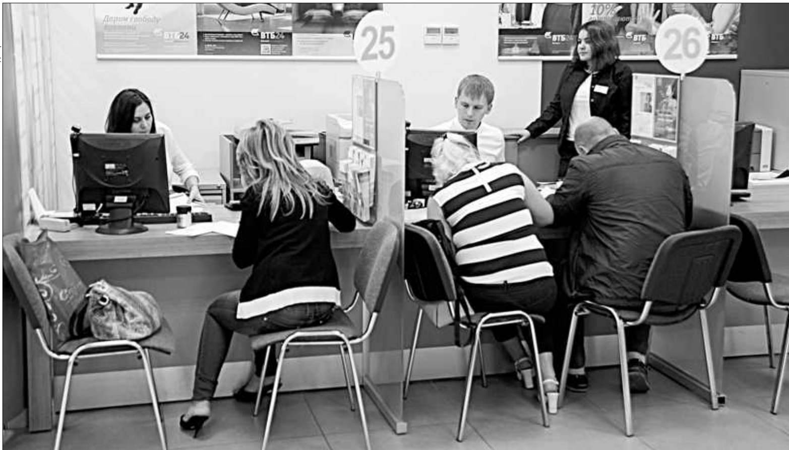
Чтобы понять, выгодно ли вам перекредитовываться, обязательно просчитайте все нюансы.

но со счета одного банка на счет в другом. Заемщик, который хотел перекредитоваться на более выгодных условиях, вынужден был самостоятельно находить деньги (например, перехватывать у знакомых на день), чтобы покрыть один кредит и тут же взять второй, чтобы вернуть деньги знакомым». Выгода, по словам Сергея Сергеевича, тоже была, но многих отпугивала такая беготня. Теперь же банки значительно упростили процедуру.