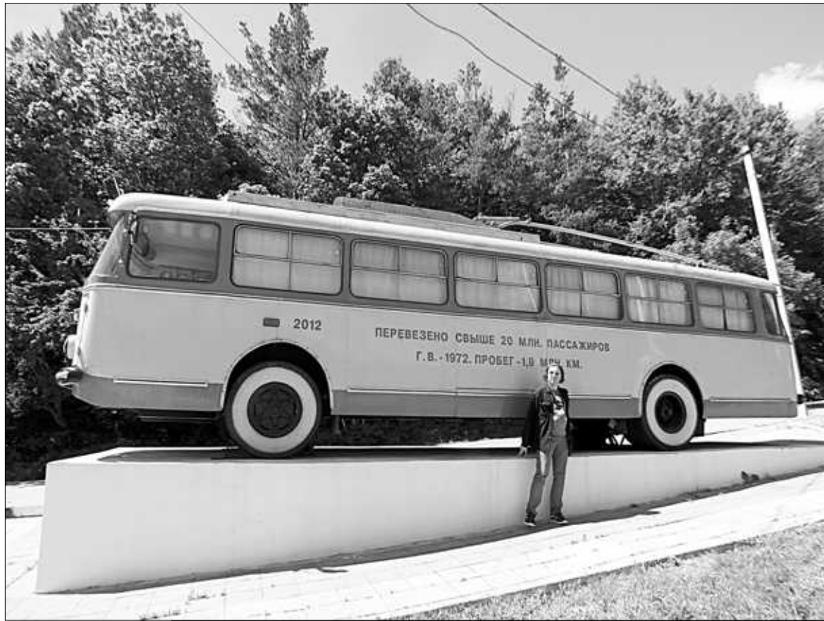
На горном перевале установлен памятник крымскому троллейбусу – легендарная модель Skoda.

зал определенно прекрасен и чист, не в пример большинству собратьев. Сам же город, скрытый от ласкового Чёрного моря высокой (до полутора километров) грядой гор, расположен в центре полуострова, здесь пути отдыхающих расходятся: кому-то на восток (Феодосия, Коктебель, Новый Свет, Судак), кому-то на запад (Евпатория, Севастополь, Балаклава), а лично мне – на юг. Ибо, как гласит известная ялтинская поговорка – «лучше Крыма может быть только южный берег».