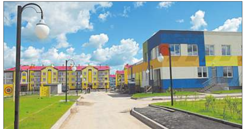
В микрорайоне «Просторный» воплотили уникальную для нашего региона концепцию «дворы без машин»: парковочные места расположены по фасадной части домов.

Квартиры в «Просторном» сдаются с чистой отделкой, с центральным и автономным отоплением, что позволяет ощутимо сэкономить на содержании жилья. Любопытно, что квартира такого же уровня в Иванове обойдется в сумму, на которую в «Просторном» можно купить и квартиру и машину. Неудивительно, что жилье в микрорайоне пользуется большой популярностью. Уточним, что сроки строительства малоэтажных домов намного меньше,