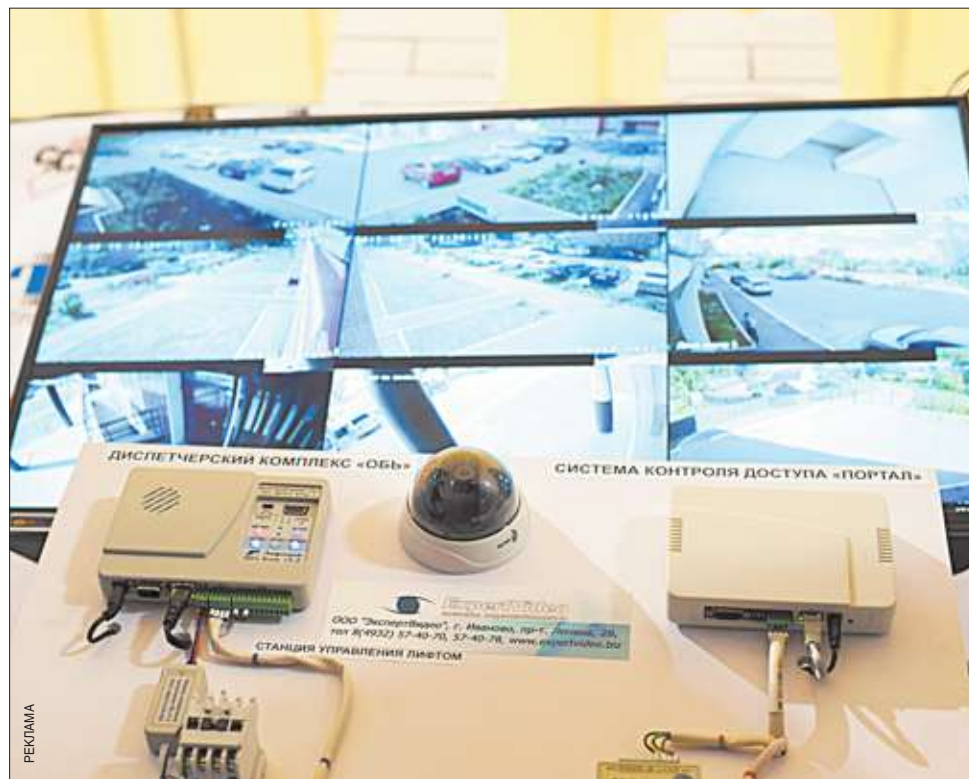
Диспетчерский комплекс «Обь» позволяет дистанционно следить за состоянием лифта в режиме онлайн.