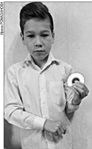
Такие модные игрушки крутятся в руках у ивановцев.

На дверях ивановских магазинов тут и там бросаются в глаза вывески: «спиннеры в ассортименте». «Был период, когда спрос превышал предложение», – рассказал про-