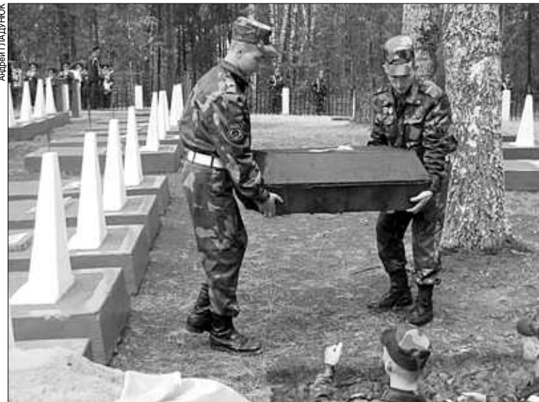
Скорбный и торжественный момент...