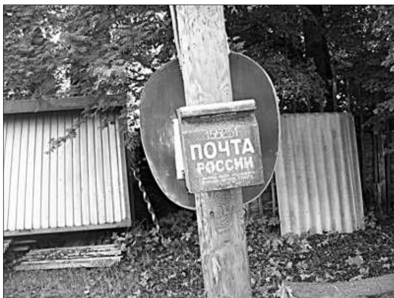
Ржавый почтовый ящик напоминает о лучших временах деревни.

...У новой дороги напротив Андронихи у бытовки дорожников собралась чуть ли не вся деревня. Жители, в основном пенсионеры, говорили корреспонденту «ИГ», что не верят, будто подъезд в саму деревню