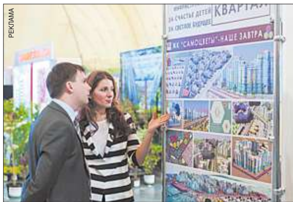
На выставке «Строительство и ЖКХ» можно было во всех подробностях узнать о комфортной среде в микрорайонах, возводимых ГП «Квартал».

Первым по-настоящему большим опытом застройки, в полной мере учитывающим принцип создания современной городской среды, для жителей стал малоэтажный микрорайон «Новая Ильинка», в котором кроме доступного и комфортного жилья создана инфраструктура, необходимая для счастливой жизни.