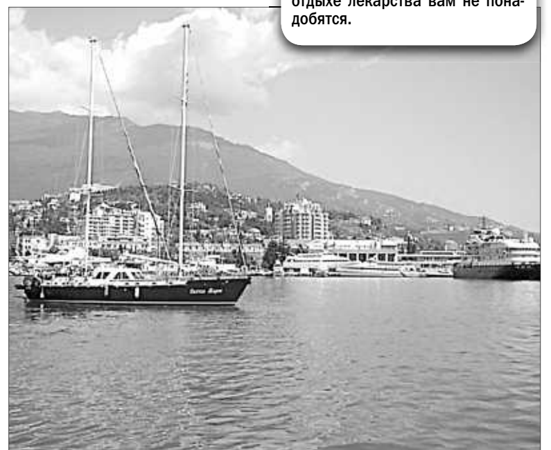
В Ялтинском порту живописно и оживленно.

Ялта знаменита домами творчества писателей и театральных деятелей (Аркадий Райкин, Андрей Миронов, Анатолий Папанов, Алиса Фрейндлих, Михаил Боярский и Вера Васильева отдыхали только здесь!), а также крупнейшими комплек-