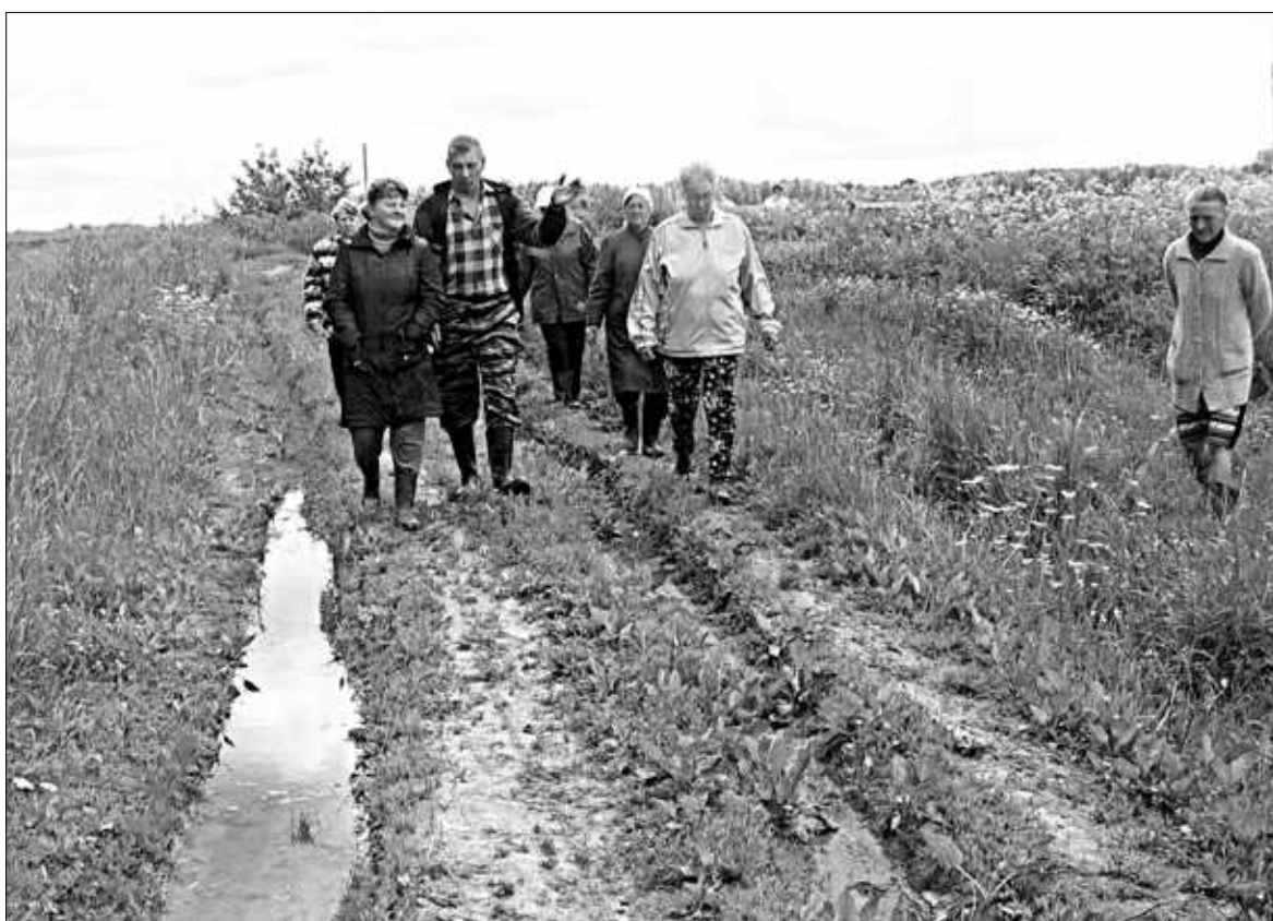
Трудный путь от новой дороги домой.