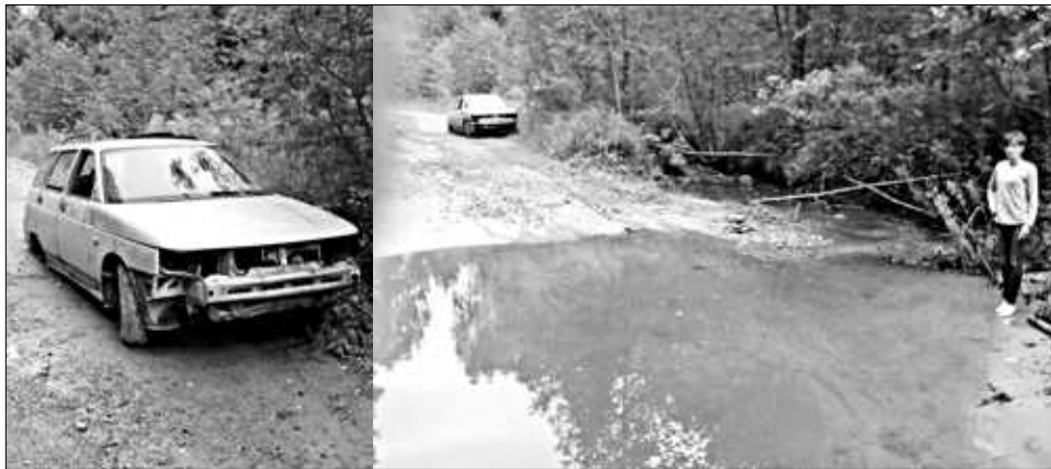
Вытащить машину из реки помог водитель на узике.

ВАЗ 2111 не справился с течением и начал вязнуть, пишет информационное издание «168 часов». Мать с дочкой выскочили и стали подкладывать под ко-