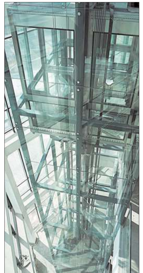
Сотрудники ООО «Транслифт» могут смонтировать лифтовое оборудование любой сложности.

«Лифтремонт», «Транслифт» и другие компании группы постоянно стремятся улучшать качество своей работы и гарантируют высокий уровень предоставляемых услуг. Недаром девиз этих предприятий: «Опыт и традиции, накопленные годами. Гарантия и качество, подтвержденные жизнью».