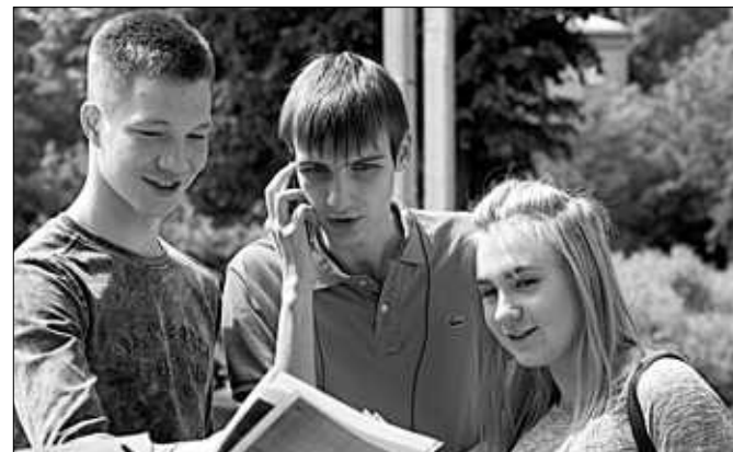
Современным школьникам некогда расплыться на «ненужные предметы»...