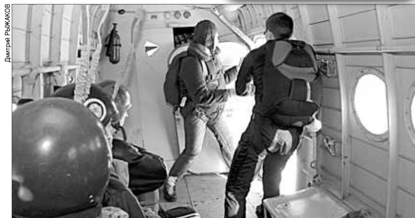
Такую же парашютную подготовку проходят в 98-й дивизии и парни из Крыма.