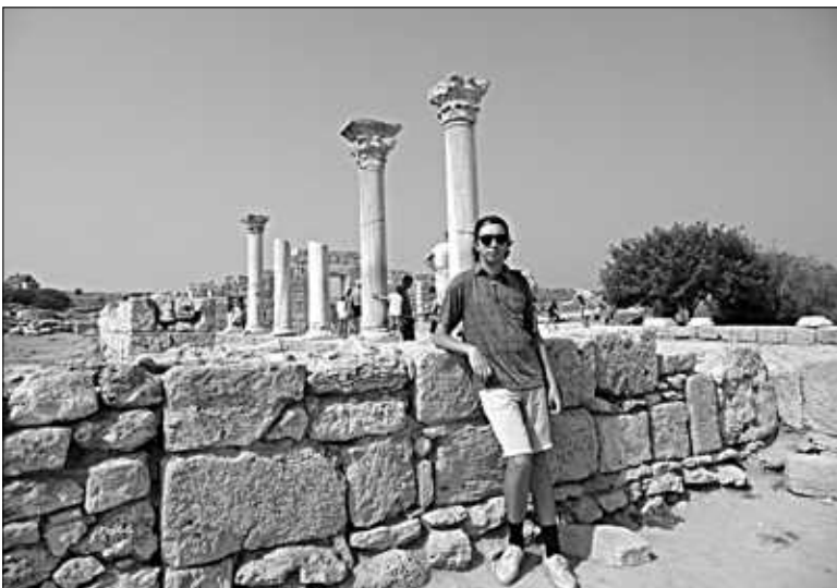
Херсонес Таврический – античный город на самом берегу моря.

А вот цены на лекарства почему-то в два раза выше общероссийских. Впрочем, надеюсь, на отдыхе лекарства вам не понадобятся.