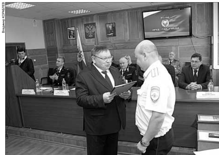
С профессиональным праздником сотрудников и ветеранов ведомства поздравил глава региона.