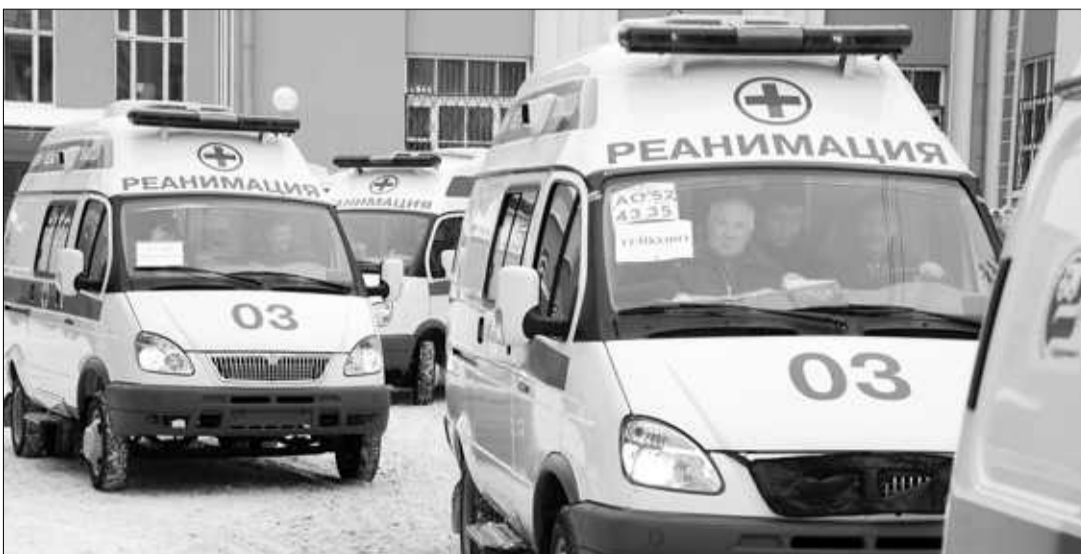
▲ В рамках федеральной программы регион получил 21 машину скорой помощи.

Во-вторых, состояние некоторых дорог — особенно в сельской местности — оставляет желать лучшего. В распутицу автомобили скорой помощи просто не могут доехать до больного. Большинство ФАПов и офисов врачей общей практики имеют собственные транспортные средства — велосипеды и скутеры, но зимой они бесполезны. В текущем году будет проведен ремонт дорог в Савинском, Тейковском, Лежнев-