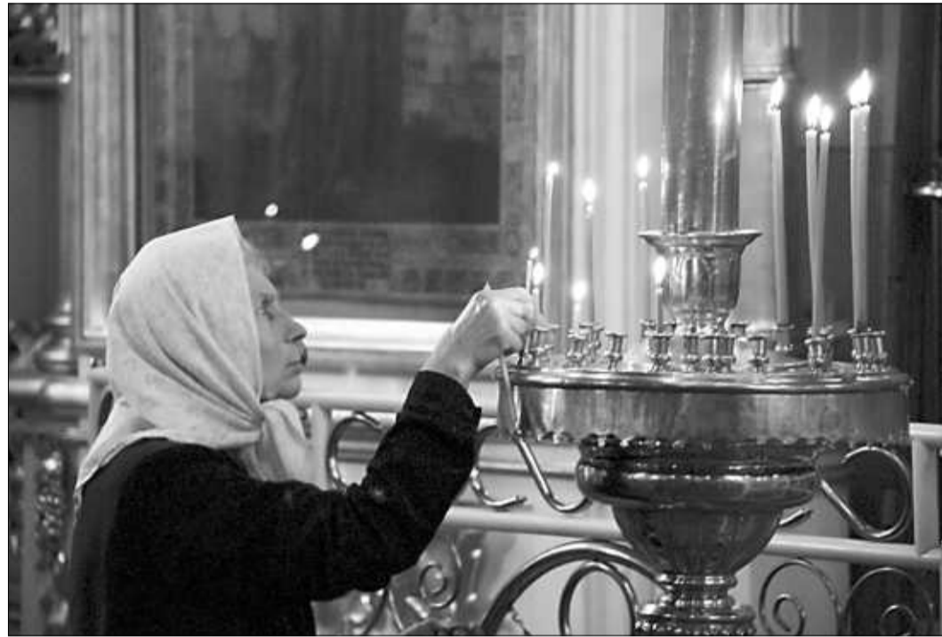
▲ В ближайшие недели принято усиленно молиться, помогать ближним и избегать излишеств.

не скандалить, помогать близким, участвовать (в том числе материально) в благотворительных проектах.