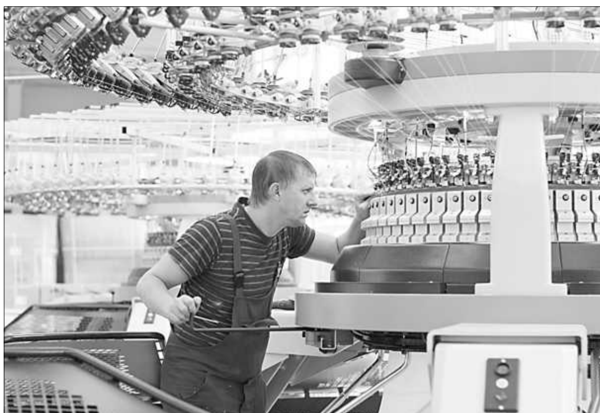
▲ Специалисты, освоившие дефицитные профессии, могут хорошо зарабатывать и без вузовского диплома.

Неплохо можно заработать и в сфере услуг: Парикмахер, не являющийся индивидуальным предпринимателем, работая в салоне у хозяйки, может получать около 30-40 тысяч рублей в месяц. Посчитайте, сколько за это время зарабо-