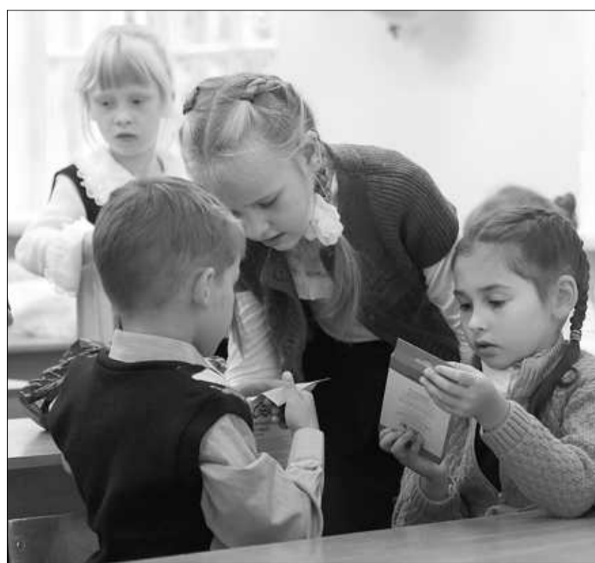
▲ Дорог не подарок, а... Нет, и подарок тоже!