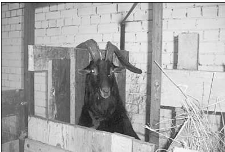
Козел Эмир позирует на фотокамеру.