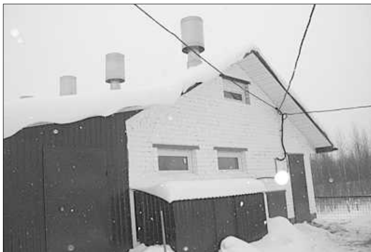
Новая козья ферма возведена с нуля.

На ферме сухо и чисто. И никаких сквозняков: козы их плохо переносят. Животные любят, чтобы у них всегда была вода — она регулярно подается в помещение. Посередине фермы — огромная телега, приспособленная под кормушку с сеном. Правда, в день моего приезда козы налегали на сухой веточный корм.