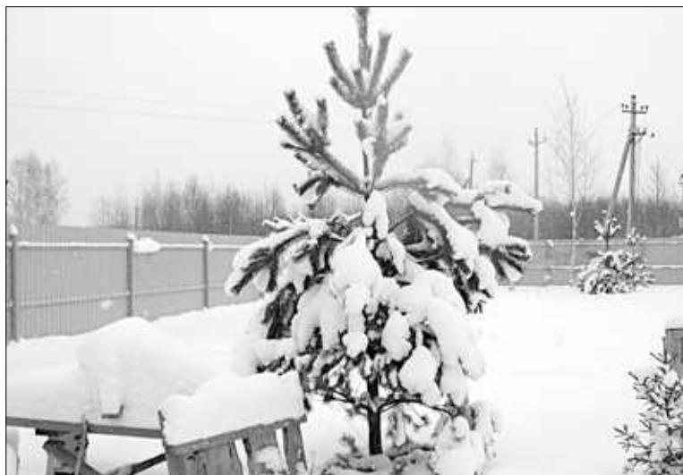
Вид на пастбище: летом здесь будут пастись козочки.