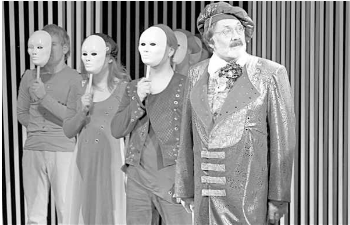
Актер занят и в современных постановках, и в классических пьесах.

ну Набокова написал англичанин, а на русский язык ее перевел латыш, который вложил в перевод всю свою ненависть к русским ( улыбается ). Когда я открыл текст, сразу сказал, что это играть не буду: не переношу скабрзности и пошлости на сцене. Самого романа «Лолита» тогда в продаже еще не было, сравнить тексты не представлялось возможным. Того Гумберта, которого изобразил Набоков (по сути, больного человека), я играть согласился. Так и получилось, что я стал первым русским Гумбертом.