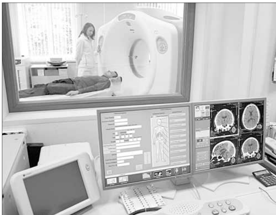
Исследование на магнитно-резонансном томографе по направлению лечащего врача проводят бесплатно.