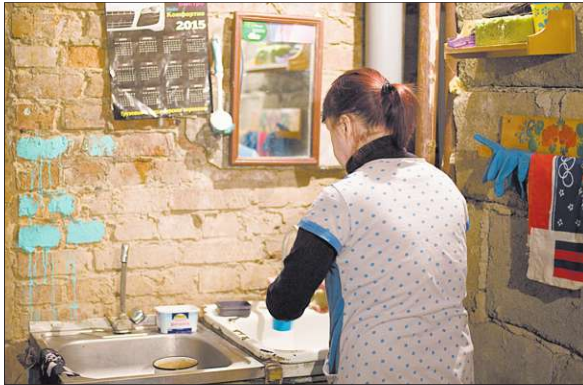
В таких условиях живут многие «подопечные» людей в погонах.