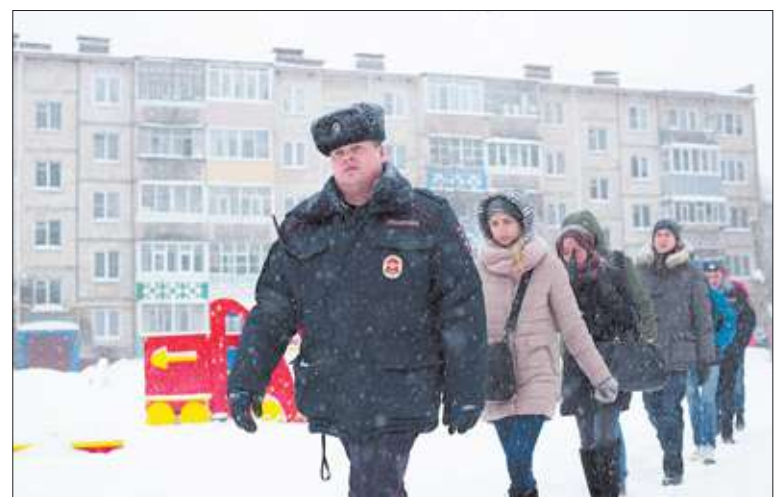
«Студенческий десант» отправился на экскурсию с участковыми.

— Здесь интереснее. Душевнее что ли... — не задумываясь, отвечает он.