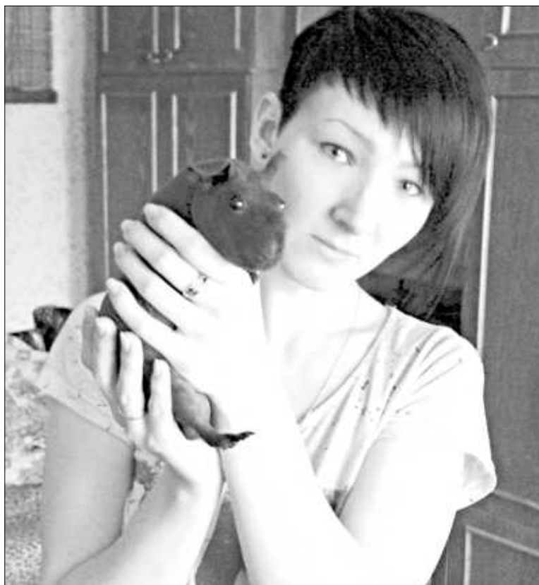
Хозяйка в своем питомце души не чаёт.

Большим преимуществом скинни считается отсутствие у