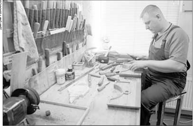
Губернатор обещал найти средства на развитие малого бизнеса.

В условиях весьма ограниченного бюджета губернатор пообещал найти дополнительные средства прежде всего на развитие малого бизнеса, которое он считает залогом успеха региональной экономики.