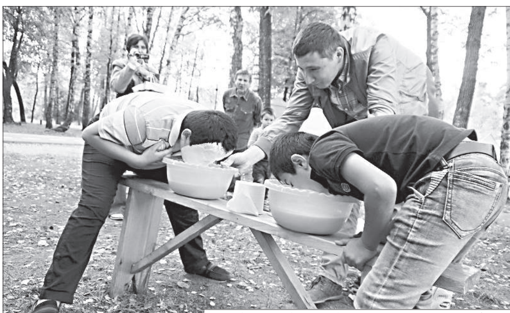
«Кефирные забавы» особенно впечатлили гостей праздника.