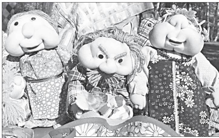
Умельцы со всей области представили на фестивале изделия, созданные своими руками.

Фестиваль под названием «Диалог культур: к миру и согласию» был организован сторонниками губернатора Ивановской области, Центральным советом сторонников партии «Единая Россия» совместно с Ивановским домом национальностей.