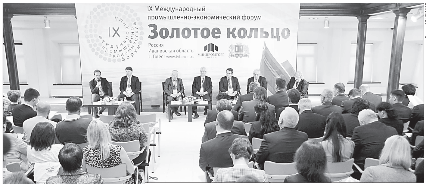
Плесский форум — важная площадка для разработки социально-экономической стратегии.