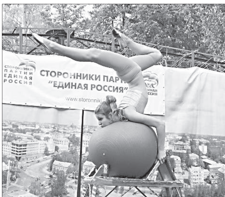
«Девочка на шаре».