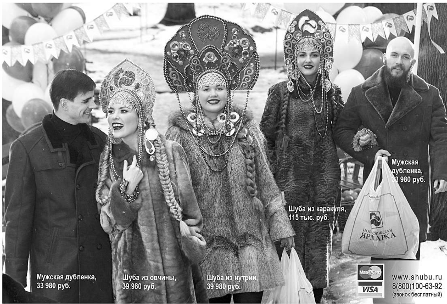
Мужская дубленка, 33 980 руб.

«ЗИМОС» - марка Новоторжской ярмарки. Кроме аукционного меха норки, для производства этих шуб используют сырье собственного